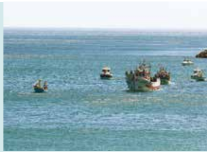
Homenagem aos Pescadores Falecidos | dia 3