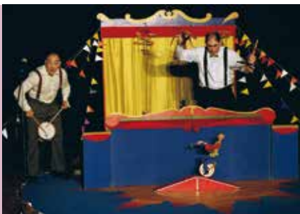
Titirircircus | dia 2