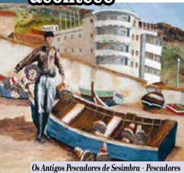
Os Antigos Pescadores de Sesimbra - Pescadores de Ontem, de Hoje e de Sempre | até dia 30