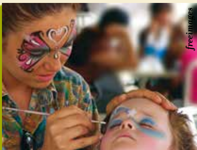
Pinturas Faciais | dia 1