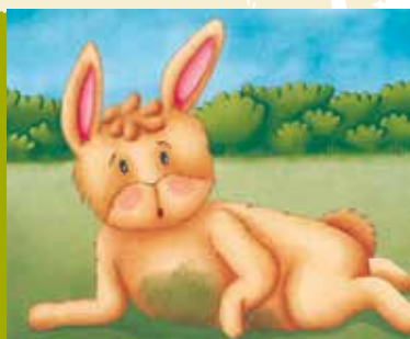
O Coelho Afonso | dia 26