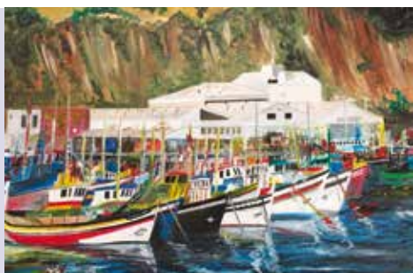
Sesimbra, Engenho e Arte | a partir de dia 26