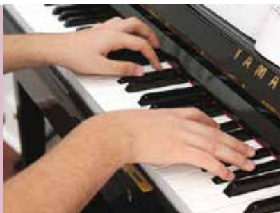
Da Guitarra ao Piano, de Bach a Vianna da Mota | dia 2