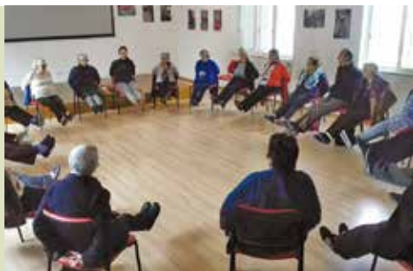
Clube Ativo | dia 6