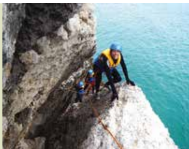
Meia-Velha | dia 10