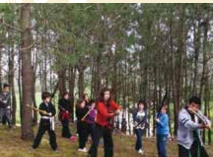
Ninja Kids | inscrições...