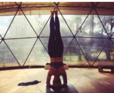
Retiro de Yoga | de 15 a 17