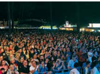
Feira Festa da Quinta do Conde | de 1 a 10