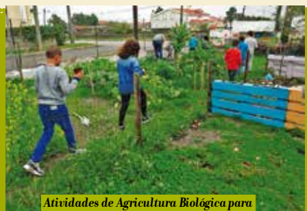
Atividades de Agricultura Biológica para a Comunidade Educativa | dias 6 e 13