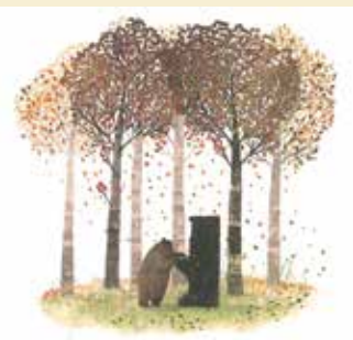
O Urso e o Piano | dia 9