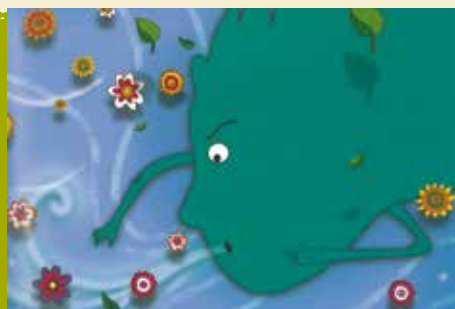
Um Pé de Vento | dia 12