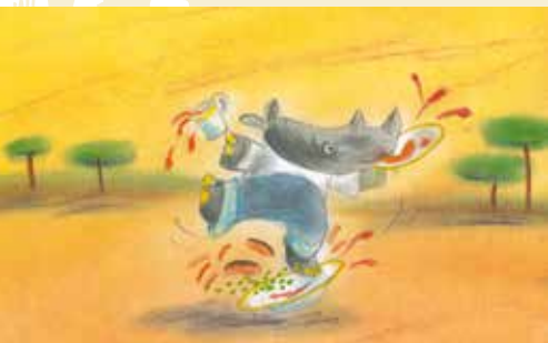
O Rinoceronte Muito Malcriado | dia 5