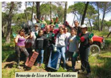
Remoção de Lixo e Plantas Exóticas na Lagoa Pequena | dia 9