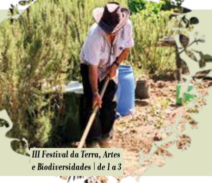
III Festival da Terra, Artes e Biodiversidades | de 1 a 3