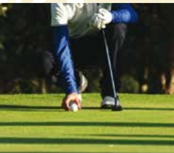
Experiência de Golf | dia 1