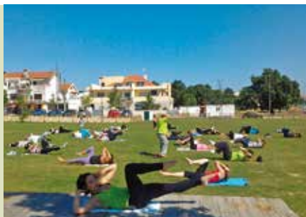
Treino Funcional | dia 30