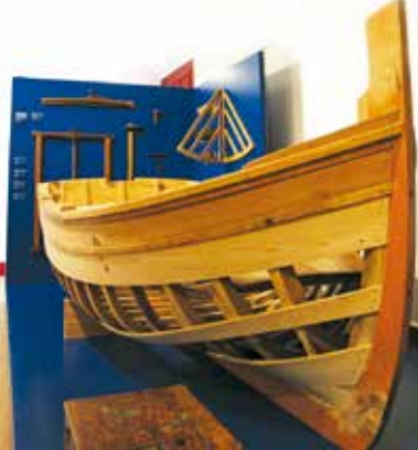
Museu Marítimo de Sesimbra | terça a domingo