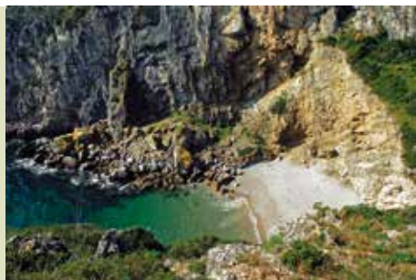
Zona Envolvente da Praia da Baleeira | dia 24