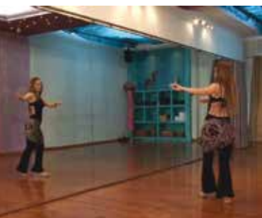
Danças Orientais | sextas