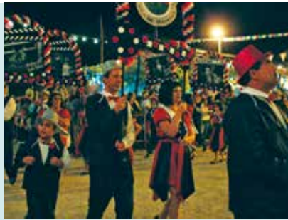
Marchas Populares na Quinta do Conde | dias 16 e 22