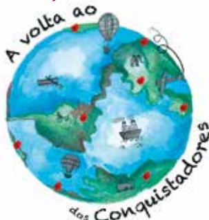
A Volta ao Mundo dos Conquistadores | dia 23