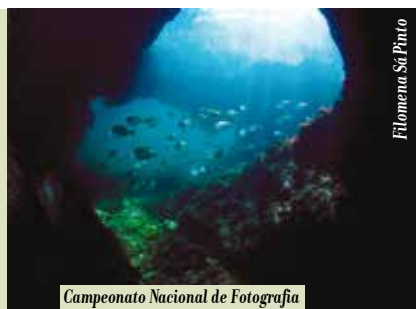
Filomena Sá Pinto