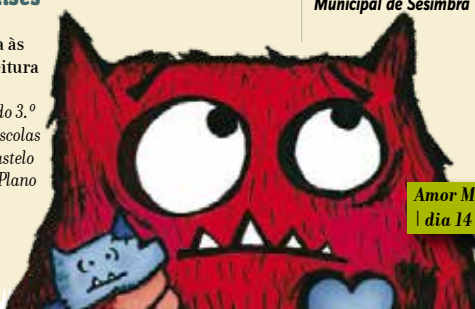
Amor Monstro | dia 14

Sala do Conto, Biblioteca Municipal de Sesimbra