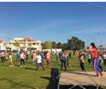
Zumba / Nirvana Fitness | dia 23