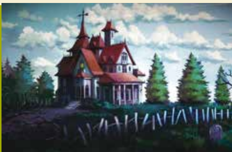
O Mistério no Sótão | dia 2