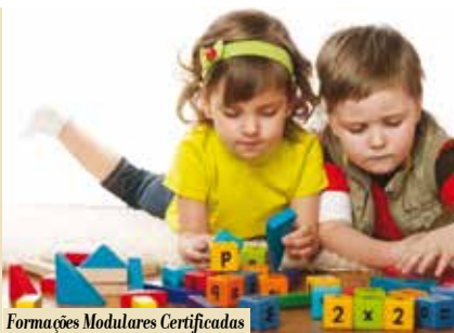
Formações Modulares Certificadas - Desenvolvimento da Criança | inscrições...

dia 30 | sáb | das 10 às 18.30h WORKSHOP