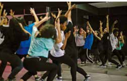
Da Scum | dia 9