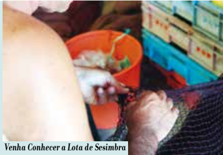
Venha Conhecer a Lota de Sesimbra com a Portúgalska | terças e quintas