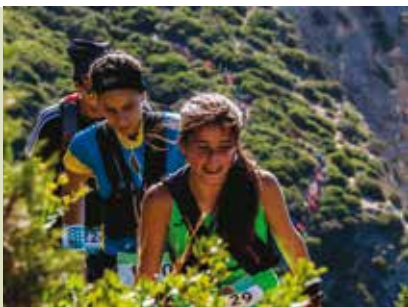
Ultra de Sesimbra | dia 3