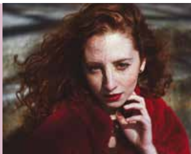
Tiny Soul Concert | dia 3