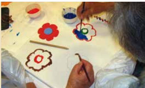
Histórias e Memórias | dia 14