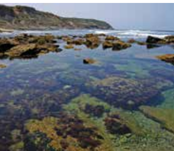
Da Azoia às Piscinas Naturais | dia 3