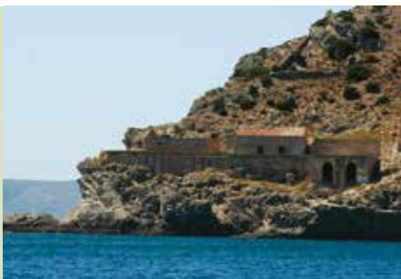
Descida ao Calhau da Cova | dia 17