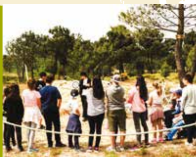
Ecoférias de Verão | de 25 a 28