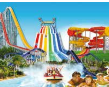
Bora Lá... Ao Aquashow | dia 18