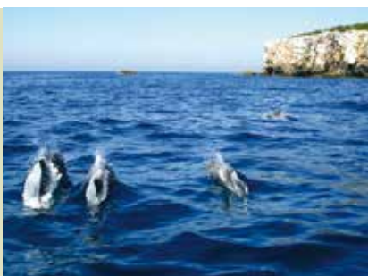
A Descoberta de Golfinhos | dia 21