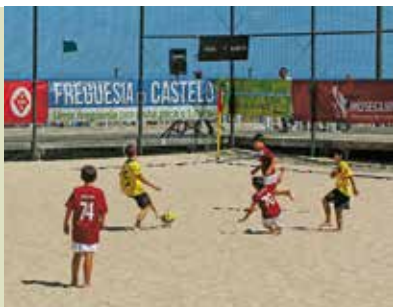
Sesimbra Summer Cup | de 27 JUN a 1 JUL