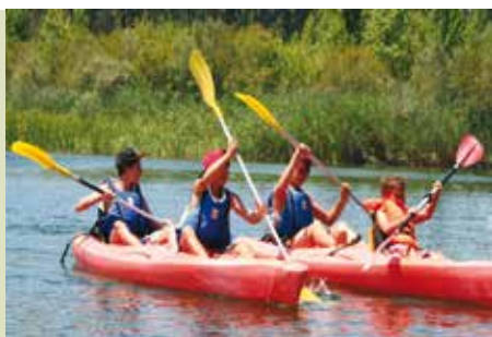
Canoagem e Arborismo | domingos