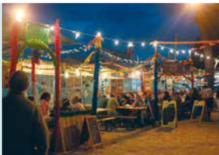
Festival do Caracol | 28 JUN a 1 JUL