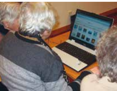
Informática Sénior | inscrições...