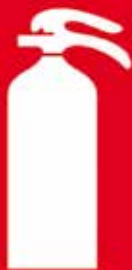
Combate a Incêndios | dia 8