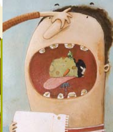
A Fuga da Ervilha | sextas