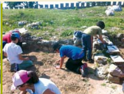
Escavação Arqueológica | a decorrer