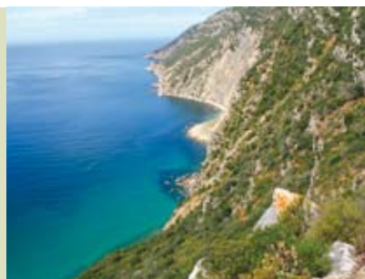
Terras e Serra do Risco | dia 8