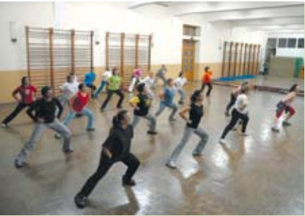
Gente Ativa | segundas e quartas