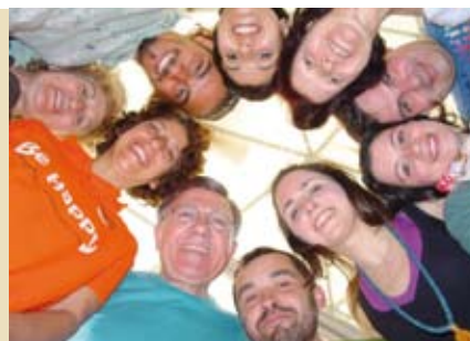
Líder de Yoga do Riso | dias 7 e 8