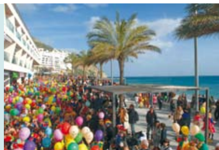
Cortejo de Fantasias de Palhaço | dia 16