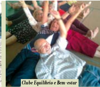
Clube Equilíbrio e Bem-estar | segunda a quarta