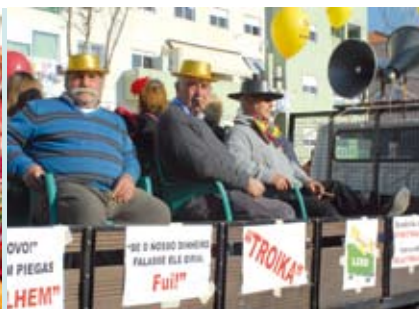
Desfile Trapalhão | dia 14