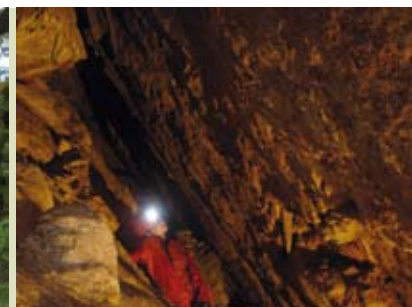
Lapa da Furada | dia 22