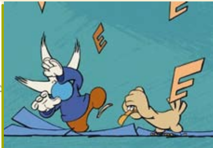
Ginjas e as Vogais | dia 22