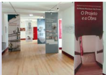
As Nossas Memórias Têm Futuro