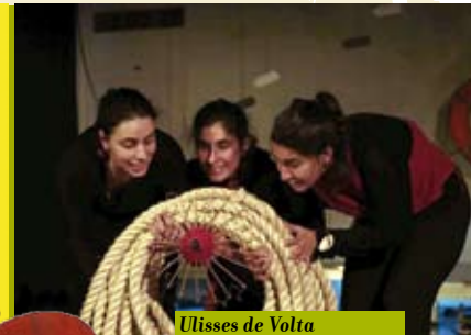
Ulisses de Volta à Casa da Partida | dia 27