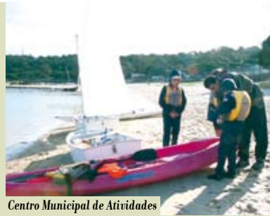
Centro Municipal de Atividades Náuticas | sábados