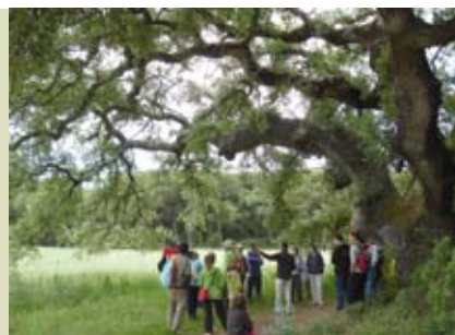
Fojo e a História do Risco | dia 14