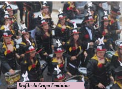
Desfile do Grupo Feminino de Afro-axé Tripa Mijona | dia 14