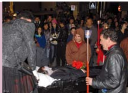
Enterro do Bacalhau | dia 18