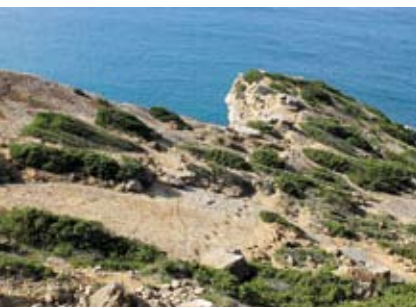
Da Moagem de Sampaio às Pegadas | dia 1