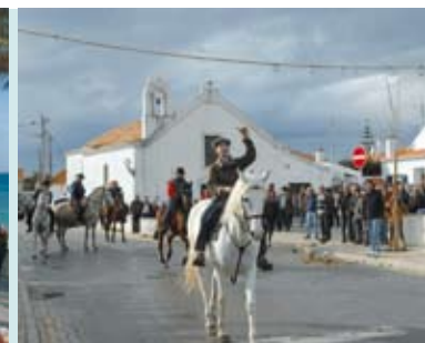
Cavalhadas | dia 17