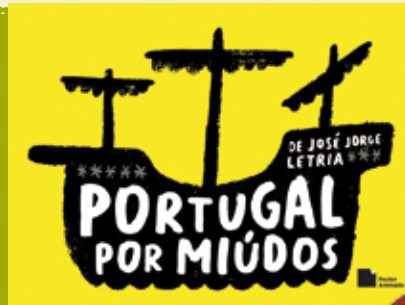
Portugal Por Miúdos | dia 4