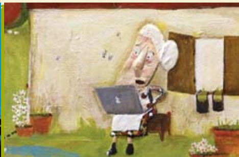
Maruxa | quintas