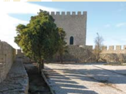
Histórias de Outros Tempos | a decorrer