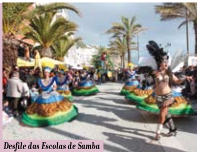
Desfile das Escolas de Samba e Grupos de Axé | dias 15 e 17