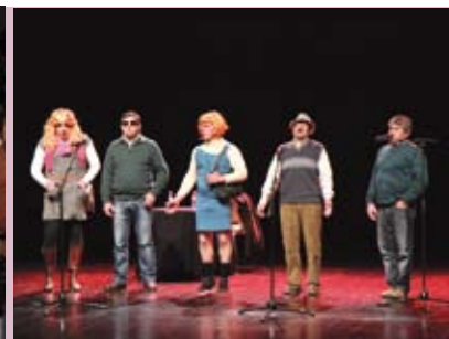
Cegadas de Sesimbra | dia 21