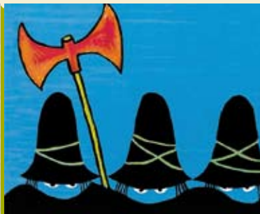
Os Três Bandidos | dia 26