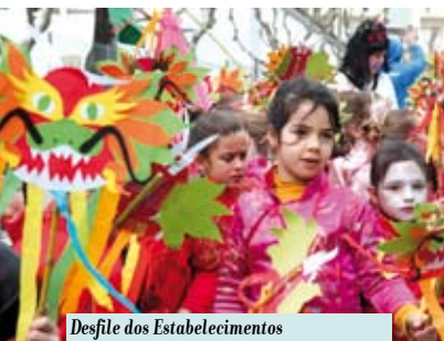
Desfile dos Estabelecimentos de Educação e Ensino do Concelho | dia 13