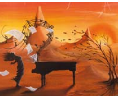
Melodias Climáticas | de 10 a 28