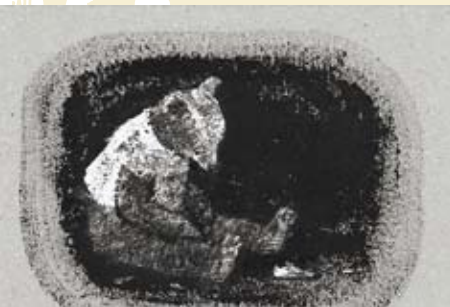
O Urso e o Gato Selvagem | dia 5