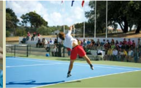
Brinca Tênis | sábados