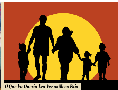
O Que Eu Queria Era Ver os Meus Pais Juntos: As Crianças e o Divórcio | dia 7

de 6 a 22 EXPOSIÇÃO Bastidores do Samba • de segunda a sexta, das 15 às 17.30, sábados, domingos e feriados, das 15 às 18h Sala Multiusos, Fortaleza de Santiago