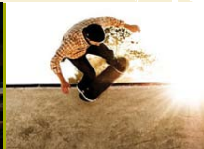
Lords Of The Boards - Skate Edition I | dia 22