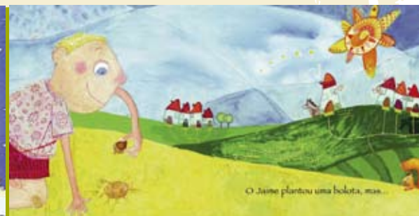
Jaime e as Bolotas | dia 26