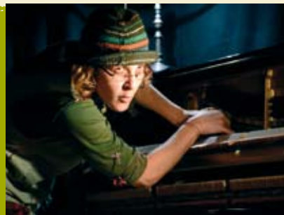
Tictactendo | dia 29