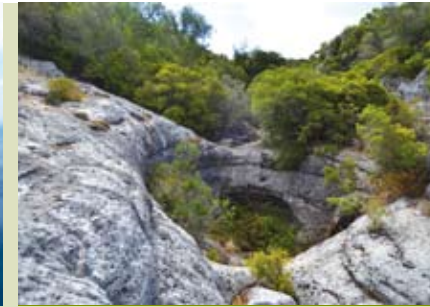
Ribeiro das Marmitas | dia 22