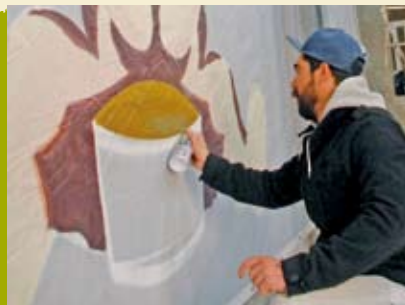
Street Art Society | dia 26