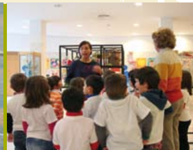
Biblioteca Municipal | quartas