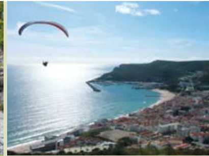
Outdoor Experience | dia 24