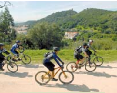
Pelos Terras de Calhariz | dia 7