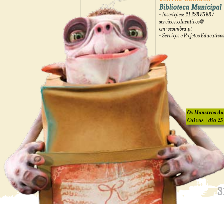
Os Monstros das Caixas | dia 25

• Inscrições: 21 228 85 88 / servicos.educativos@cm-sesimbra.pt • Serviços e Projetos Educativos