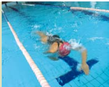
Piscina de Sesimbra