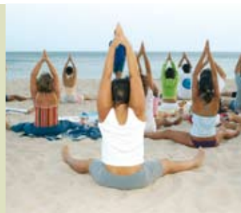
Yoga na Praia | segundas e quartas