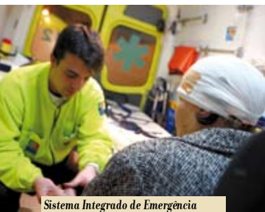
Sistema Integrado de Emergência Médica e Suporte Básico de Vida | dia 1