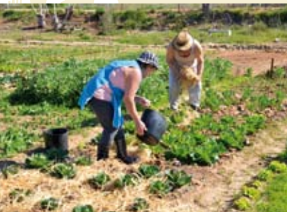
Farmville | dia 23