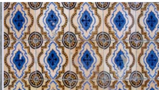
Azulejos de Fachada em Sesimbra | de 17 a 28