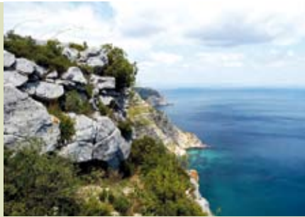
Terras e Serra do Risco | dia 8