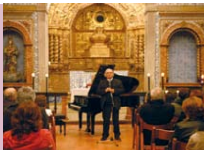
Conferência Concerto | dia 28