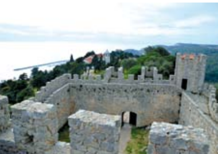
Do Castelo ao Santuário do Cabo Espichel | dia 28