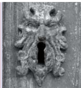
Detalhes | de 3 a 14