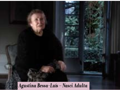
Agustina Bessa-Luís - Nasci Adulta Morrerei Criança | dia 6