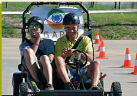
Alkotart | dia 20