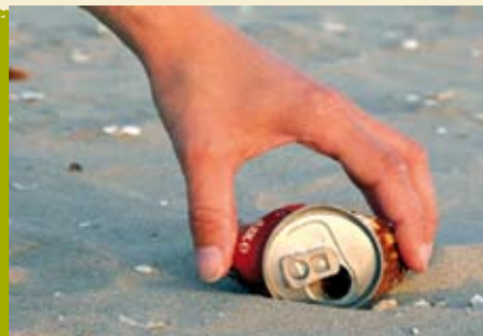
Do It For Free | dia 30