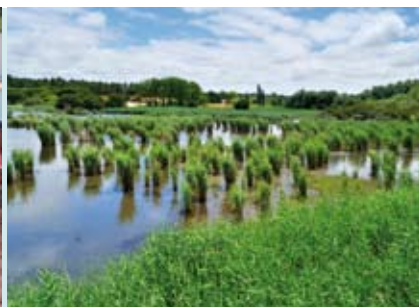
Lagoa Pequena | quartas, sextas e sábados