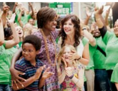
Nunca Desistas | dia 21