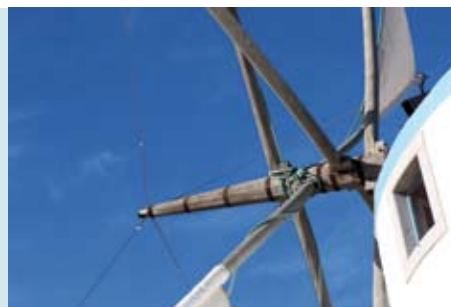
Moinho do Outeiro | sábados