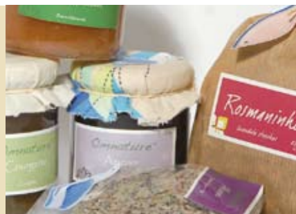
Prova de Chás e Compotas | dia 21