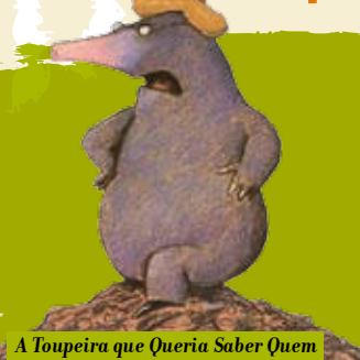
A Toupeira que Queria Saber Quem lhe Fizera Aquilo na Cabeça | dia 5