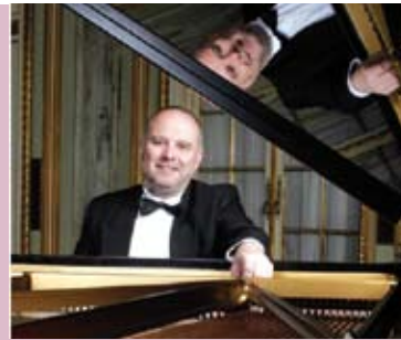
Música Religiosa do Século XIX | dia 15