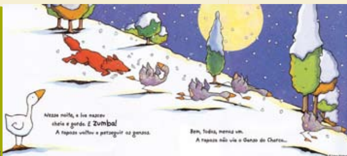
O Ganso do Charco | dia 14