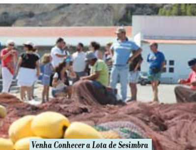
Venha Conhecer a Lota de Sesimbra | terças e quintas