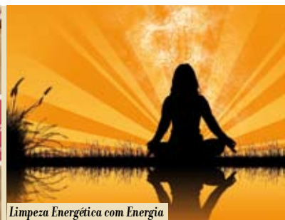
Limpeza Energética com Energia Reiki e Meditação | dia 27

dia 1 | dom | 10.30h AÇÃO DE SENSIBILIZAÇÃO Sistema Integrado de Emergência Médica e Suporte Básico de Vida com a colaboração do Instituto Nacional de Emergência Médica • Inscrições e informações: 21 228 05 21 / protecao.civil@cm-sesimbra.pt Auditório Conde de Ferreira, Sesimbra