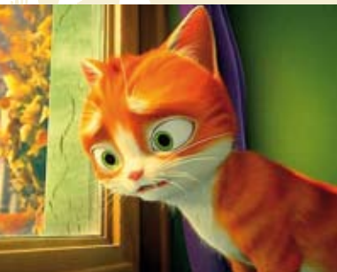
A Casa da Magia | dia 1