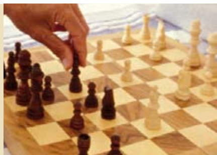
Tarde de Jogos | dia 13