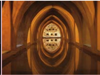
Al-Mu'tamid, Poeta Rei do Al-Andalus | dia 13