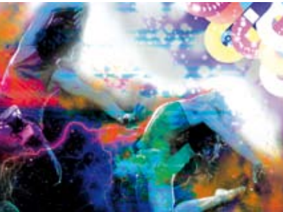
Flashmob | dia 2