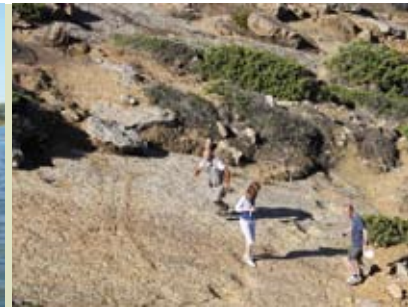
Rota das Pegadas | dia 18