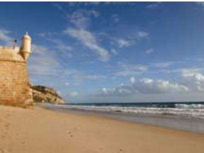
Sesimbra dos Sete Caminhos | dia 25