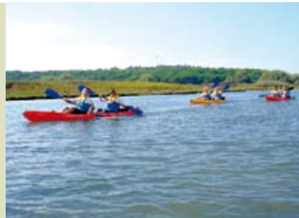
Lagoa de Albufeira | dia 18