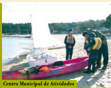
Centro Municipal de Atividades Náuticas | sábados