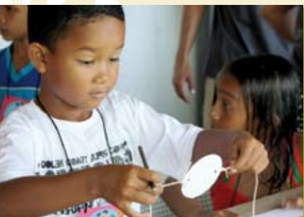
Que Feitico é Este? | dia 11