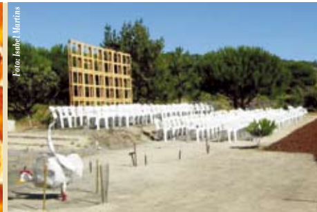
Mistérios das Aguncheiras | sábados