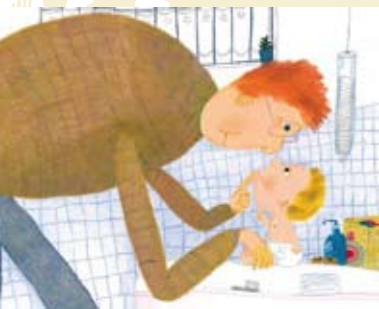
Boa Viagem, Bebê! | dia 17