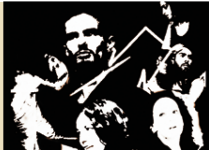
Técnicas Teatrais | dia 22