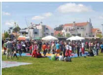
Animação Popular | dia 25