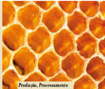
Produção, Processamento e Comercialização de Ceras