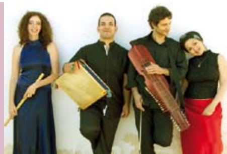
Ensemble Med | dia 18