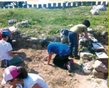
Escavação Arqueológica | a decorrer