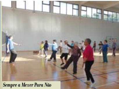
Sempre a Mexer Para Não Envelhecer | segunda a sexta