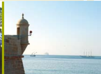
A Fortaleza e o Mar | a decorrer