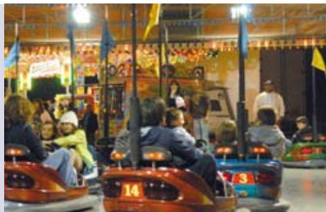
Feira da Festa das Chagas | 24 ABR a 5 MAI