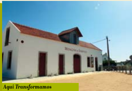
Aqui Transformamos o Trigo em Farinha | a decorrer