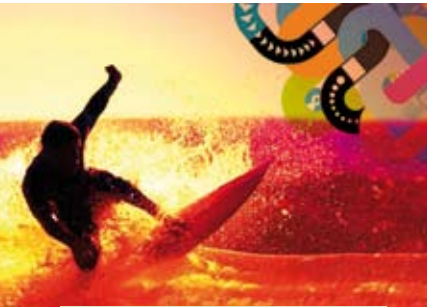
Lords of the Boards - Sea Edition I | dias 3 e 4