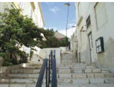
Ruas com História | dia 18