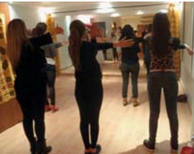
Dança Burlesca | dia 18