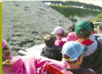
Dinossáurios em Sesimbra | a decorrer