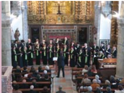
Concerto de Páscoa do Grupo Coral de Sesimbra | dia 4