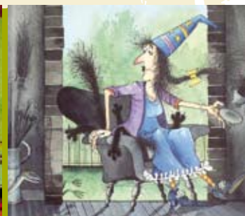
A Bruxa Mimi | dia 30