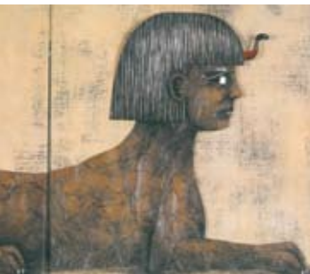
Os Animais Fantásticos | até dia 24