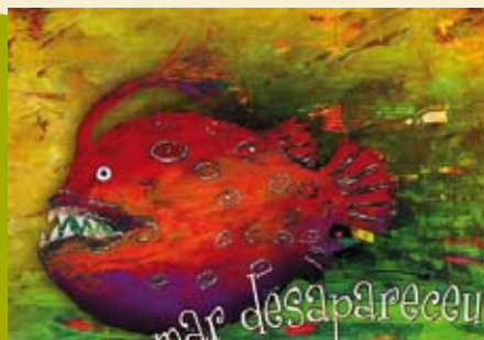
O Dia Em Que o Mar Desapareceu | dia 22