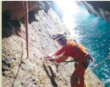
Garganta do Cabo | dias 3 e 4