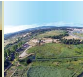
Parque da Ribeira - Quinta do Conde