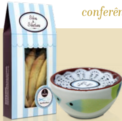
Prova de Biscoitos e Compotas | dia 2