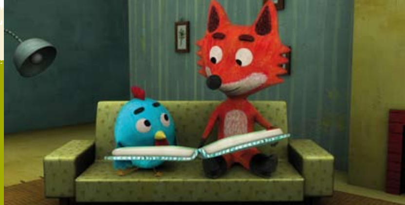
Foxy & Meg Visitam o Museu | dia 19