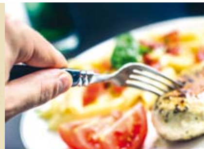
Segurança Alimentar | dia 16