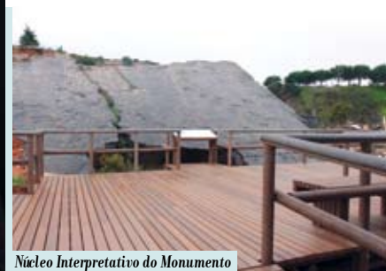
Núcleo Interpretativo do Monumento Natural da Pedreira do Avelino

dia 18 | sáb | 16h LANÇAMENTO DE SITE DA TOPONIMIA Ruas com História Casa do Governador, Fortaleza de Santiago