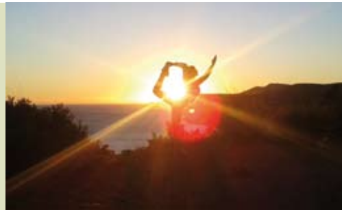
Yoga Samskha | segundas