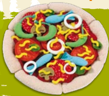
Pizza em Plasticina | dia 15