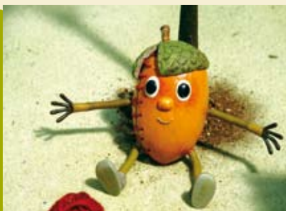
Foxy & Meg Visitam o Museu | dia 17