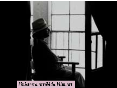
Finisterra Arrábida Film Art & Tourism Festival | de 6 a 10