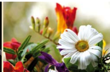
Um Dia Com Flores | dia 21