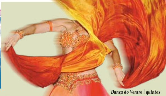
Dança do Ventre | quintas