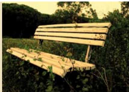
Mistérios das Aguncheiras | sábados