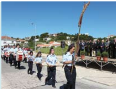
Dia Municipal do Bombeiro | dia 10