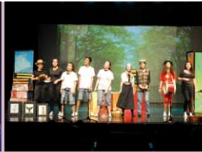
Mostra de Teatro Escolar | de 29 a 31