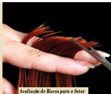
Avaliação de Riscos para o Setor dos Cabeleiros | dia 19