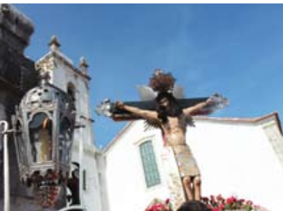
Festa em Honra do Senhor Jesus das Chagas | dia 4