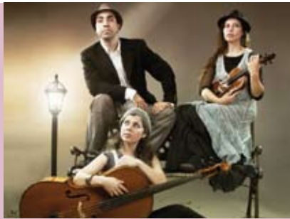
Caixa de Pandora | dia 9