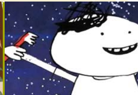
O Menino Que Detestava Escovas de Dentes | dia 28