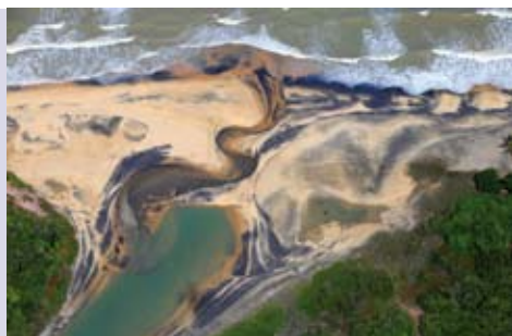
Um Novo Olhar Sobre a Terra Mãe do Brasil | de 6 a 10