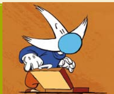
Ginjas e o Telefone | dia 17