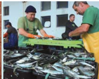
Dia do Pescador | dia 31