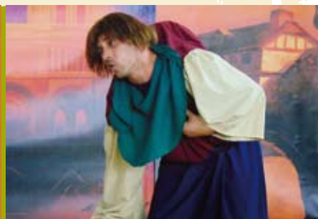
O Corcunda de Notre Dame | dia 30