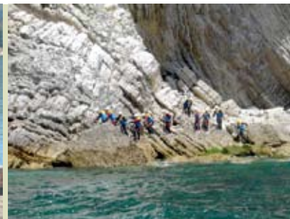
Boca de Tamboril | dia 10

de 25 a 27 | seg a qua | das 14.30 às 17.30h