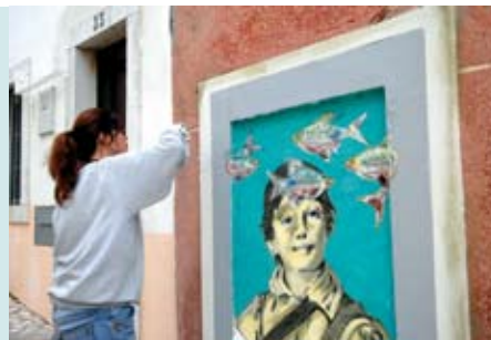
Sesimbra é Peixe e Arte na Rua | dia 30