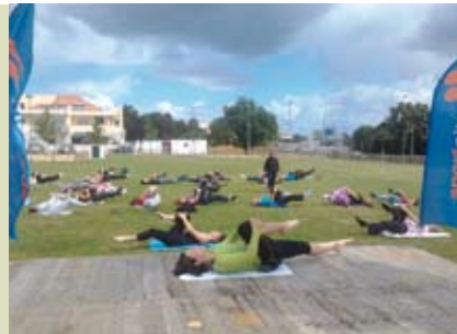
Body Balance | dia 23