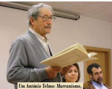
Um António Telmo: Marranismo, Kabbalah e Maçonaria | dia 30