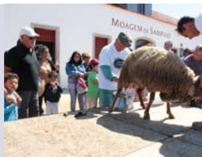
A Quinta na Moagem | dia 17