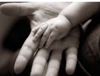
Consciência e Presença na Parentalidade | dia 2