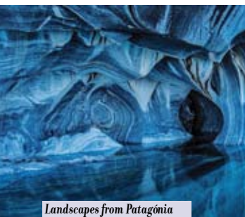
Landscapes from Patagônia (Chile) – O Começo | até dia 16