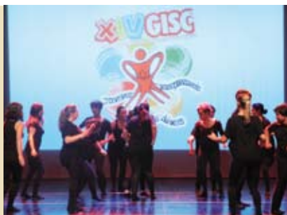
XV Congresso GISG | dia 15