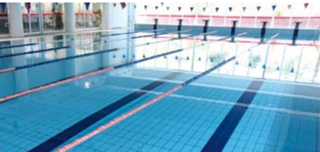
Piscina de Sesimbra | inscrições