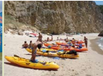
Sesimbra Selvagem | dia 24