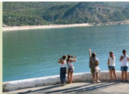
Rota da Arrábida | dia 9