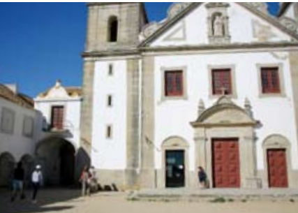
Do Cabo Espichel à Lagoa | dia 16