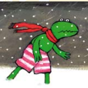
O Sapo no Inverno | dia 7