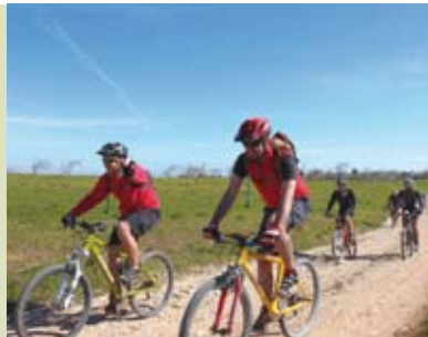
A Conquista de Sesimbra | dia 23