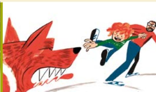
O Pai Mais Horrível do mundo | dia 21