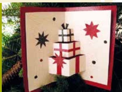
Cartões Natalícios | dia 18