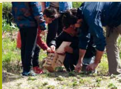
Horticultura de Palmo Meio | dias 5 e 12