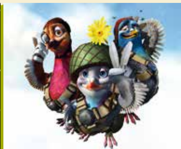
Os Bravos do Pombal | dia 27