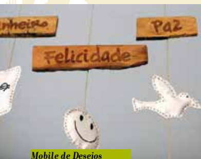
Mobile de Desejos para o Ano Novo | dia 28