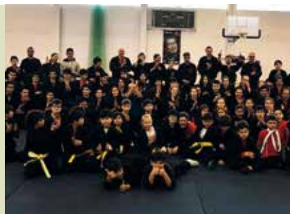
Bujinkan Ninjutsu | a decorrer