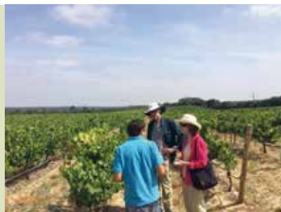
Experiências Personalizadas | a decorrer