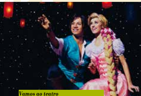
Vamos ao teatro com a Junta de Freguesia | dia 20