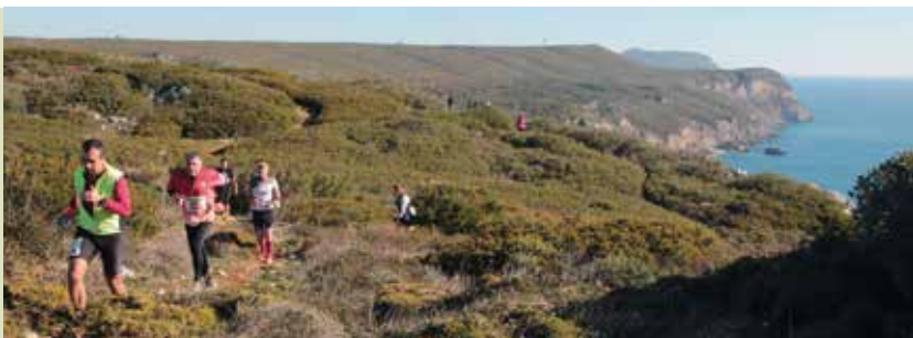
6.º Trail do Cabo Espichel | dia 16