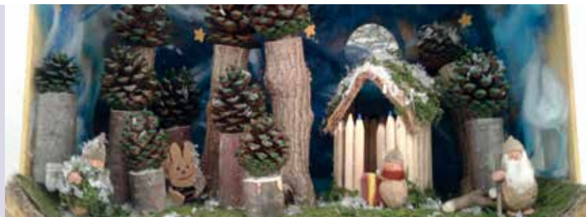
Presépios de Natal | a partir de dia 11