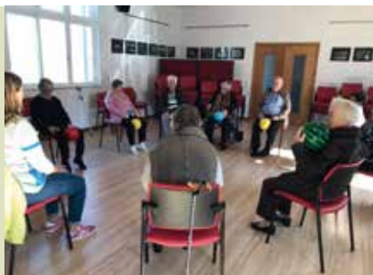
Corpo em Movimento Sénior | a decorrer