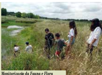
Monitorização da Fauna e Flora e Limpeza da Ribeira de Coína | dia 15