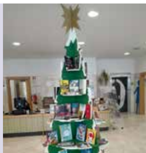
Livros de Natal | a partir de dia 11