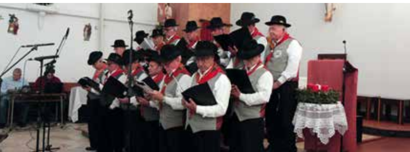
Concerto de Natal | dia 16