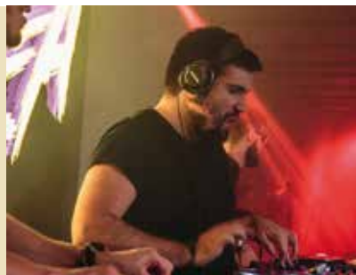
3.º Fórum Local de Juventude | dia 7