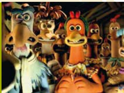
A Fuga das Galinhas | dia 5