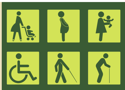
Encontro Reflexão - Sesimbra.INLUI | dia 7