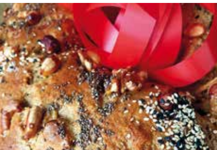
Natal Saudável | dias 8 e 15