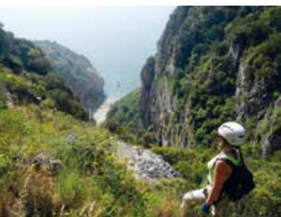
Circuito das Lapas | dia 15