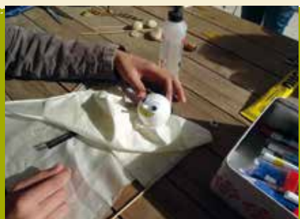
Férias com Arte | de 17 a 19