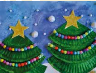
Árvores de Natal com Cartão | dia 4