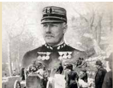
O Príncipe Piloto | dia 15