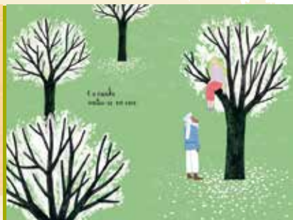
A Rainha do Norte | a decorrer