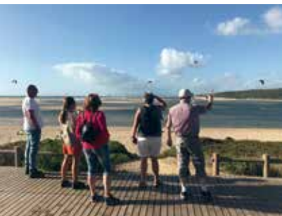
Rota do Cabo Espichel à Lagoa | dias 2, 9, 16 e 30