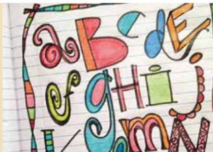
Escrita Criativa | dia 15