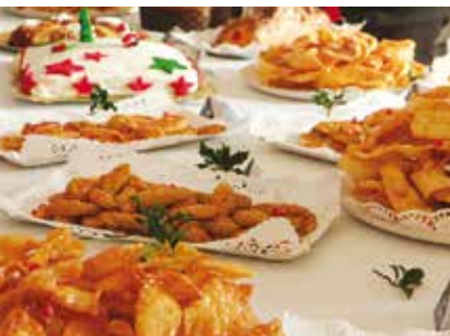
Um Doce Natal | dias 8 e 9