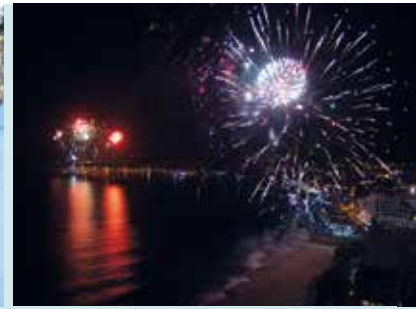
Fogo-de-artifício | dia 31