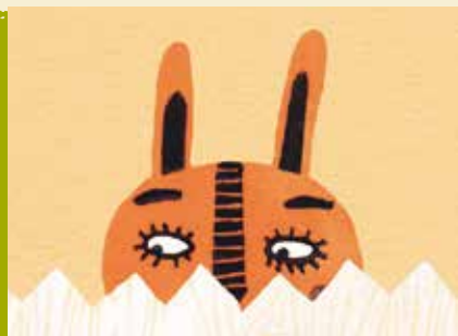
A Horta do Simão | a decorrer