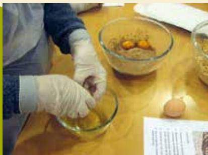
Oficina do Chocolate | dia 15