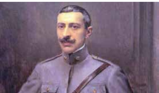
Sidónio Pais: Um Assassinato Anunciado | de 4 a 28