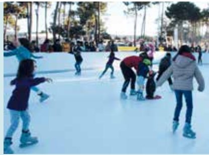
Pista Branca | 28 DEZ a 6 JAN