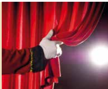
Teatro | dia 15

dias 7, 14 e 21 | sex | das 21 às 23.30h