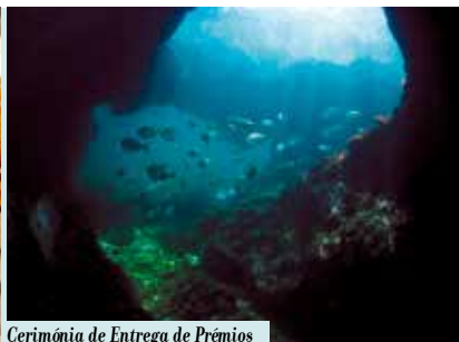
Cerimónia de Entrega de Prémios de Fotografia Subaquática | dia 16