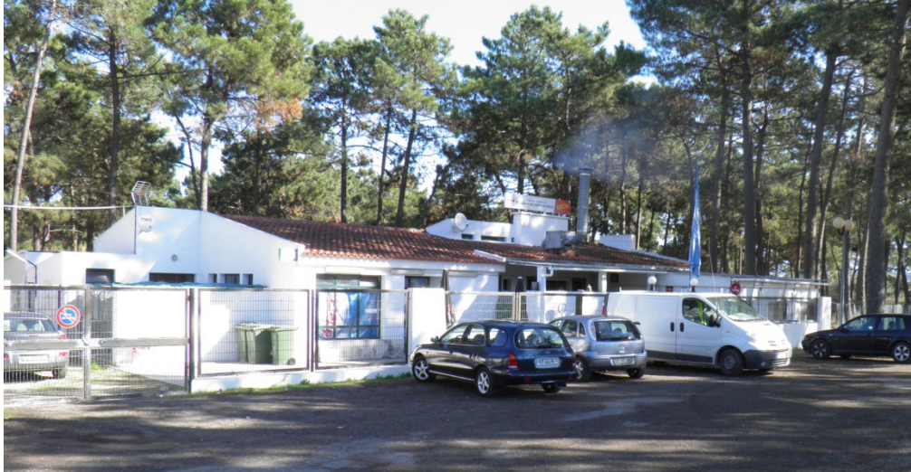
Foto. zona de entrada do Restaurante