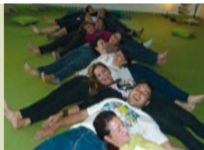
Aprender a Rir Sem Motivo | segundas