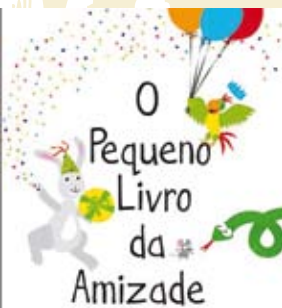
O Pequeno Livro da Amizade | dia 4