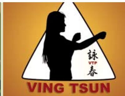
Ving Tsun | terças e quintas