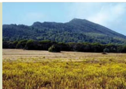
Arrábida Terra e Mar | dia 21