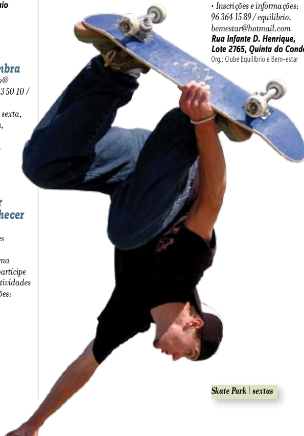
Skate Park | sextas

Espaço composto por diversas rampas para a prática do skate e BMX. Junto ao Parque da Vila, Quinta do Conde