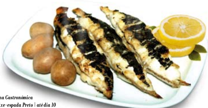
Semana Gastronómica do Peixe-espada Preto | até dia 10

Serviço de Audioguias Visita comentada à vila Disponível em português, espanhol, inglês e francês. • Preço: 3 € • Objetivo: orientar o visitante num trajeto pela vila de Sesimbra, que percorre locais emblemáticos do concelho Posto de Turismo, Fortaleza de Santiago