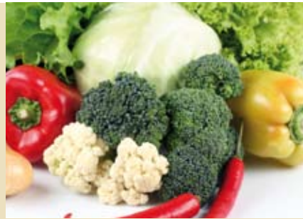
Modo de Produção Biológico | a partir de dia 12