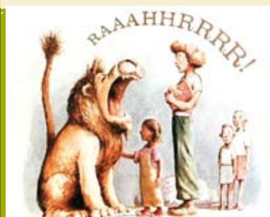
Um Leão na Biblioteca | dia 20