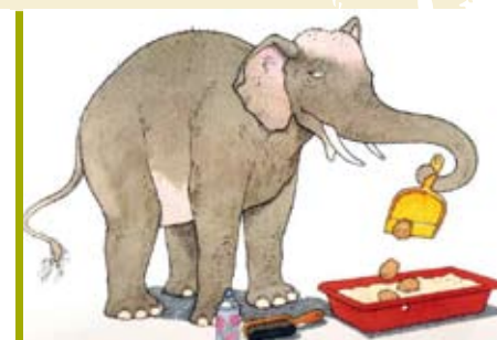
O Meu Gato é o Mais Tolo do Mundo | dia 25