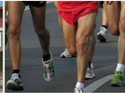
Cabo Espichel-Cotovia | dia 10