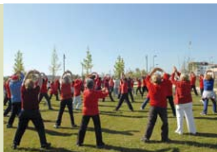
Sábados em Movimento | dia 20