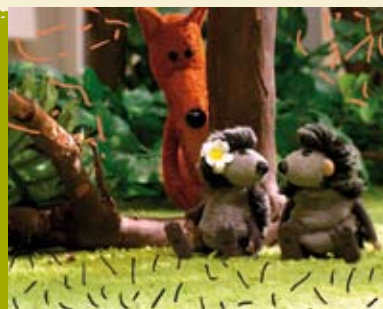
Os Porcos-espinhos e a Cidade | dia 21