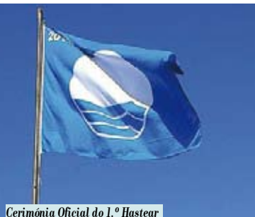
Cerimónia Oficial do 1.º Hastear da Bandeira Azul 2015 | dia 1