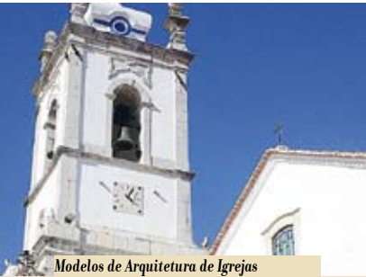
Modelos de Arquitetura de Igrejas e Organização do Espaço de Culto | dia 9