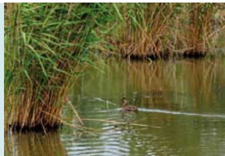
Lagoa Pequena | quartas, sextas e sábados