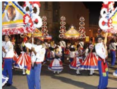
Marchas Populares em Sesimbra | dia 23