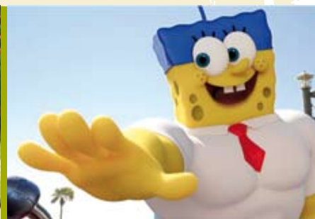
SpongeBob: Esponja Fora de Água | dia 17