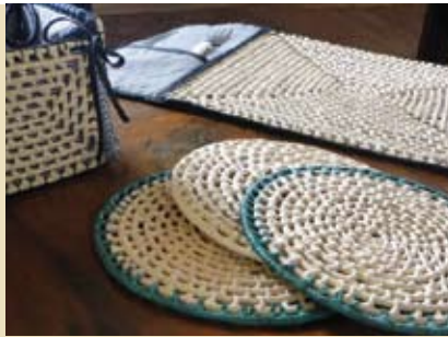
Qualificar os Artesãos | dia 6