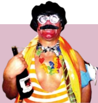
O Evaristo é Fische! | dias 12, 13, 26 e 27