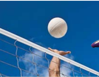
Jogos de Praia | dia 6