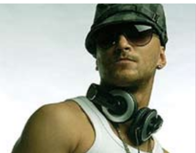
TT | dia 13