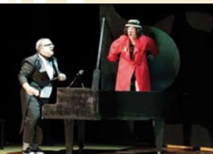
Pianíssimo Circo | dia 7