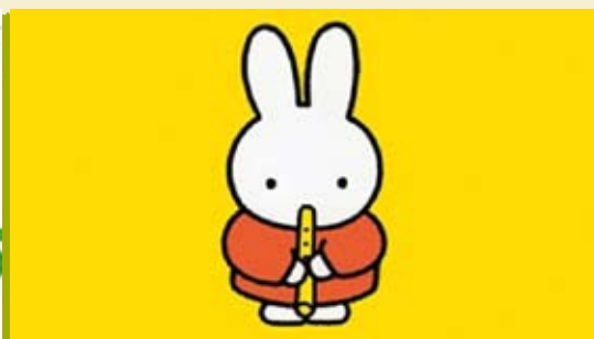
A Flauta da Miffy | dia 18