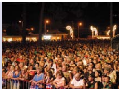
Feira Festa da Quinta do Conde | de 5 a 14