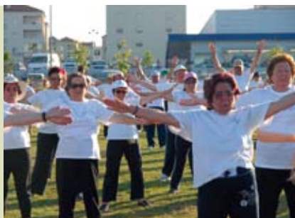
Sempre a Mexer para Não Envelhecer | segunda a sexta