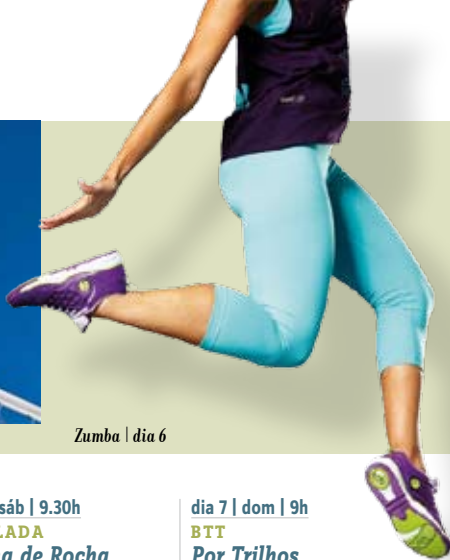
Zumba | dia 6