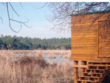
Da Lagoa da Estacada ao Pôr do Sol no Oceano | dia 14