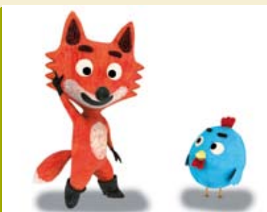
Foxy & Meg na Época Natalícia | dia 21