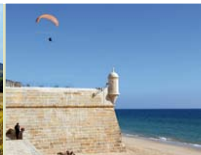
Passeio de Verão | dia 25