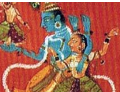
Yoga, Relaxamento e Bem-estar | de 26 a 28