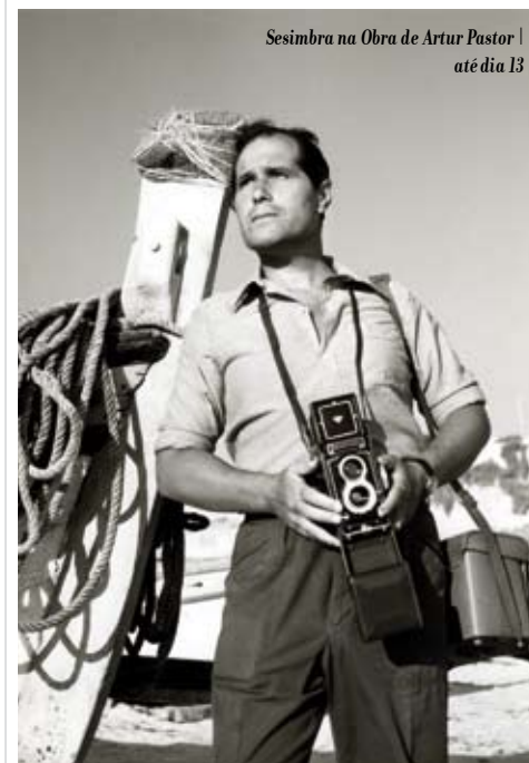
Sesimbra na Obra de Artur Pastor | até dia 13

Quartel dos Artilheiros, Fortaleza de Santiago