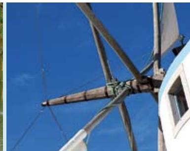
Moinho do Outeiro | sábados