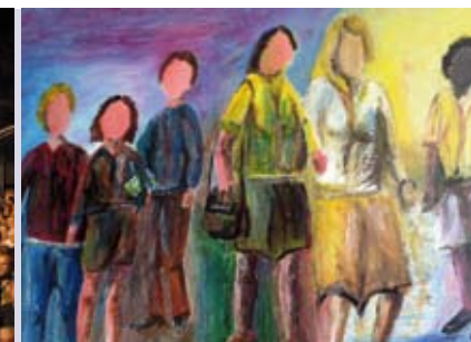
Trilhos e Caminhos | de 16 a 27