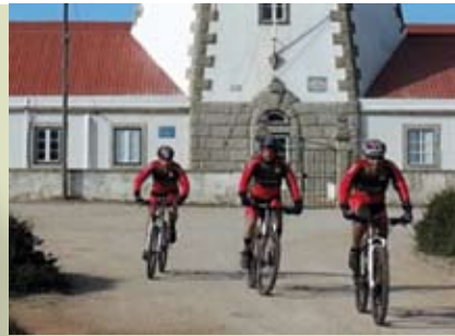
Por Trilhos do Espichel | dia 7