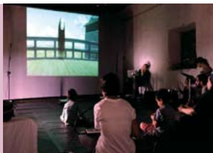
Do Filme à Música | dia 26