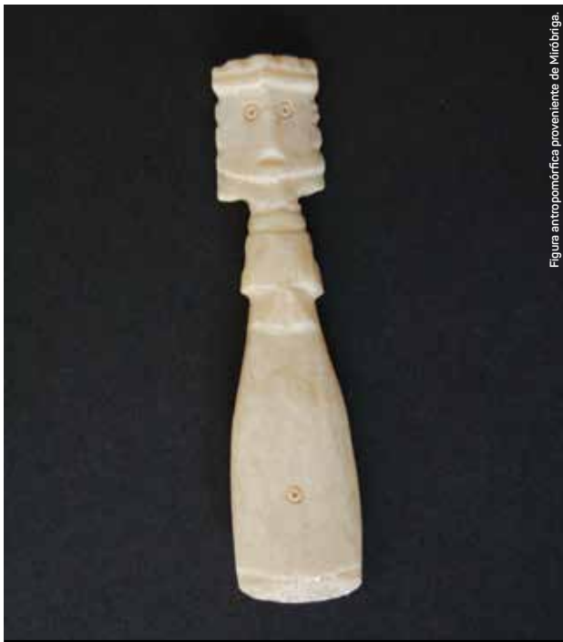
Figura antropomórfica proveniente de Miróbriga.