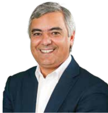
Francisco Jesus PRESIDENTE DA CÂMARA

A requalificação dos blocos de habitação social do Bairro da Almoinha, de espaços públicos nos bairros sociais do Zambujal e da Almoinha, a manutenção do parque habitacional propriedade do município, o reforço da iluminação pública, os processos de construção e requalificação de habitações nas três freguesias destacam-se entre as ações na área da habitação e urbanização. A construção do novo Tribunal e Posto Territorial na GNR da Quinta do Conde continuará também a merecer atenção por parte da autarquia.