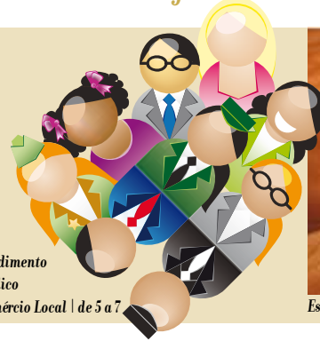
O Atendimento ao Público no Comércio Local | de 5 a 7