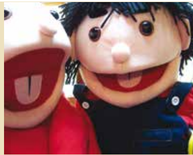
Marionetas | dias 30 e 31 OUT e 1 NOV