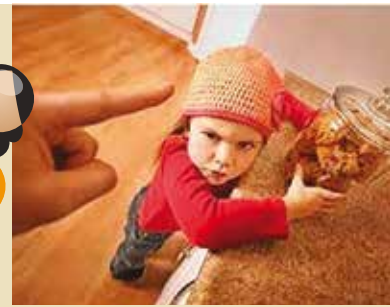
Esticar a Corda | dia 17