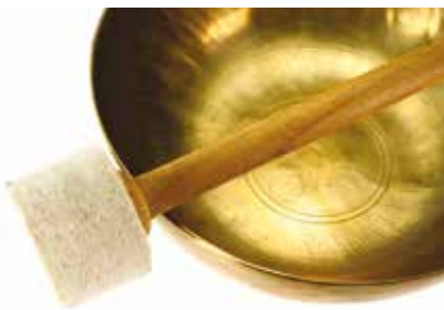
Meditação com Taças Tibetanas | dia 1