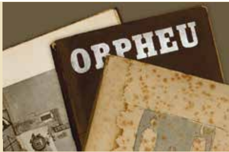
No Centenário do Orpheu | dia 24