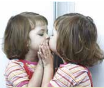
Autoestima das Crianças e... Educadores | dia 24