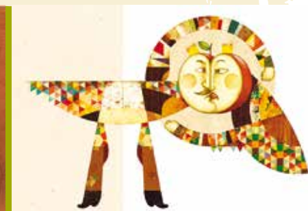
O Mais Esperto do Reino | a decorrer