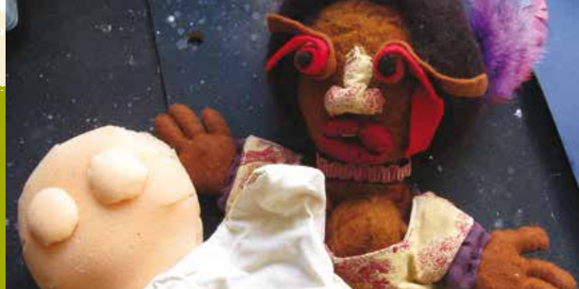
Teatro de Marionetas | dia 31

dia 16 | sex | 14.30h ARTISTAS DE PALMO E MEIO Dia da Alimentação • Limite: 15 crianças • Inscrições: 21 087 08 45 / 96 241 73 27 Espaço Zambujal Org.: JF Castelo