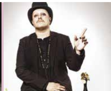
La Chanson Noire | dia 31