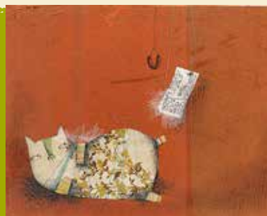
Rimar e Cantarolar | dia 15