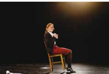
A Cadeira | dia 11