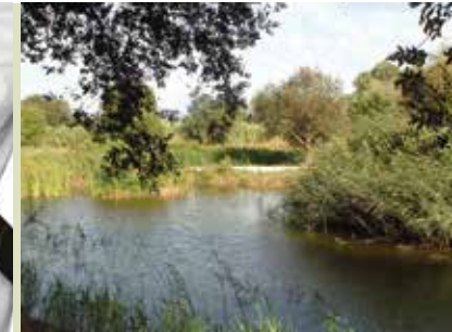
Parque da Ribeira