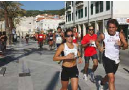
21.ª Corrida de Sesimbra | Inscrições