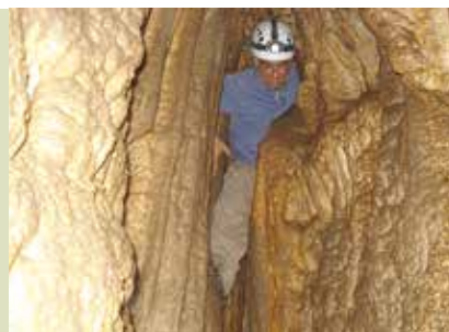
Lapa do Médico | dia 11