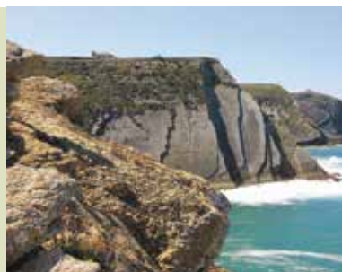
Rota do Cabo Espichel à Lagoa | dia 4