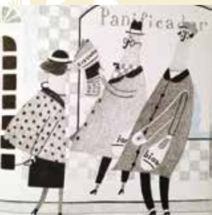
O Chapeleiro e o Vento | dia 8