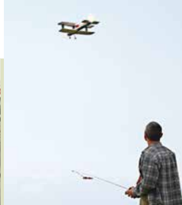
Escola de Aerodelismo | Inscrições