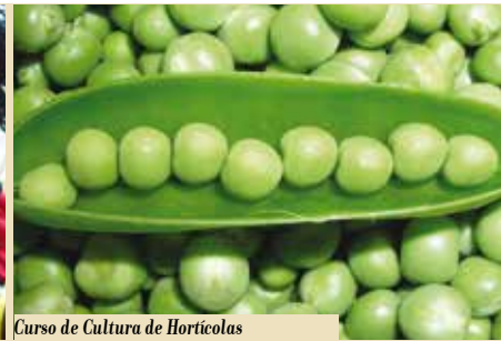
Curso de Cultura de Hortícolas em Modo de Produção Biológico | inscrições