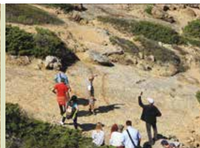
Rota da Moagem de Sampaio às Pegadas | dia 11