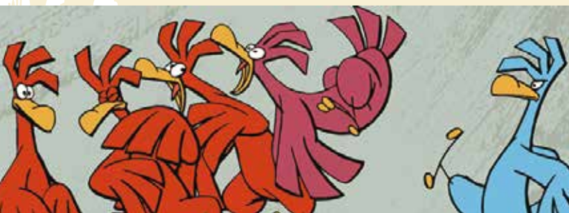
Ginjas e as Galinhas Coloridas | dia 11