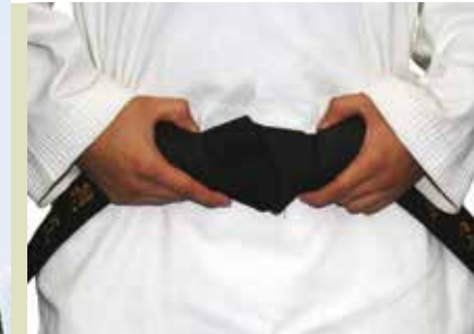
Taekwondo | segundas, quartas e sextas