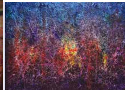
Relevos de Cor | a partir de dia 20