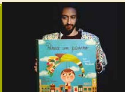
Parece Um Pássaro | dia 25