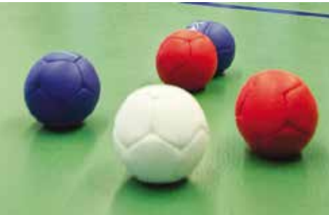
Boccia Sênior | dia 1