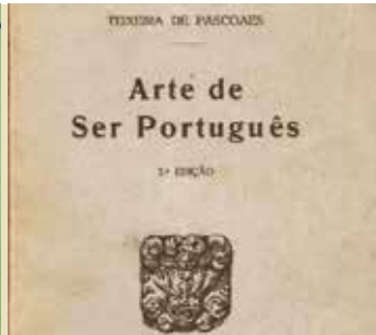
No Centenário da Arte de Ser Português | dia 3