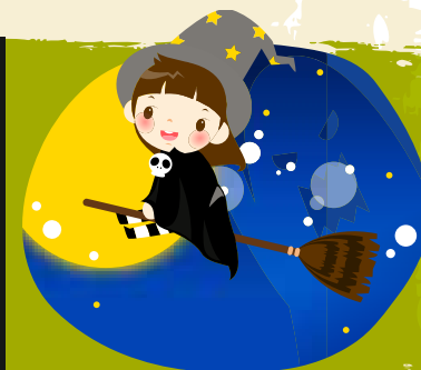
Noite das Bruxas | 31 OUT a 1 NOV