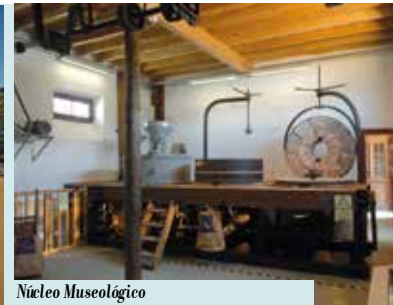
Núcleo Museológico da Moagem de Sampaio | quarta a domingo