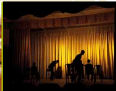
Férias com Arte no Natal | de 21 a 23