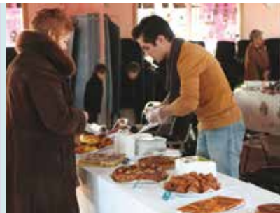
Mostra de Doces de Natal | dias 5 e 8