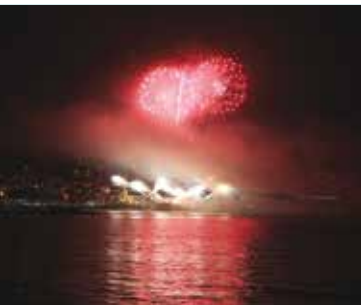
Fogo de Artificio | dia 31