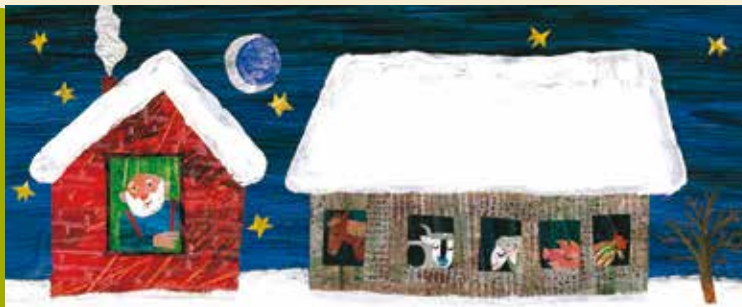
Sonho de Neve | dia 10