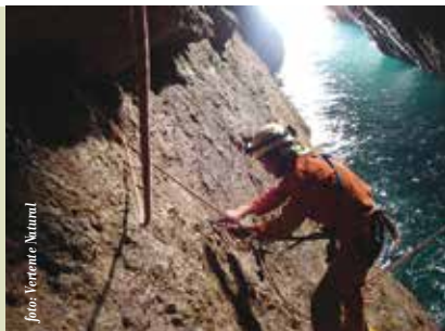
Garganta do Cabo | dias 5 e 6