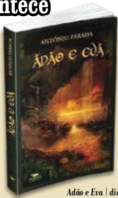
Adão e Eva | dia 5