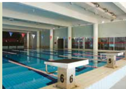
Piscina de Sesimbra | inscrições