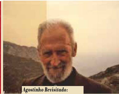
Agostinho Revisitado: Novas Aproximações | dia 19