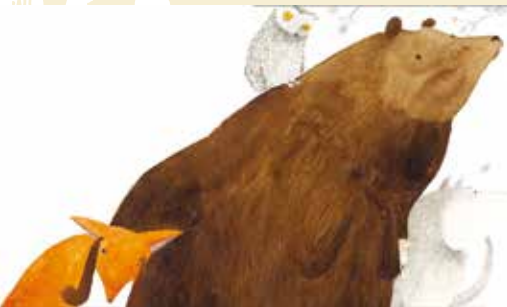
Um Segredo do Bosque | dia 3