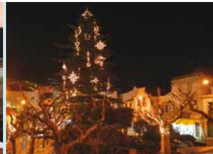
Iluminações de Natal | a partir de dia 8