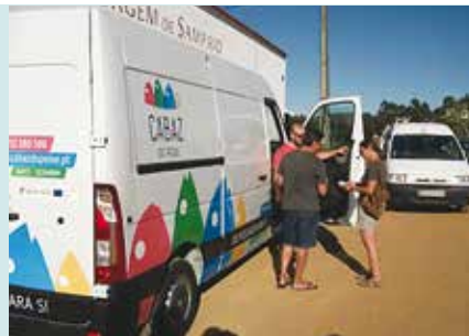
Cabaz do Peixe | a decorrer