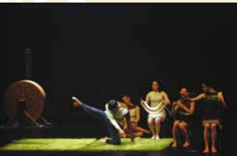
Re. ligações | dia 6