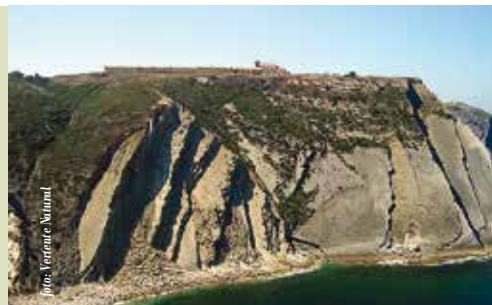
A Caminho dos Dinossauros | dia 8