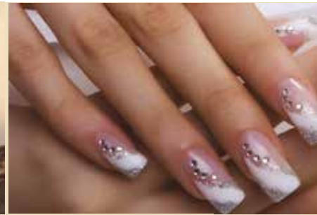
Unhas de Gel e Verniz de Gel | inscrições