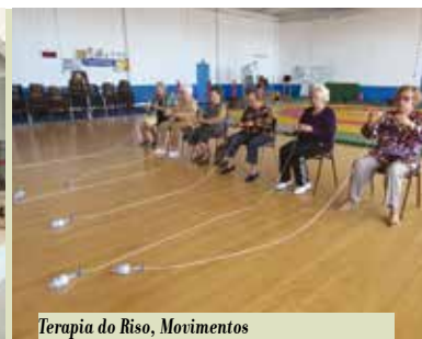
Terapia do Riso, Movimentos Preventivos e Animação Cognitiva | a decorrer