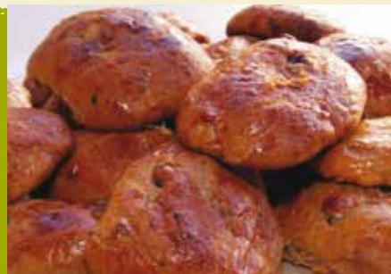
Confeção de Broas de Natal | dia 12