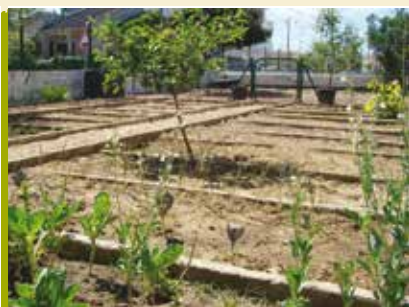
Manhãs na Horta | dias 11 e 18