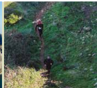
3.º Trail do Espichel/Sportlife | dia 20