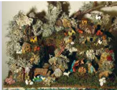
Os Nossos Presépios | a partir de dia 15