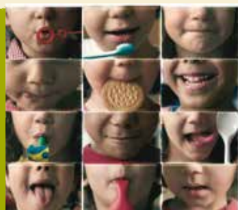
Poemas Para Bocas Pequenas | dia 2