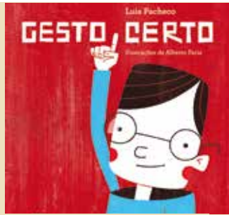
Gesto Certo | dia 12