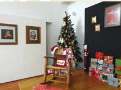
Natal | dia 10