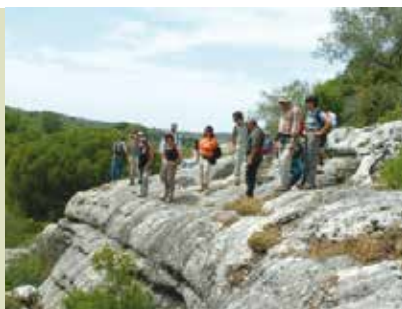
Marmitas de Gigante | dia 27