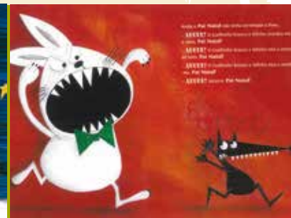
Feliz Natal Lobo Mau | dia 19