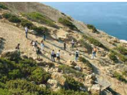
Na Pista dos Dinossáurios | dia 26