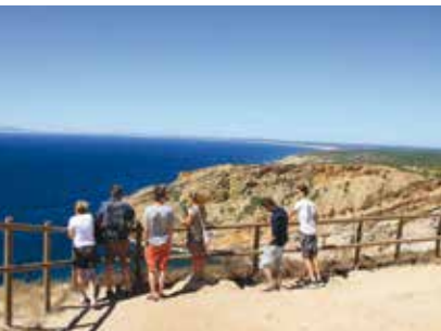
Rota da Arrábida | dia 5