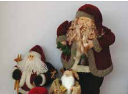
Pais Natal | de 1 a 30