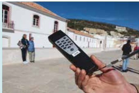
Serviço de Audioguias | a decorrer