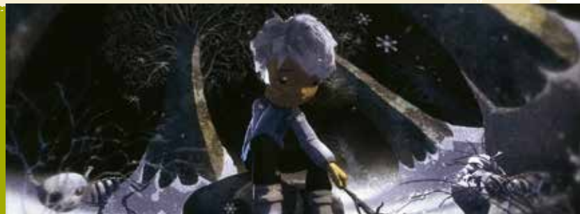
Filminhos Infantis | dia 15