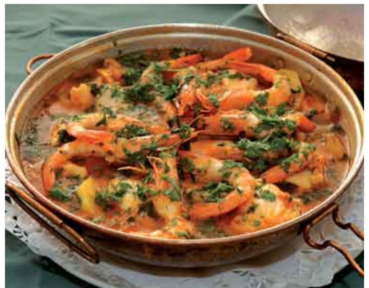
Os sabores de Sesimbra vão estar a concurso durante o mês de Maio

A S INSCRIÇÕES para o concurso gastronómico Sabores de Sesimbra 2007 podem ser feitas até 23 de Abril, em formulário próprio, distribuído no Posto de Turismo, na Associação de Comerciantes e Industriais do Concelho de Sesimbra e na Associação de Comércio e Serviços do Distrito de Setúbal. O concurso, que se realiza entre 1 e 25 de Maio, tem como objectivo principal preservar, valorizar, promover e divulgar a cozinha tradicional de Sesimbra, incentivando o aparecimento de novas especialidades gastronómicas confeccionadas com produtos tradicionais do nosso concelho