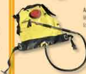
Alforge com capacidade para 18 litros, para intervenção rápida em locais de incêndio