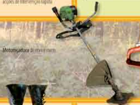
Motocoadora de linha e mancha