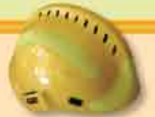
Capacete Anti-fogo para acções de intervenção rápida