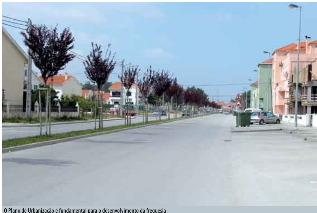
O Plano de Urbanização é fundamental para o desenvolvimento da freguesia