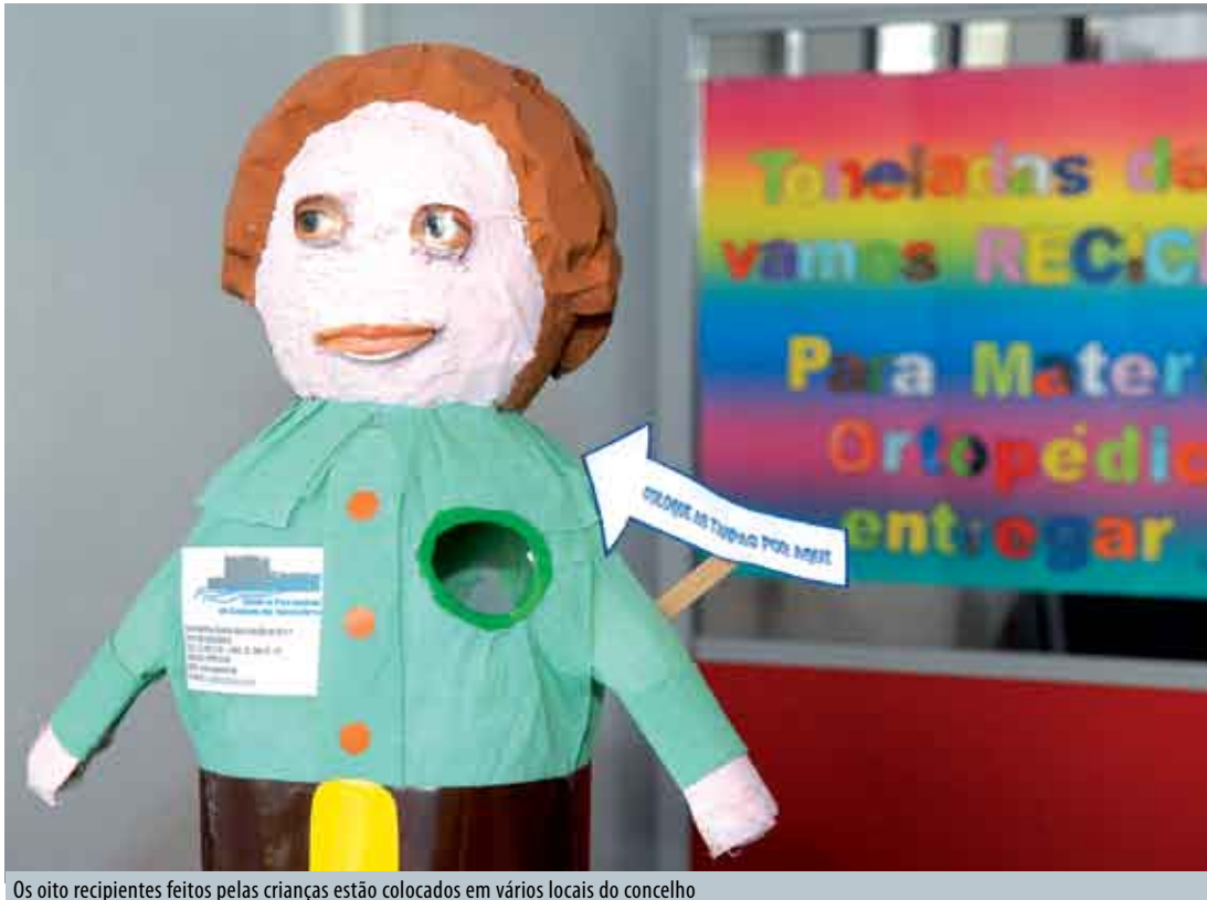
Os oito recipientes feitos pelas crianças estão colocados em vários locais do concelho