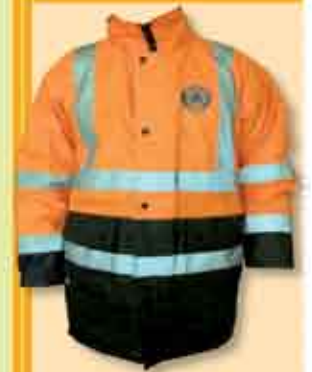
Casaco impermeável com bandas reflectoras