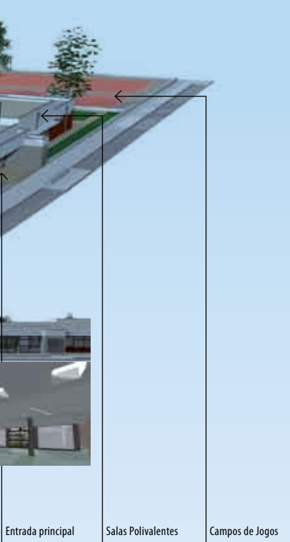
Entrada principal Salas Polivalentes Campos de Jogos