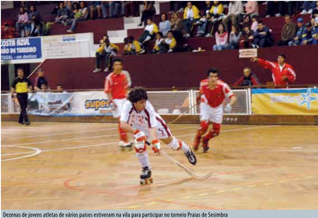
Dezenas de jovens atletas de vários países estiveram na vila para participar no torneio Praias de Sesimbra