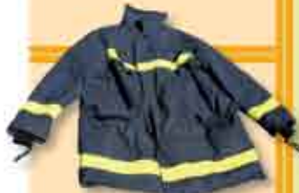
Casaco Nomex com proteções à prova de fogo utilizado para acções de intervenção rápida