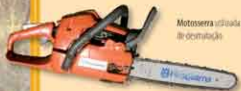
Motosserra utilizada para acções de desmatagem