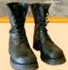
Botas para fogo sem biqueira de aço e com palmilha intermédia contra calor