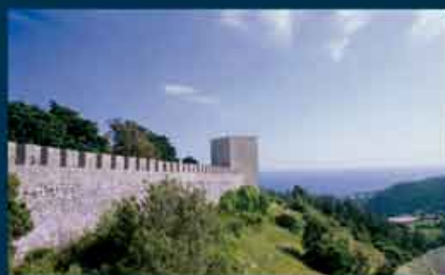
castelo de Sesimbra

NO DIA 21 de Abril, a Câmara Municipal lança o segundo volume da colecção Patrimónios , da autoria do fotógrafo José Arsénio, que desta vez retrata o Castelo de Sesimbra. A sessão de apresentação tem lugar às 16.30 horas no Castelo, com a actuação do Trio de Cordas Indigo.