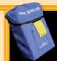
Firestelter alforge anti-fogo portátil