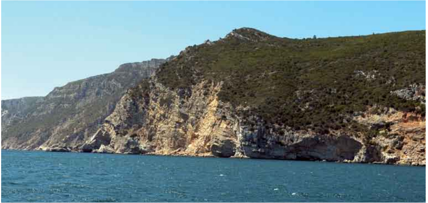
Caso avance a reforma do ICN, a Câmara Municipal pode ser afastada da gestão do Parque Natural da Arrábida