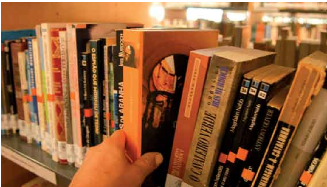
A escritora Alice Vieira vai estar na Biblioteca Municipal no dia 20, no âmbito das comemorações do Dia Mundial do Livro

O CANTOR Zé Carvalho e o pianista Emílio Robalo, músicos do Quinteto de Jazz de Lisboa, estiveram na Capela do Espírito Santo, em Sesimbra, para interpretar temas de José Afonso numa linguagem musical "jazzística". O espectáculo Lembrar Zeca Afonso é uma das iniciativas com que a autarquia assinala os 20 anos da morte do autor de Grândola Vila Morena .