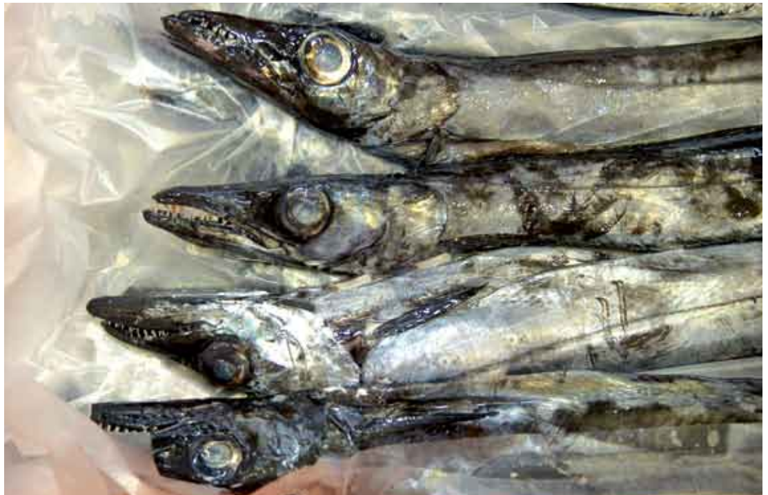
Depois do sucesso da primeira semana do Peixe-espada Preto, a organização decidiu organizar uma quinzena dedicada a este peixe

PELO SEGUNDO ano consecutivo a Câmara Municipal vai estar presente na Ovibeja, que decorre entre 28 de Abril e 6 de Maio, no Parque de Feiras e Exposições de Beja. Para esta feira, que vai na 24.ª edição, a autarquia vai utilizar o stand que esteve na Bolsa de Turismo de Lisboa, no qual estarão também representadas empresas parceiras na divulgação turística do município. A Ovibeja é um dos maiores acontecimentos culturais sociais e económicos do país e recebe anualmente cerca de 300 mil visitantes. Em 2006, reuniu mais de um milhar de expositores.