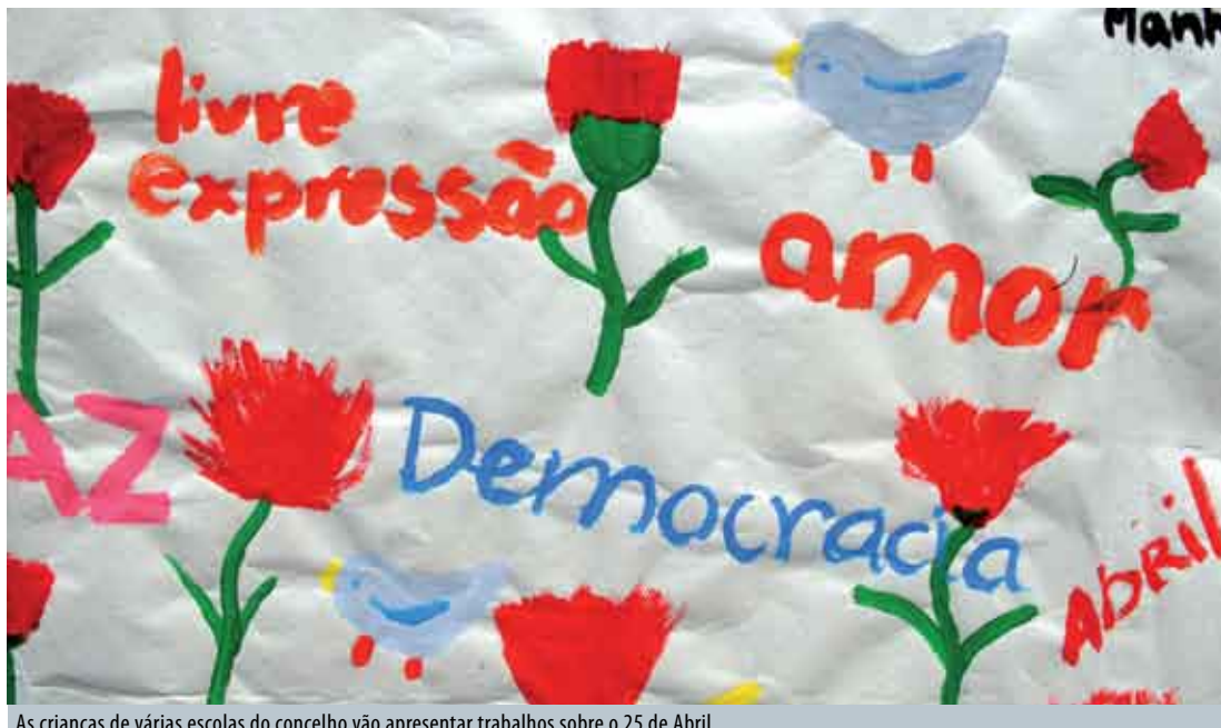
As crianças de várias escolas do concelho vão apresentar trabalhos sobre o 25 de Abril