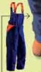
Calças de protecção contra cortes de motosserras e motocoadoras, utilizada nos trabalhos de limpeza de matas