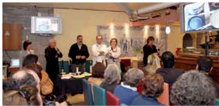
Durante o showcooking foram desvendados alguns dos truques dos grandes cozinheiros