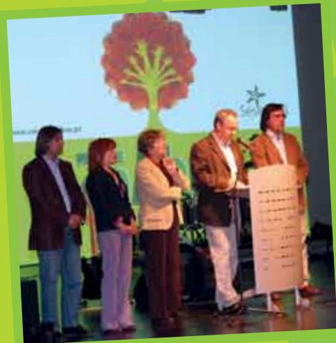
Cerimónia de abertura