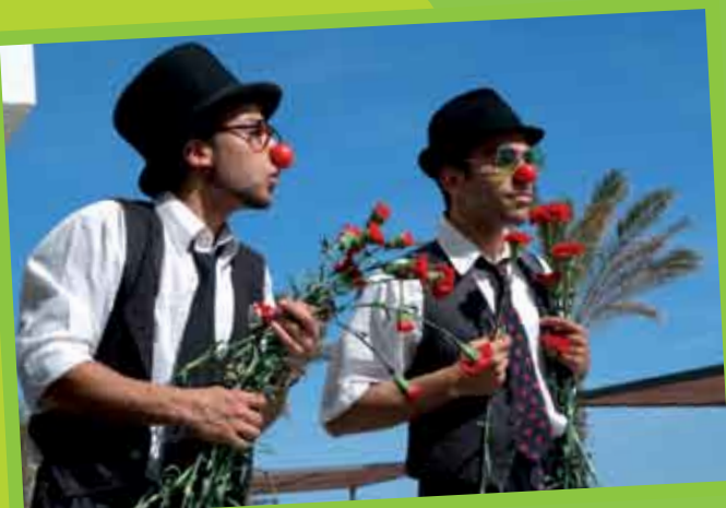
Atividade de Rua