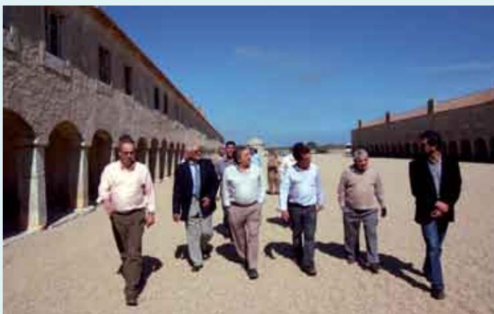
A requalificação do Cabo Espichel foi um dos temas da visita

O alargamento da rede do pré-escolar é uma das apostas da au-