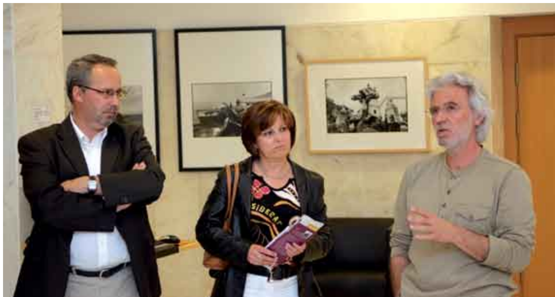
Para apresentar esta exposição o fotógrafo sesimbrense acompanhou a Festa desde os anos 80