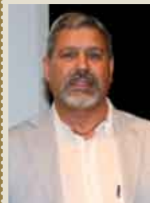
Surf Clube de Sesimbra

Medalha de Mérito Municipal Grau Prata (Os atletas estiveram ausentes por se encontrarem em competição)