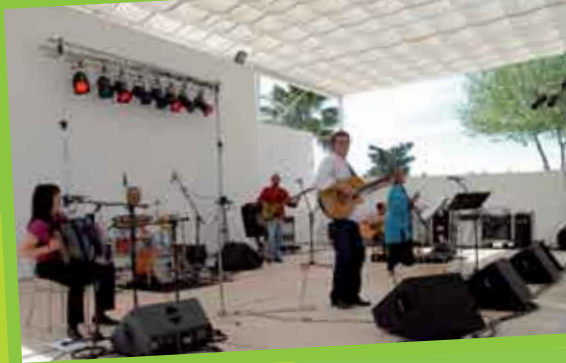
Banda do Andarilho