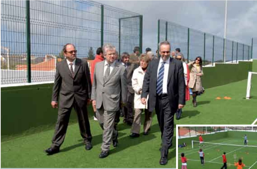
O complexo passa a contar com dois campos com piso sintético