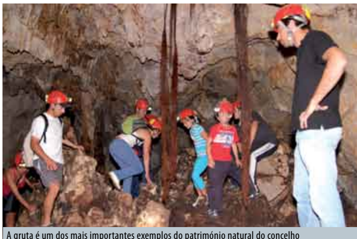
A gruta é um dos mais importantes exemplos do património natural do concelho

A Lapa do Fumo, gruta natural localizada na vertente Sudoeste da Arrábida, utilizada como necrópole desde o Neolítico, foi o destino dos 25 participantes num passeio pedestre, inserido nas actividades de educação ambiental desenvolvidas pela Câmara Municipal. A caminhada teve início na Azoia e durante o percurso até à Lapa do Fumo, os participantes puderam usufruir da beleza do local, e ouvir algumas explicações arqueológicas sobre os pontos de passagem ●