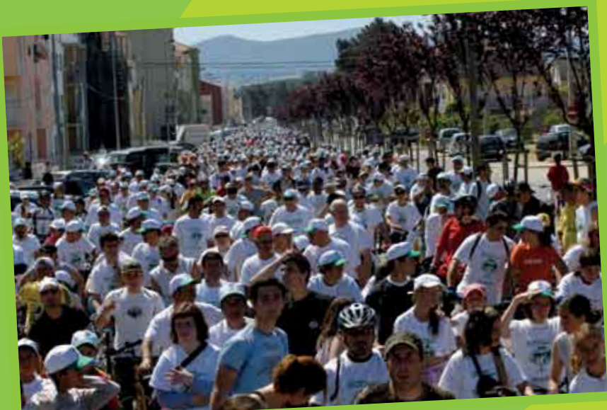
Cicloturismo na Quinta do Conde