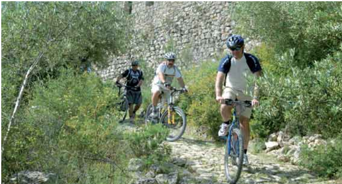
O Castelo de Sesimbra foi um dos locais visitados durante o circuito