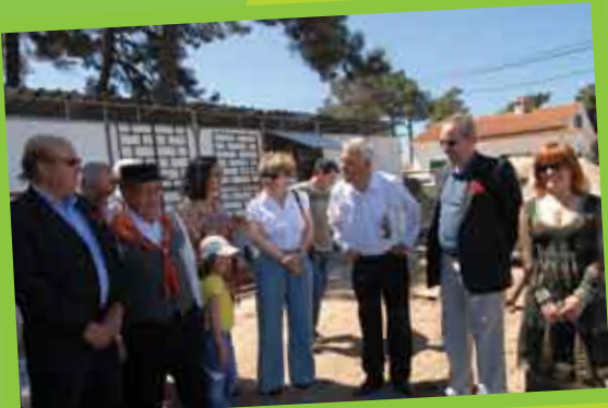
Primeira pedra da sede da Voz do Alentejo