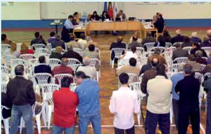
A reunião descentralizada em Alfarim reuniu perto de uma centena de municípios

tarquia, que já tem em marcha a extensão do jardim-de-infância de Alfarim. A estrutura pré-fabricada prevê a instalação de uma sala de actividades e do refeitório o que permitirá que o edifício principal abarque duas salas de aula. O equipamento ficará a funcionar em pleno a partir do próximo ano lectivo.