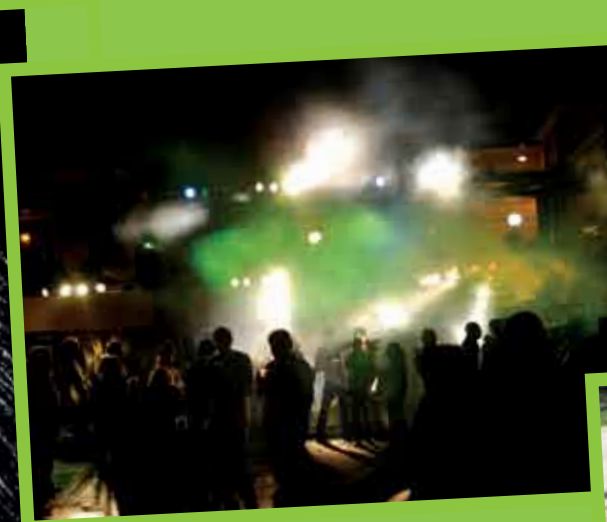
Freedom Sound Session