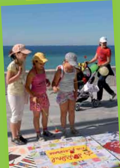
25 de Abril em Mosaicos