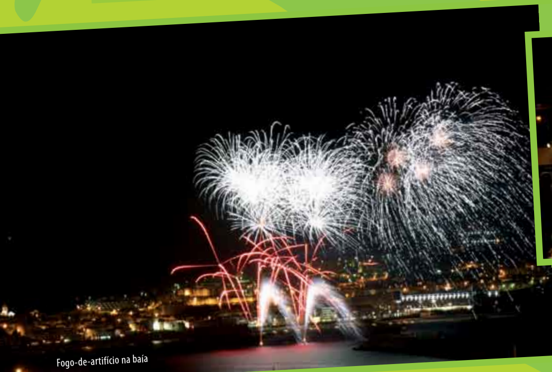
Fogo-de-artifício na baía

Durante as comemorações do 25 de Abril estiveram ainda patentes duas exposições, 25 de Abril em Cartaz , constituída por meia centena de cartazes pertencentes à colecção do Museu Nacional da Imprensa, e Um Olhar Sobre o 25 de Abril , composta por fotografias de Eduardo Gageiro. Esta foi uma data particularmente especial para o Grupo Coral Voz do Alentejo, que viu ser colocada simbolicamente a primeira pedra da sua futura sede, na Quinta do Conde. Esta cerimónia foi acompanhada de uma pequena actuação do grupo.