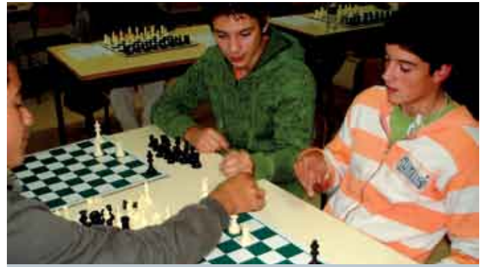
O projecto pioneiro pode alargar-se agora a outras escolas