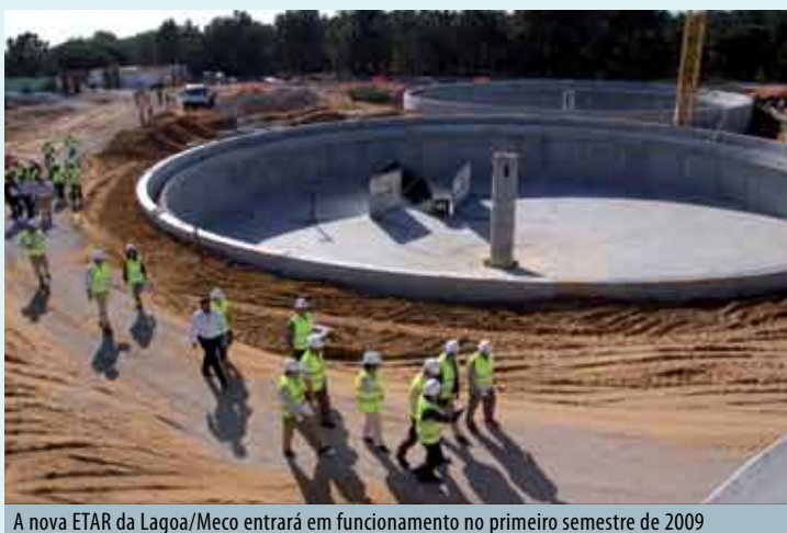
A nova ETAR da Lagoa/Meco entrará em funcionamento no primeiro semestre de 2009