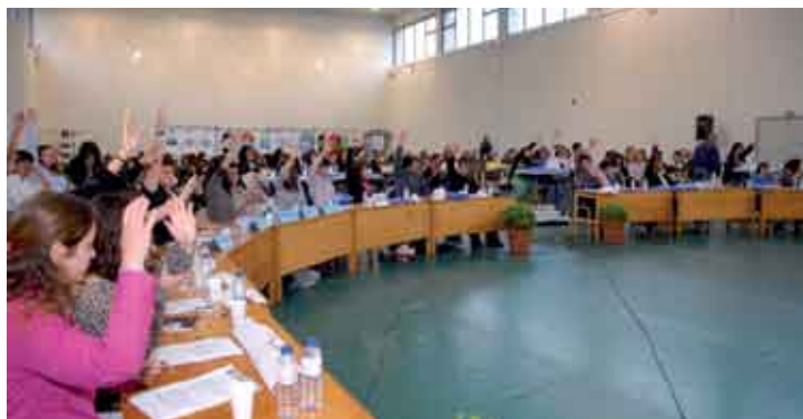
A iniciativa revelou-se uma experiência enriquecedora para os alunos

Para que os jovens percebessem tudo o que envolve uma candidatura deste género e e conhecessem os motivos que levaram à elaboração da candidatura da Arrábida foram organizadas ses-