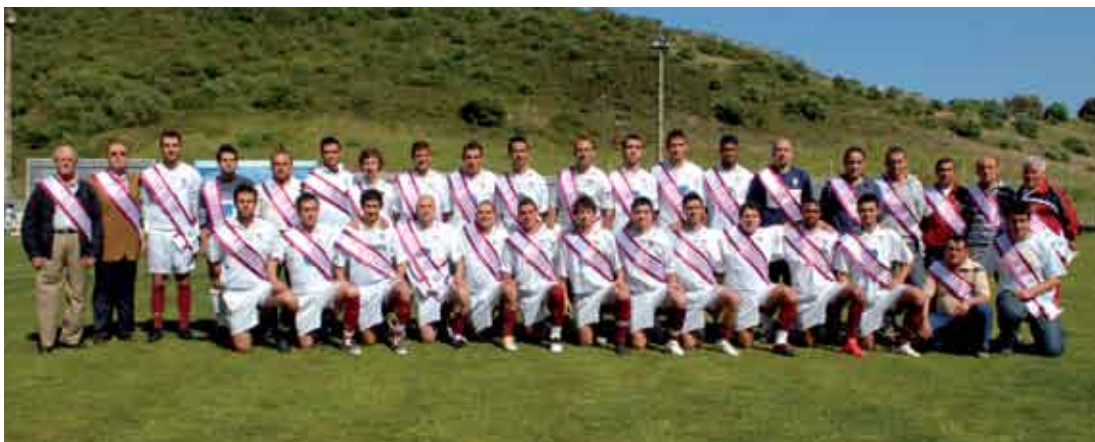
A equipa sénior de futebol do GD Sesimbra subiu à 3.ª Divisão Nacional

Depois de vários anos de negociações, a Câmara Municipal de Sesimbra, a empresa António Xavier de Lima e o Grupo Desportivo e Cultural do Conde 2 chegaram a um acordo que permitirá transferir um terreno no Conde 2, com perto de 5 mil metros quadrados, para esta associação. O terreno encontra-se definido como espaço para equipamentos por um estudo elaborado ao abrigo do Plano de Urbanização da Quinta do Conde, publicado em 1986. Na altura, a autarquia manifestou intenção de o ceder à associação, quando este estivesse na sua posse, mas até hoje tal não tinha sido possível devido a um processo que opunha a empresa e o clube, relacionado com a ocupação de dois lotes de terreno da empresa pelo polidesportivo do clube do Conde 2. Com base no presente compromisso, a empresa cede o terreno à autarquia, que o doa à associação. Por seu turno o Conde 2 compromete-se a devolver os lotes ocupados, pondo termo a um processo que se arrasta há vários anos.