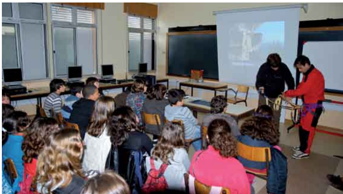
Espeleologia, geologia, ambiente, fauna e flora são alguns dos temas abordados nas aulas pelos elementos do NECA

Cerca de 90 alunos das escolas básicas 2,3 Navegador Rodrigues Soromenho e da 2,3 de Santana participam, desde Fevereiro, nos Clubes Ambientais promovidos pelo Núcleo de Espeleologia da Costa Azul (NECA), no âmbito de um protocolo de cooperação com a Câmara Municipal. Estes clubes pretendem consciencializar e dar a conhecer de uma forma divertida e pedagógica o vasto património espeleológico e natural que o concelho tem para oferecer, e despertar os mais jovens para a sua preservação. Inicialmente as acções tinham como público-alvo os alunos abrangidos pelo Programa Escolhas , que promove a inclusão social de crianças e jovens provenientes de contextos socioeconómicos mais vulneráveis, mas o sucesso alcançado levou ao seu alargamento a outros alunos. «As aulas têm sido um sucesso, o que fez com que muitos professores tenham