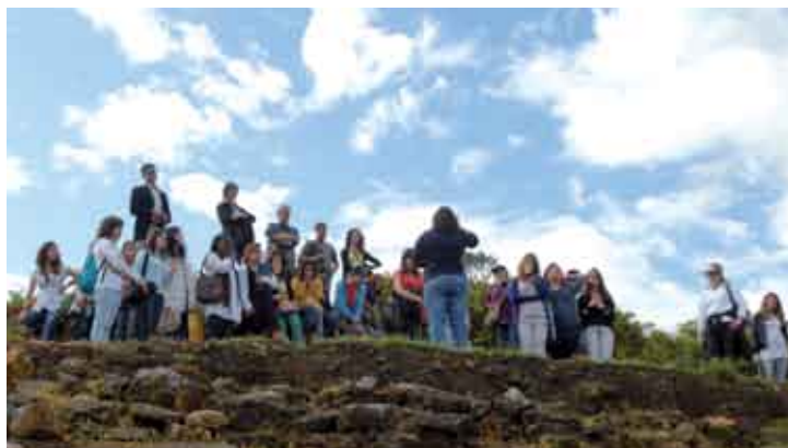
Os participantes tiveram a oportunidade de conhecer a Serra da Arrábida

sões de esclarecimento com técnicos da Associação de Municípios e visitas a vários locais da Arrábida, como as pegadas de dinossaúros do Cabo Espichel, o Convento da Arrábida ou a Serra do Louro, em Palmela.