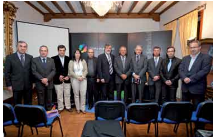
O protocolo foi celebrado com oito autarquias da Península de Setúbal

Para este ano estão ainda previstas visitas ao Navio Oceanográfico, que dão a oportunidade de conhecer o importante trabalho de investigação sobre o meio marinho desenvolvido neste navio.