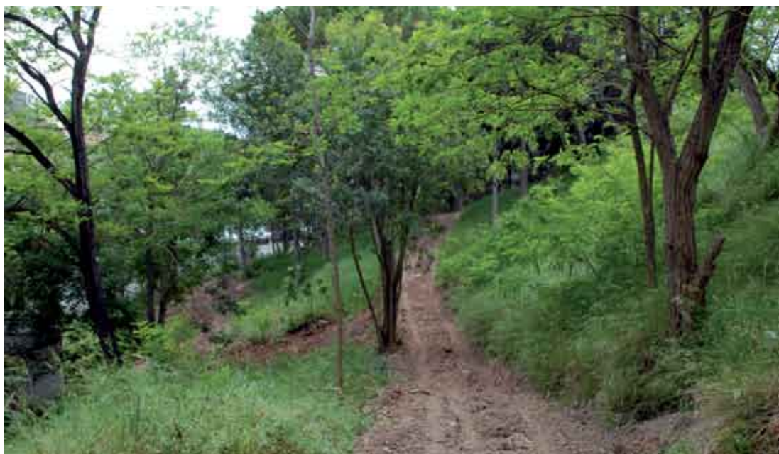
O parque vai ser um espaço ideal para momentos de descanso e lazer

A segunda alternativa, a Sul, dá-se pela EN377, no sentido Alfarim-Zambujal, até ao entroncamento com a EM569, no Zambujal. A partir daqui volta-se à direita, no sentido Cabo Espichel e, após a Estalagem dos Zimbros, volta-se de novo à direita, descendo pela Avenida das Forças Armadas até à Rua da Ponte. Até final do Verão, os trabalhos prosseguem em vias secundárias, incluindo a Rua da Liberdade e o troço da Estrada Municipal 521, desde a EN377 até ao entroncamento com a Rua da Liberdade. A obra está orçada em 540 mil euros e prevê-se que esteja concluída em Dezembro.