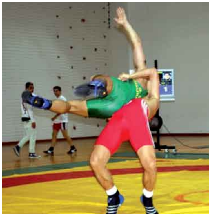
Clube da Quinta do Conde confirmou favoritismo

A prova contou com a participação de 57 atletas de todo o país e foi organizada pelo Clube de Lutas do Bastos em parceria com a Federação Portuguesa de Lutas Amadoras, e com o apoio da Junta de Freguesia da Quinta do Conde e da Câmara Municipal ■