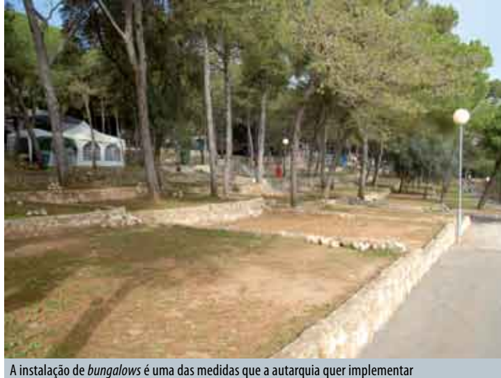
A instalação de bungalows é uma das medidas que a autarquia quer implementar

Entre as medidas a implementar salienta-se a possível instalação de bungalows que complementem a oferta de alojamento, efectuada por um promotor privado, através de concurso público, sem quaisquer custos acrescidos para a autarquia, e com a garantia de receitas adicionais.