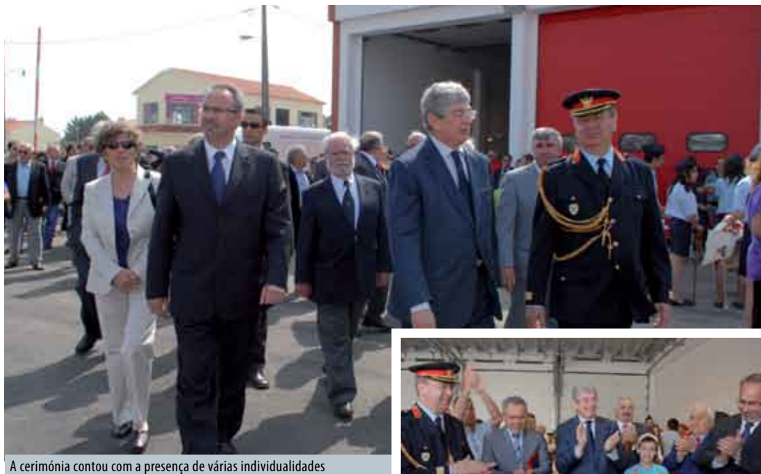
A cerimónia contou com a presença de várias individualidades