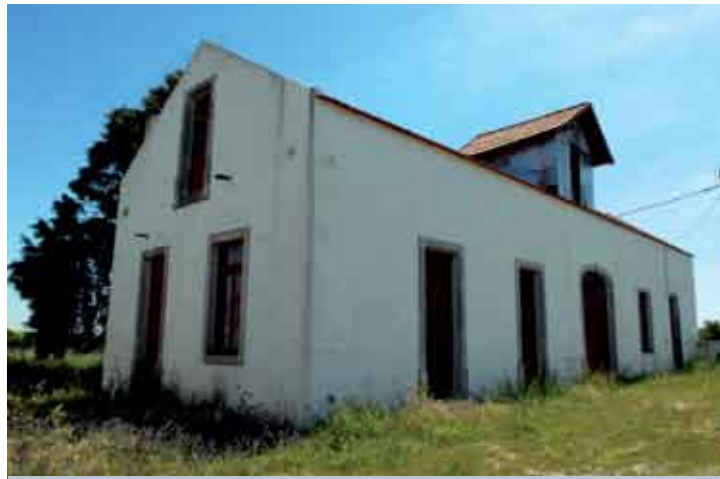
Uma das candidaturas destina-se à recuperação da Moagem de Sampaio

A Moagem de Sampaio está assim mais próxima de se tornar no primeiro núcleo do Museu Municipal exclusivamente dedicado à ruralidade do concelho, mais concretamente ao ciclo do pão, às características tecnoló-