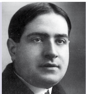
Mário de Sá-Carneiro | a partir de dia 8