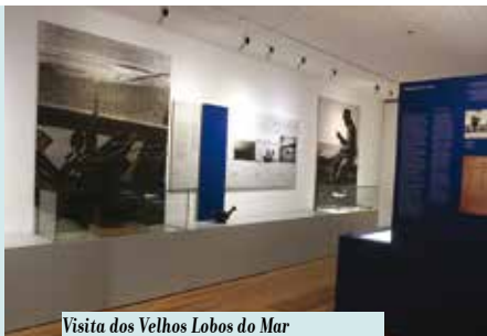
Visita dos Velhos Lobos do Mar ao Museu Marítimo de Sesimbra | dia 16