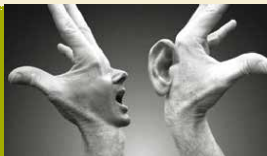
Falar com as Mãos | dia 15