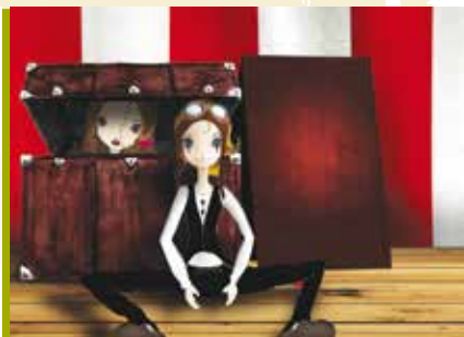
Antes de Começar | dia 30