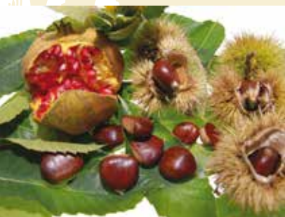
Sr.ª Romã e Dona Castanha | dia 2