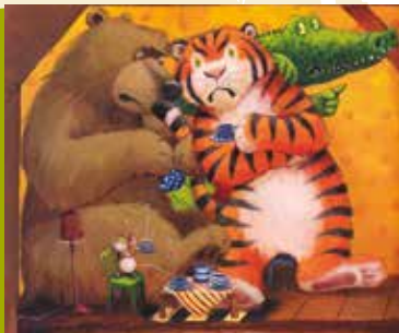
As Três Princesas Pálidas | dia 8