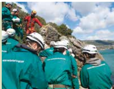
Lapa Verde | dia 19