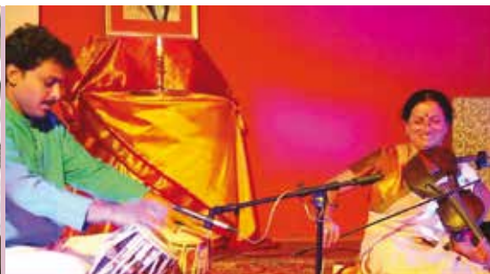
Concerto de Tabla e Violino | dia 20