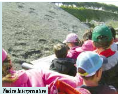
Núcleo Interpretativo da Pedreira do Avelino | a decorrer