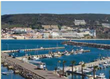
Sesimbra Walking Tour | a decorrer