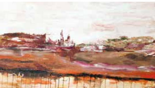
Memórias | de 5 a 20