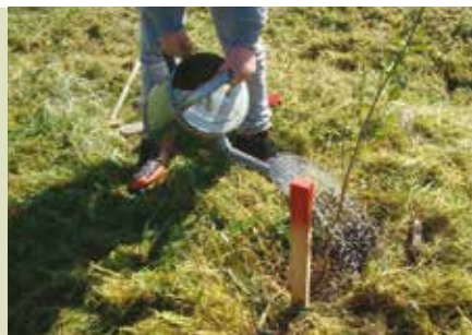
Florestar Portugal 2016 | de 19 a 26