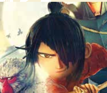
Kubo e as Duas Cordas | dia 13