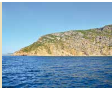
Dia Nacional do Mar | dia 16

2 NOV a 13 DEZ | de segunda a quinta | das 19 às 23h