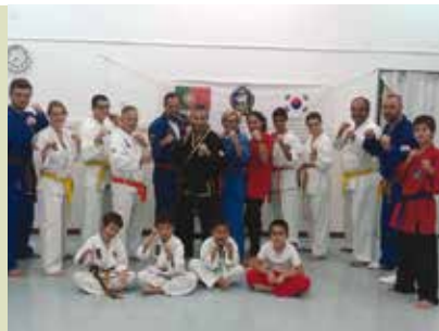
Choi Kwang Do | segunda a quinta