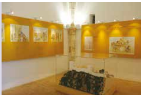
O Castelo de Sesimbra | segunda a domingo