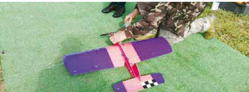
Escola de Aeromodelismo | inscrições