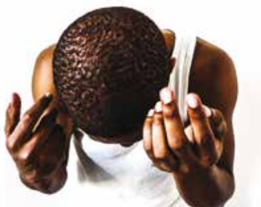
Agora Também Sou Água | dia 23