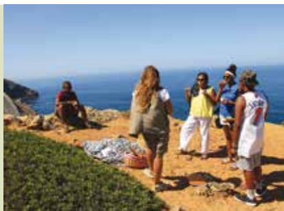
Rota do Cabo Espichel à Lagoa | dias 6, 13, 20 e 27