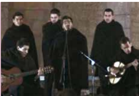
Desassossego | dia 26