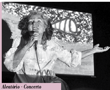
Aleatório - Concerto de Palavras ao Acaso | dia 25