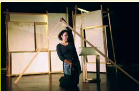
Comer a Língua | dia 16