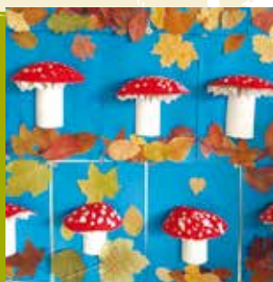
O Cogumelo Perdido | dia 30