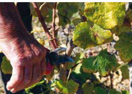
Poda e Exertia em Fruticultura | de 4 a 26