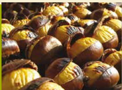
Que Ricas Castanhas | dia 11