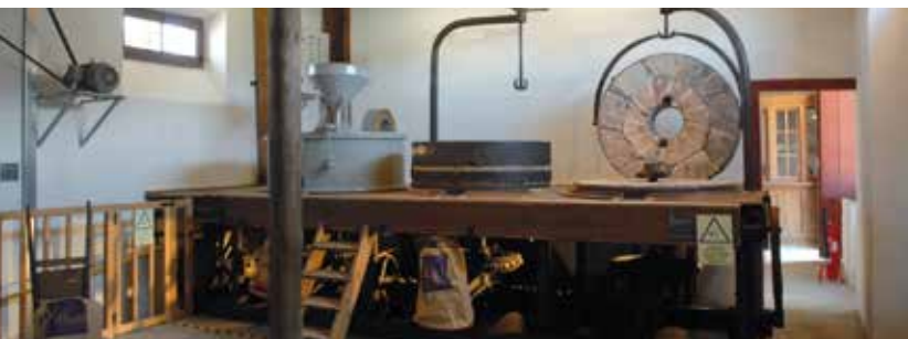
Núcleo Museológico da Magem de Sampaio | quarta a domingo