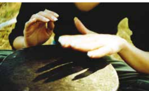
Círculo de Percussão | dia 19