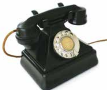
Zimbr'Arte | dias 12 e 26