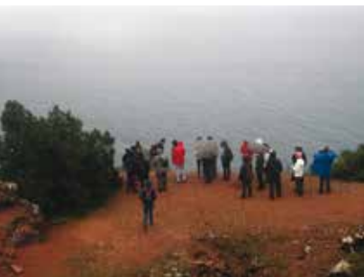
Fojo e História do Risco | dia 1