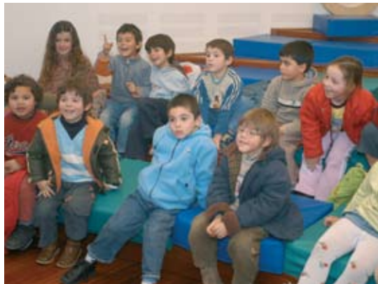
A Avó Vem à Biblioteca Contar uma História

A alimentação tem um papel relevante nas nossas vidas. A Biblioteca Municipal promove, durante todo o mês, ateliês que ensinam aos mais novos os cuidados que se deve ter na conservação dos alimentos.