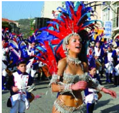
Samba - GRES Trepa no Coqueiro

A Sociedade Musical Sesimbrense recebe, no dia 2 de Setembro, a Banda Municipal Alterense . O espectáculo, inserido num intercâmbio musical, tem lugar na Fortaleza de Santiago pelas 22 horas.