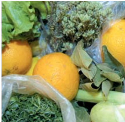
Ateliê sobre Contaminação de Alimentos