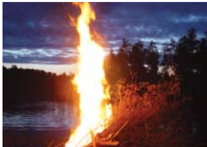
A Protecção Civil é tema da Tertúlia no Castelo

Biblioteca Municipal, Espaço Infanto-Juvenil 15h