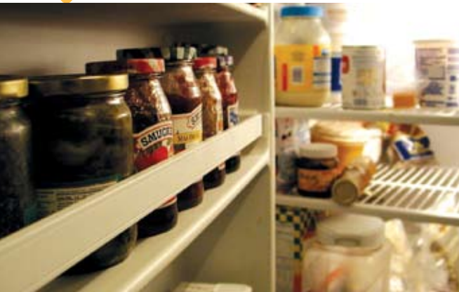
Ateliê, À Descoberta do Frio

Pólo de Leitura da Quinta do Conde (26 | ter.) 14.30h