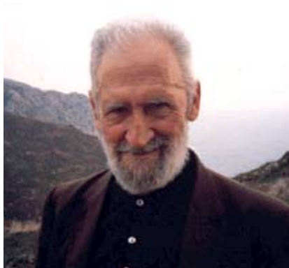
Exposição Agostinho da Silva: Pensamento e Acaso