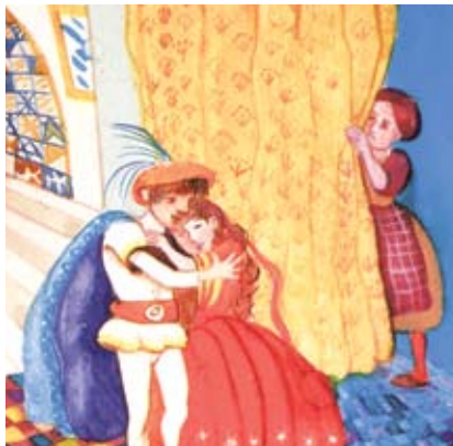
Fita, Pente e Espelho

Criação de um quadro em plastilina e experimentação da cor