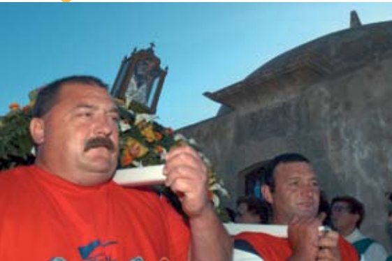
Festejos em Honra de Nossa Sr.ª do Cabo Espichel

O Cubo Romântico é o primeiro espectáculo da Companhia das Artes. Esta adaptação livre da peça de William Shakespeare Sonho de Uma Noite de Verão , decorre nos dias 2, 9 e 22 na Quinta do Conde e na Fortaleza de Santiago.