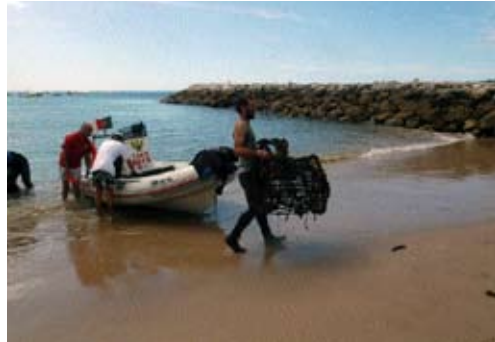
Encontro de Limpeza Subaquática

A popular Regata de Aiolas realiza-se no dia 24, na baía de Sesimbra. A prova, ganhou tradição em 1940, quando um grupo de pescadores, a bordo de uma pequena embarcação de pesca, venceu uma regata inserida na Tarde Náutica Infante D. Henriques, em Lisboa.