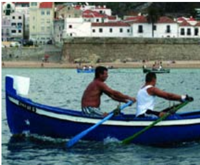
Regata de Aiolas