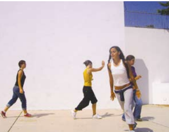
Ensaio do Cubo Romântico