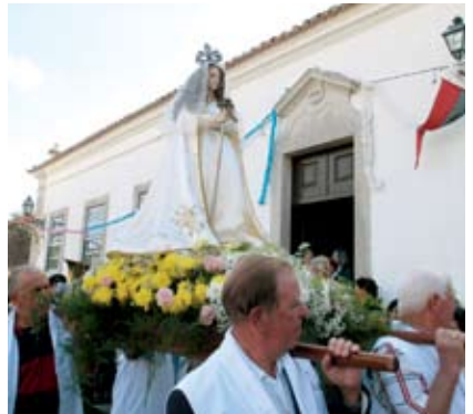
Festas de Nossa Senhora da Luz, Sampaio