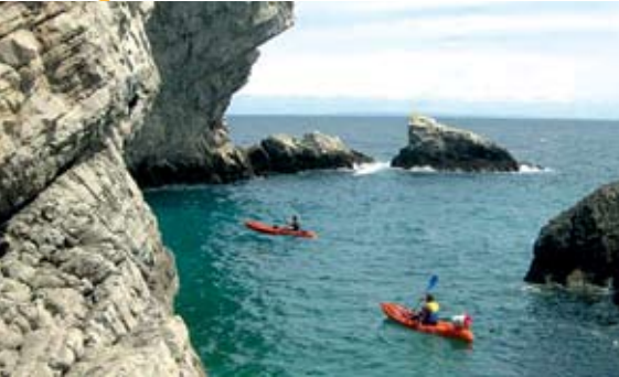
Sesimbra Selvagem em kayak

A baía de Sesimbra recebe, no dia 9, a 11.ª edição do Encontro de Limpeza Subaquática , organizado pela Câmara Municipal e pelo Núcleo de Actividades Subaquáticas do Instituto Superior Técnico. O Encontro conta todos os anos com a colaboração de dezenas de mergulhadores.