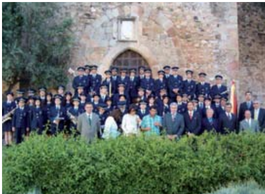
Banda Municipal Alterense