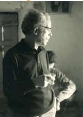
Exposição Fernando Lopes-Graça