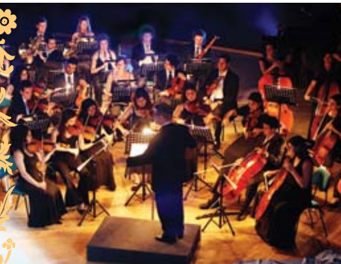
Orquestra Académica Metropolitana