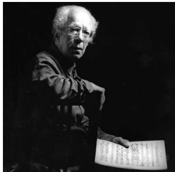
A vida e a obra de Fernando Lopes-Graça são tema de duas conferências