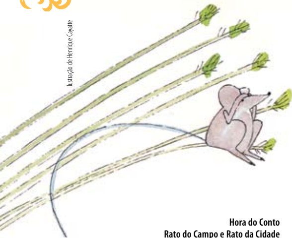
Hora do Conto Rato do Campo e Rato da Cidade