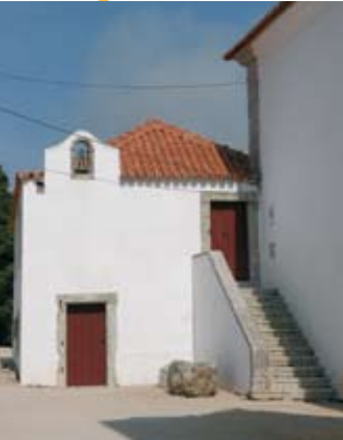
Núcleo de Arqueologia do Museu Municipal