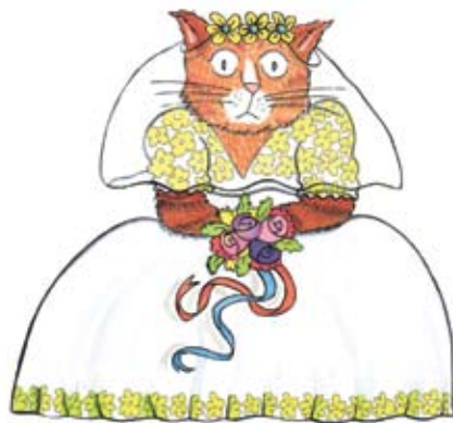
Ilustração de Pedro Leão