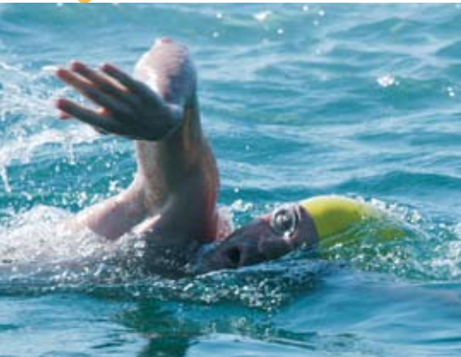
Travessia da Baía