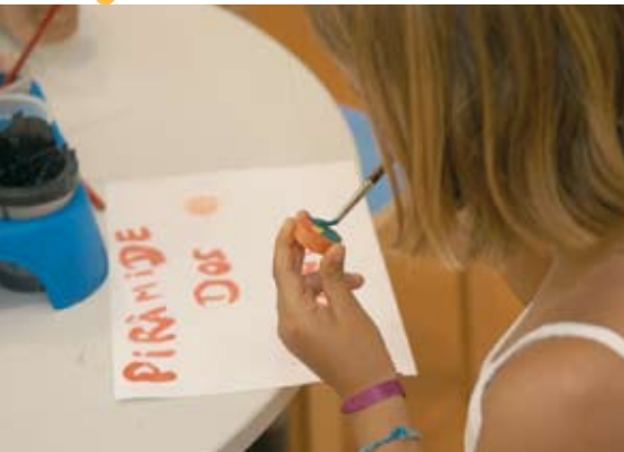
Biblioteca: ateliês sobre alimentação