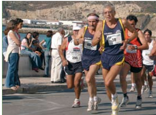
Corrida de Sesimbra

A Corrida de Sesimbra e a Travessia da Baía, nos dias 1 e 5, respectivamente, são duas provas tradicionais que trazem a Sesimbra centenas de participantes. A Travessia da Baía já tem mais de 60 anos e começou por ser organizada pelo Clube Naval. A Corrida de Sesimbra surgiu com a denominação de Espadarte de Prata, há cerca de 20 anos, durante o Festival do Mar.