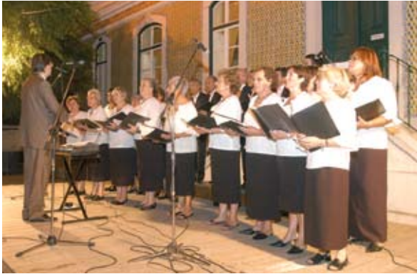
Grupo Coral de Sesimbra