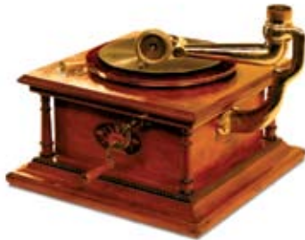
Exposição Engenhos Sonoros