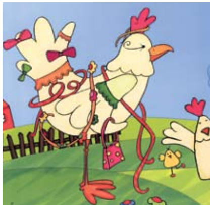
Ilustração de Patrícia Espinho Santo

Hora do Conto – Pimpona, A Galinha Tonta