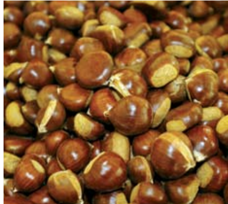
Semana Gastronómica Sabores de Outono