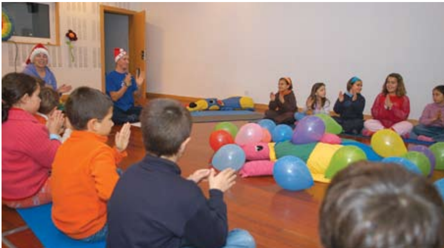
Yoga com Conto Infantil

Yoga com Conto Infantil é o nome do ateliê para crianças agendado para dia 27, das 15 às 16 horas. Os participantes aprendem a concentrar-se e tomam um primeiro contacto com esta disciplina milenar.