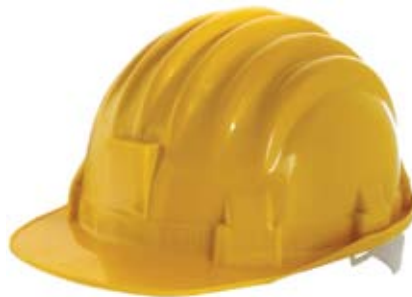
Informação sobre acidentes no trabalho

Biblioteca, Sala Polivalente das 10.30 às 12.30h