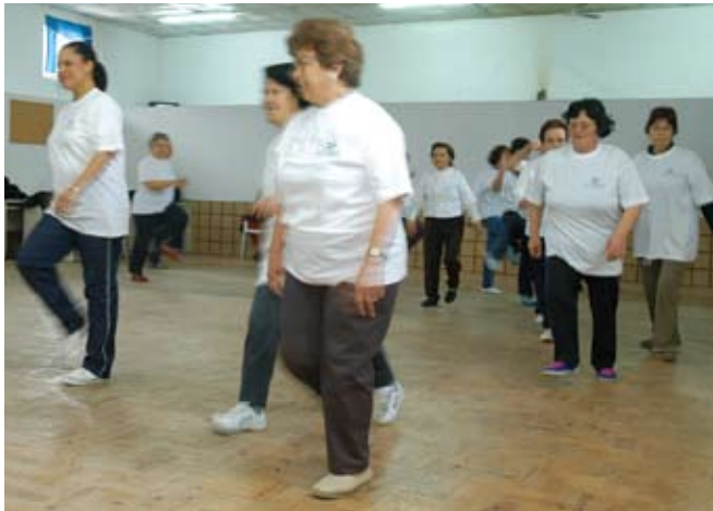
Gerontomotricidade – Oficinas de Movimento

Continuam a decorrer as Oficinas de Movimento dedicadas aos mais idosos, tal como as aulas de Danças de Salão .