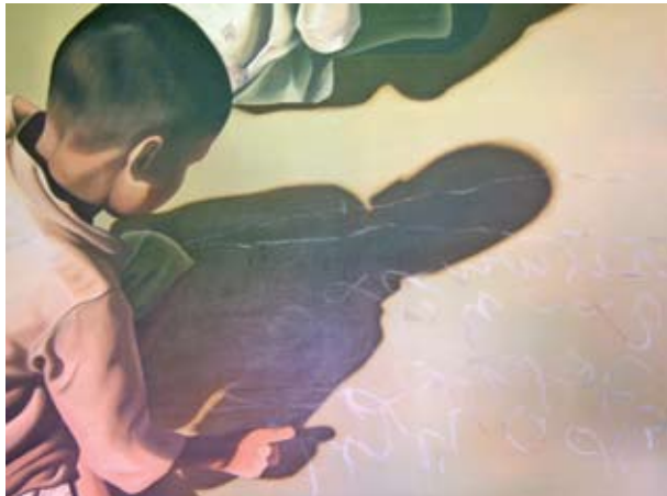
Pintura de Ana Patrão

A Zimbra Inverno , Feira dos Aromas de Inverno, regressa à Fortaleza de Santiago, entre 10 e 11 de Fevereiro, para divulgar os produtos tradicionais do concelho.