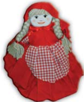
O Capuchinho Vermelho