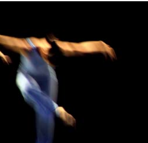
Formação de Dança