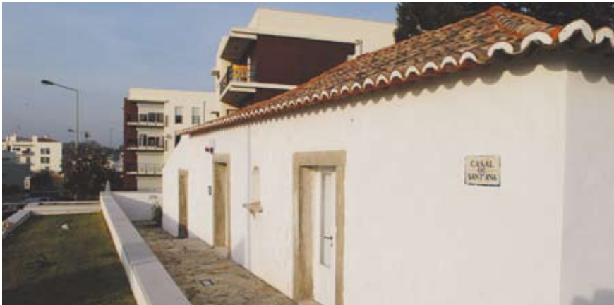
Universidade Sénior, na Cotovia

A Universidade Sénior é inaugurada dia 24, na Cotovia. Neste local, os seniores vão poder ter aulas de inglês, informática, português, sociologia e cidadania. A inauguração está agendada para as 17 horas.