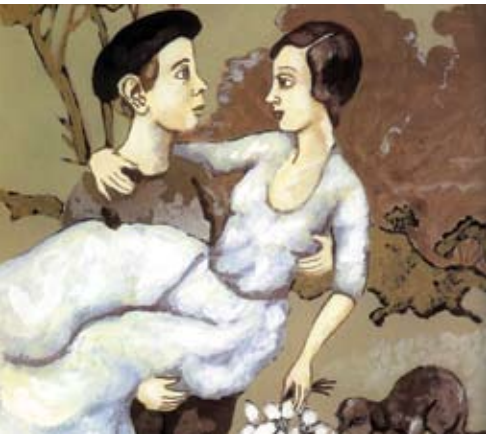
Ilustração: Bela Silva