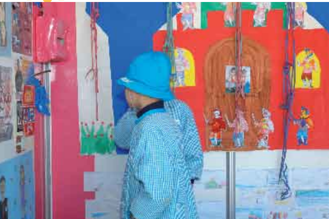
Mostra de Projectos Educativos