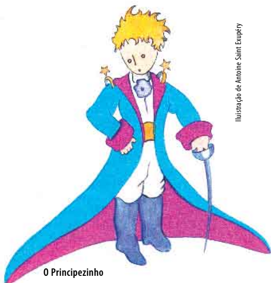
Ilustração de Antoine Saint-Exupéry