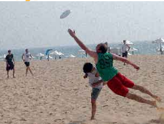
Torneio de Frisbee