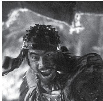
Os Sete Samurais