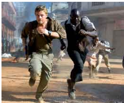
Diamante de Sangue