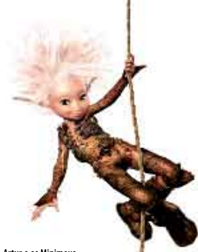
Artur e os Minimeus