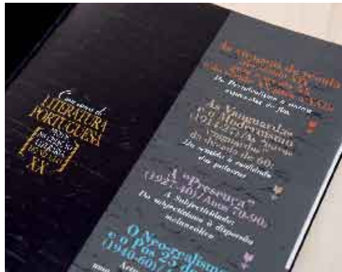
Curso Breve de Literatura