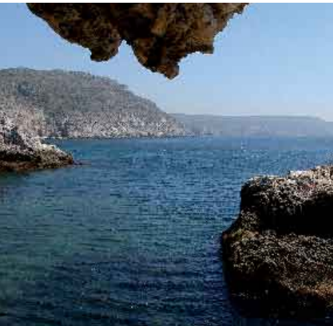
As Alterações Climáticas e o Litoral