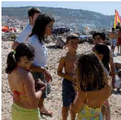
Circuito do Ambiente