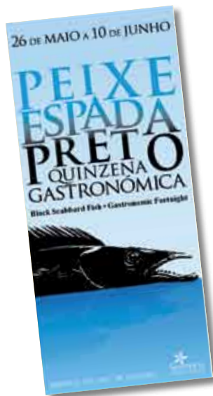
Quinzena do Peixe-espada Preto