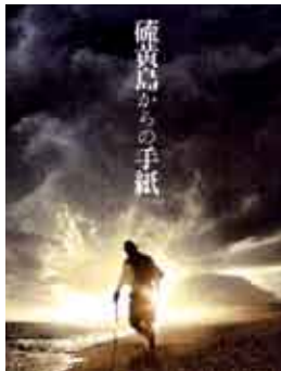
Cartas de Iwo Jima