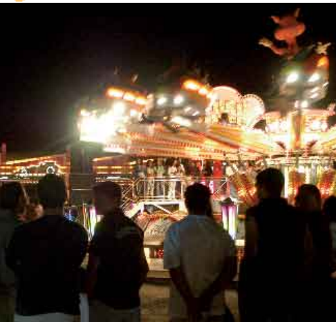
Feira Festa da Quinta do Conde