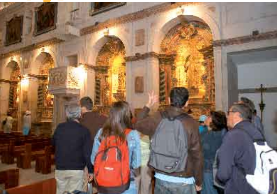
Conversas na Capela