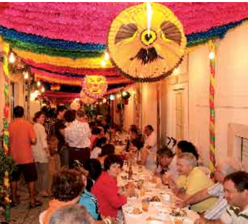
Festas dos Santos Populares