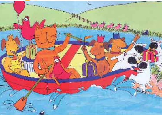
Ilustração de Sarah Battle