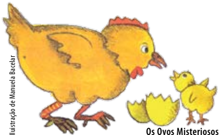
Ilustração de Manuela Baccar