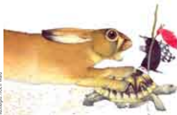
Ilustração: Helen Ward

Sala Infanto-juvenil, Biblioteca Municipal de Sesimbra