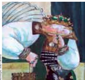
Ilustração: Ivo Casanova

Sala Infanto-juvenil, Biblioteca Municipal de Sesimbra