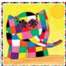
Ilustração: David Mckee

dia 22 | sáb | 11h Sala Infanto-juvenil, Biblioteca Municipal de Sesimbra