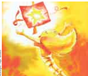
Imagem: Filipe Goulão