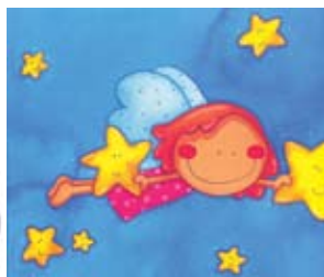
Ilustração: Tim Wörner

Org.: Associação de Municípios da Região de Setúbal | CM Sesimbra