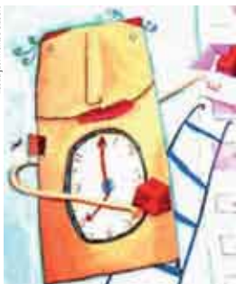
Ilustração: Montse Gisbert