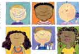
Ilustração: Emma Damon