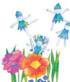
Ilustração: Joana Quental