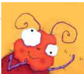
Ilustração: Liz Pichon