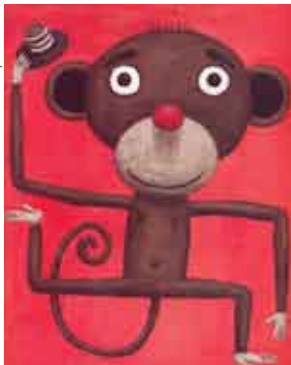
Ilustração: André Letria