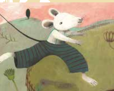
Simão Mentiras | dia 18