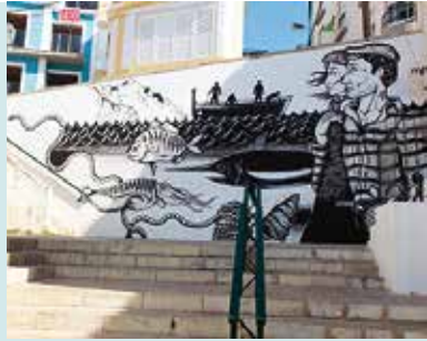
Sesimbra é Peixe e Arte na Rua