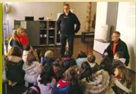
Vamos Criar Novas Histórias