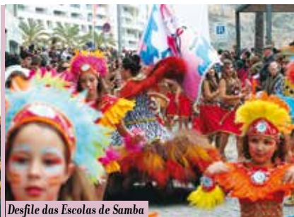
Desfile das Escolas de Samba e Grupos de Axé | dias 26 e 28