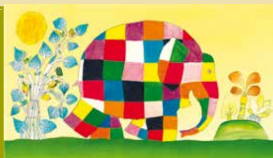
Elmer | dia 24