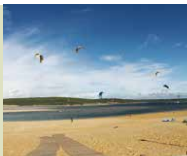
Rota do Cabo Espichel à Lagoa | dia 26