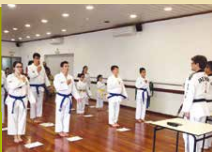
Taekids | segundas, quartas e sextas