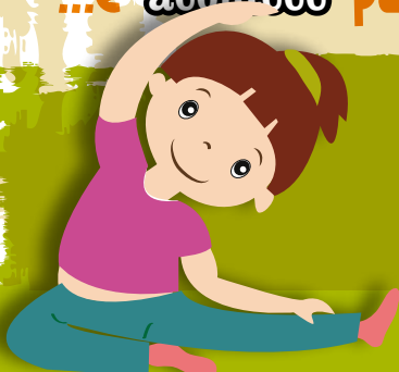
Yoga Infantil | sábados