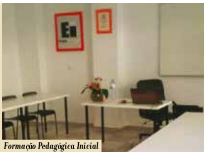
Formação Pedagógica Inicial de Formadores | a partir de dia 4