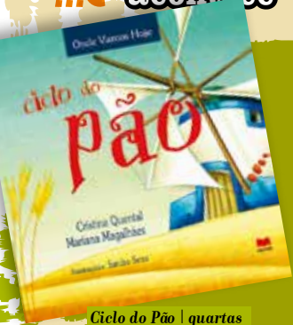
Ciclo do Pão | quartas