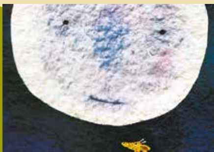
A que Sabe a Lua? | dia 17