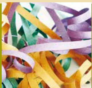
Lagartas com Serpentinhas | dia 24