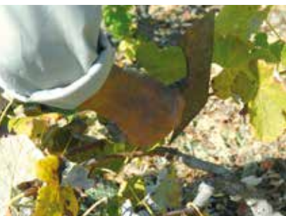
Poda e Exertia em Fruticultura | de 3 a 25