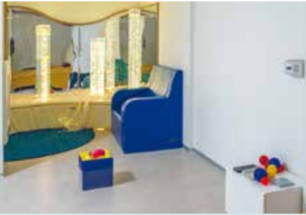
Sala de Snoezelen