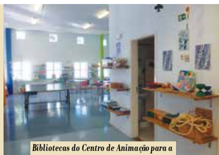
Bibliotecas do Centro de Animação para a Infância da Cercizimbra | segunda a sexta