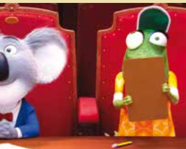
Cantar | dia 19