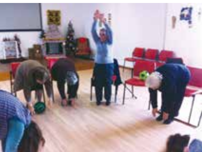
Clube Ativo | dia 1