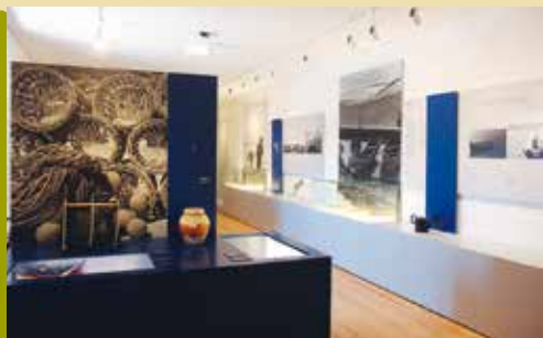
O Mar | a decorrer