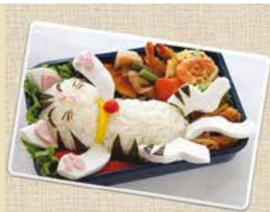
Lancheiras & Marmitas | dia 11