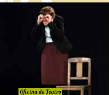
Oficina de Teatro e Comichidade | dia 18