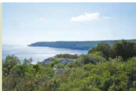
Por Caminhos de Santiago | dia 19