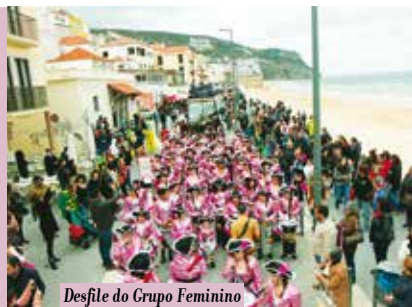
Desfile do Grupo Feminino de Afro-Axé Tripa Mijona | dia 25