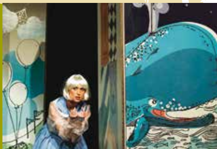
Pinóquio | dia 8