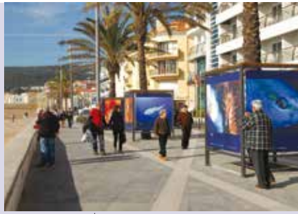
Do Jardim ao Cabo | a decorrer