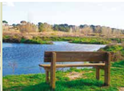
Parque Ecológico da Várzea e Parque da Ribeira | dia 18