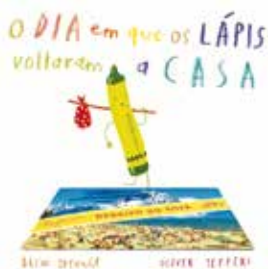
O Dia em que os Lápis Voltaram a Casa