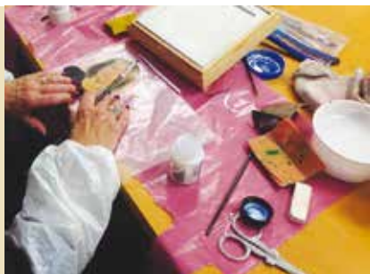
Universidade Sénior de Rotary de Sesimbra