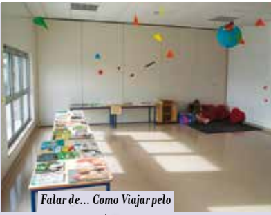
Falar de... Como Viajar pelo