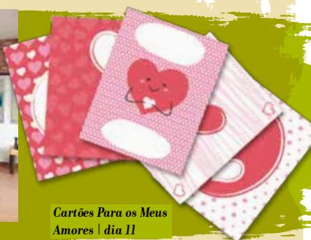
Cartões Para os Meus Amores | dia 11