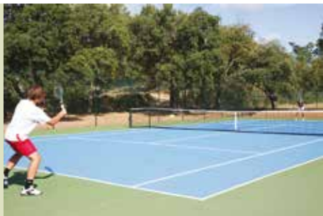
Escola para Jovens e Adultos

• sextas, das 11 às 12h Centro Cultural Social e Recreativo A Voz do Alentejo Ateliê de Artes e Ofícios