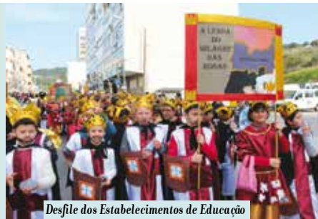
Desfile dos Estabelecimentos de Educação e Ensino | dias 23 e 24