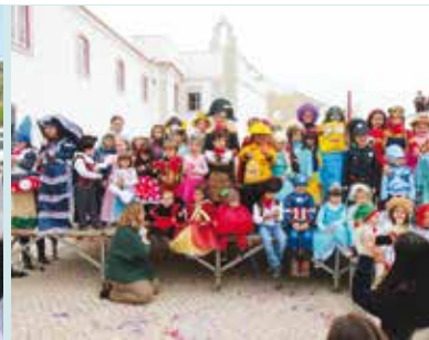
Concurso Infantil de Fantasias | dia 25