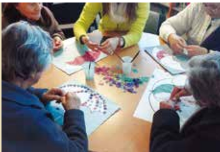
Clube Ativo | dia 15