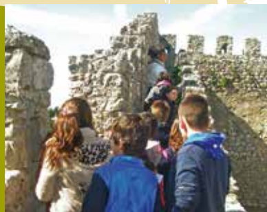
À Descoberta pelo Castelo