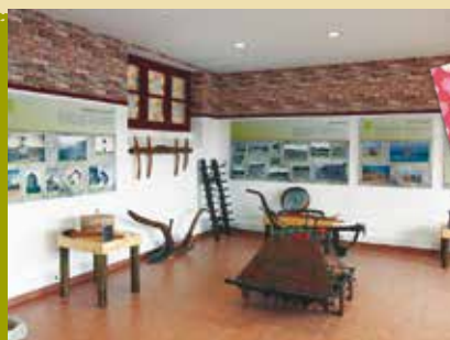
Profissão - Agricultor | dia 7