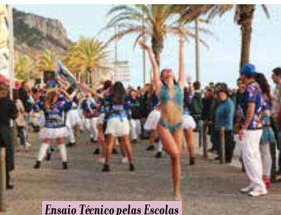
Ensaio Técnico pelas Escolas de Samba e Grupos | dia 19