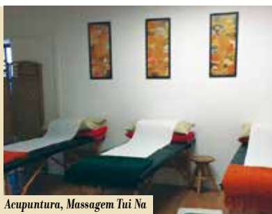
Acupuntura, Massagem Tui Na e Fisioterapia Chinesa | terças