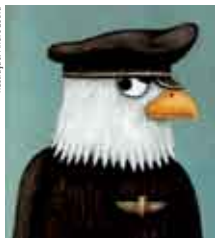
Ilustração: André Letria

Sala Polivalente, Biblioteca Municipal de Sesimbra