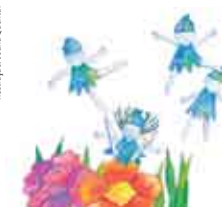
Ilustração: Joana Quental

Animação direccionada para as crianças do 1.º e 2.º ano do 1.º ciclo.