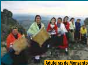
Adufeiras de Monsanto