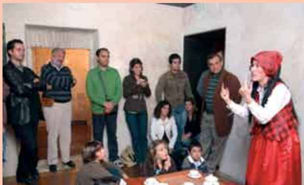
a decorrer Capela do Espírito Santo dos Mareantes, Sesimbra

Durante os meses de Verão a Capela do Espírito Santo dos Mareantes abre as portas a visitas bem diferentes das habituais, que dão a conhecer de uma forma divertida e pedagógica a história do edifício, proporcionando novas perspectivas de vivência do espaço museológico. A Capela: Suas Histórias e Suas Obras, Outras Obras do Museu, Um Olhar Sobre o Hospital Medieval e À Noite na Capela têm como principais objectivos dar a conhecer o espólio museológico, fomentar o gosto pela arte e pela história local, explorar o conceito de ver através de exercícios de aprender a ver, dar espaço à reflexão e partilhar experiências e vivências. Ao longo das actividades os visitantes participam em jogos, exercícios de orientação e expressão plástica e leitura de histórias.