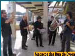
Macacos das Ruas de Évora