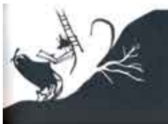
Ilustração: Gémeo Luis

dia 14 | ter | 10.30 e 14.30h Cineteatro Municipal João Mota, Sesimbra