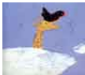
Ilustração: Henrique Cayatte

Sala Infanto-juvenil, Biblioteca Municipal de Sesimbra