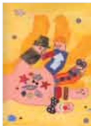
Ilustração: Sarah Pirson

Sala do Conto, Biblioteca Municipal de Sesimbra