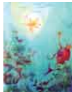
Ilustração: Catarina França