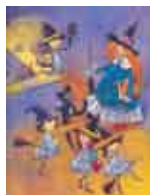
Ilustração: Pawel Pawlak