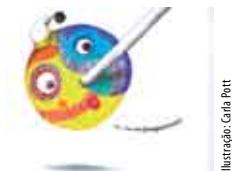
Ilustração: Carla Pott

Sala do Conto, Biblioteca Municipal de Sesimbra