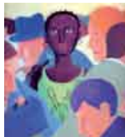
Ilustração: Erik Lambé

Sala Infanto-juvenil, Biblioteca Municipal de Sesimbra