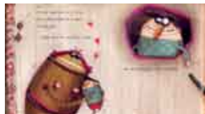
Ilustração: Anna Laura Cantone