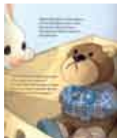
Ilustração: Quentin Gréban