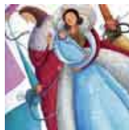
Ilustração: Fátima Afonso