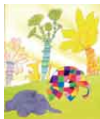
Ilustração: David Mckee