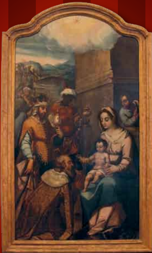
Adoração dos Magos | obra em exposição na Capela do Espírito Santo dos Mareantes - Sesimbra