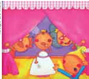
Ilustração: Carla Antunes

terças e quintas | 10 e 14.30h HORA DO CONTO