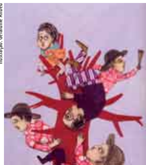
Ilustração: Géraldine Alibeu