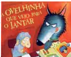
Ilustração: Joelle Dreidemey

quartas e sextas | 10.30 e 15h O CONTO NO ESPAÇO