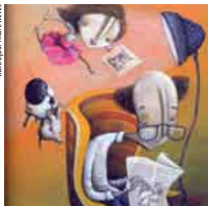
Ilustração: André Neves

Sala Infanto-juvenil, Biblioteca Municipal de Sesimbra