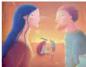
Ilustração: Nicoletta Ceccoli

Cineteatro Municipal João Mota, em Sesimbra