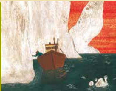
Ahab e a Baleia Branca | dia 11