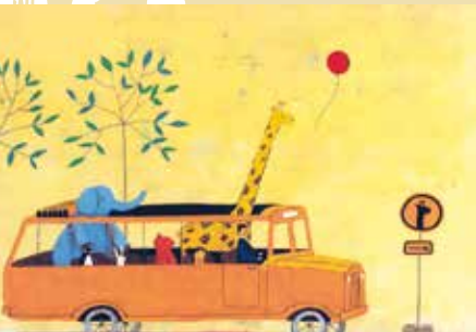
O Meu Balão Vermelho | dia 4