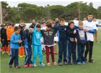
19.ª Torneio Páscoa | dias 14 e 15