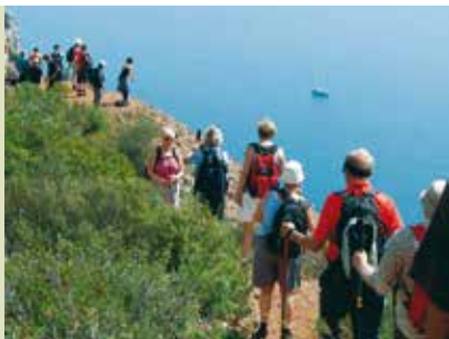
Serra do Risco | dia 29