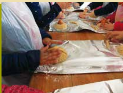
Vem Confeccionar o teu Folar da Páscoa | dia 12