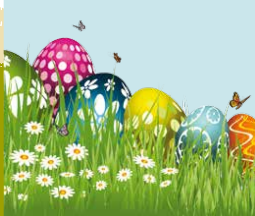
Caça ao Ovo no Espaço Zambujal | dia 6