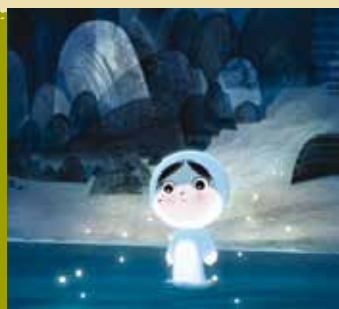
A Canção do Mar | dia 12