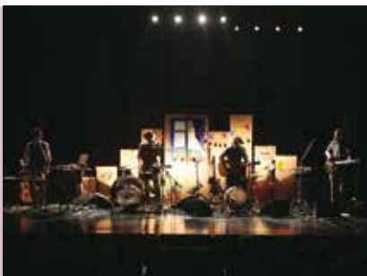
Virgem Suta | dia 24