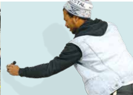
Street Art Society | de 4 a 18