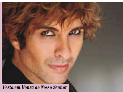
Festa em Honra de Nosso Senhor Jesus das Chagas | dia 30