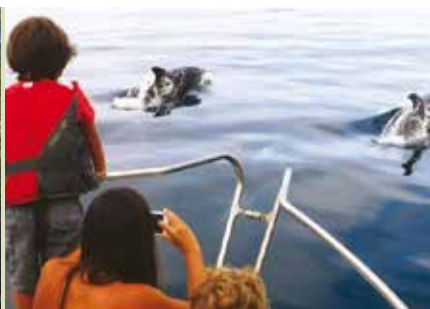
Observação de Golfinhos | dia 30