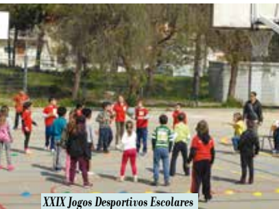
XXIX Jogos Desportivos Escolares do Concelho de Sesimbra | dias 3 e 4