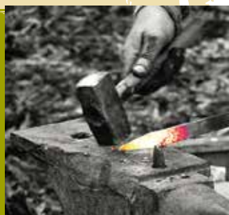
Profissão - Ferreiro | dia 6