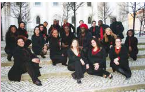
Música na Páscoa | dia 16