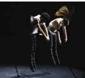
Projeto Quorum | dia 8