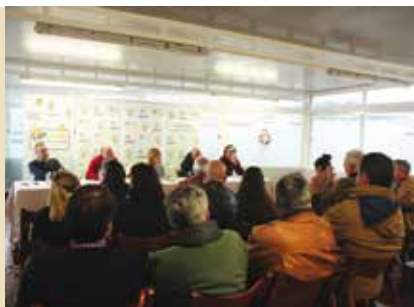
Opções Participadas | dias 8, 21, 28 e 29