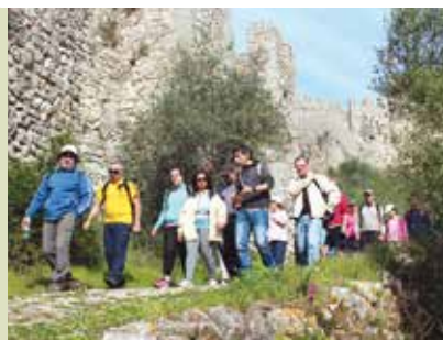
Pedalar e Caminhar pelo Património | dias 2 e 23