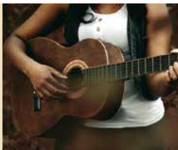
Aula de Guitarra | dia 21