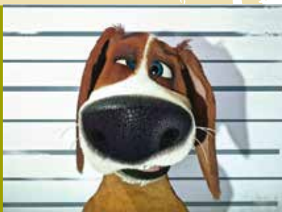
Ozzy | dia 23