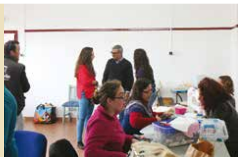
Eleito Por Um Dia | de 19 a 21