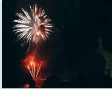
Comemorações do 25 de Abril