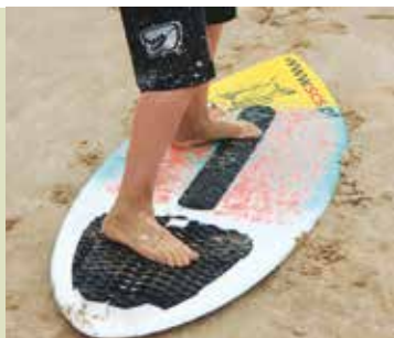
Surf, Skimming e BodyBoard | dia 12