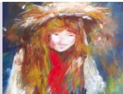
Ecos de Mim | a partir de dia 22