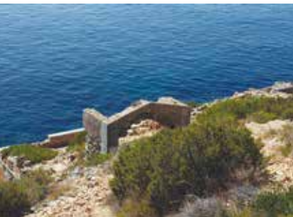
Forte da Baralha e Chã dos Navegantes | dia 23