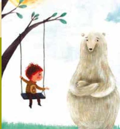
Somos Amigos? | dia 20