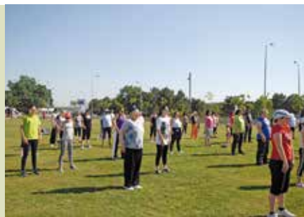
Sábados em Movimento | dias 1, 8, 15, 22 e 29