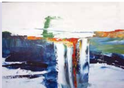
Terra Salpicada de Pingos de Água | até dia 9