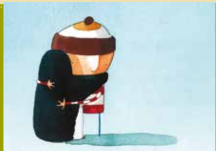
Perdido e Achado | dias 18 e 29