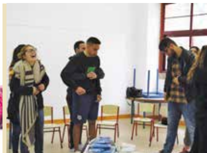
Formação de Monitores de Campos de Férias | de 7 a 9