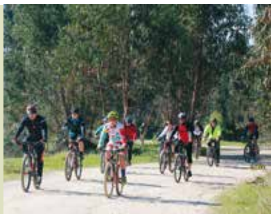
Rota dos Almoçreves | dia 2