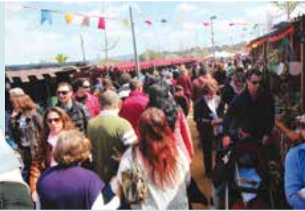
II Festa Medieval da Quinta do Conde | de 13 a 16