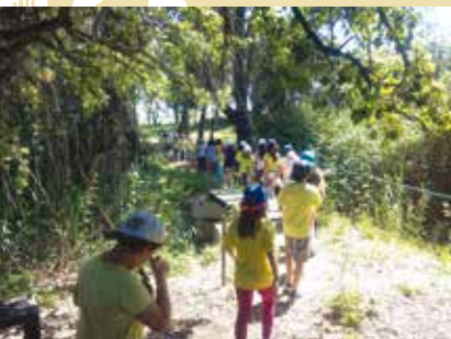
EcoFérias | de 10 a 13