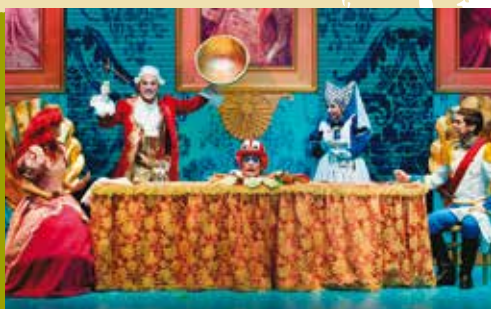
A Pequena Sereia | dia 18