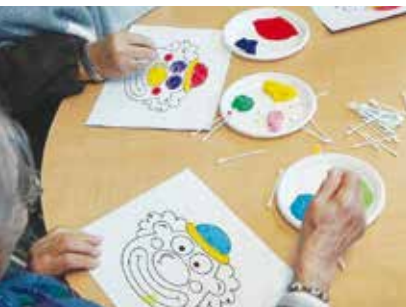
Clube Ativo | dia 26