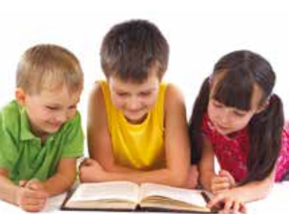
Concurso Concelhio de Leitura | dia 1