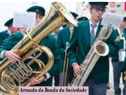
Arruada da Banda da Sociedade Sesimbrense | dia 25