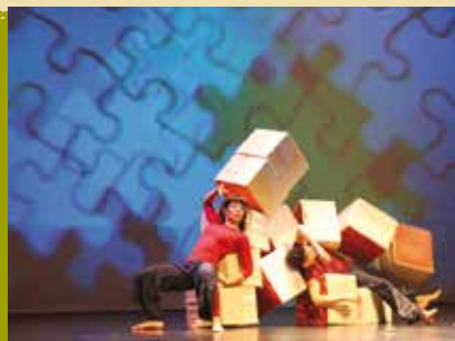
Zig Zag Zum | dia 9