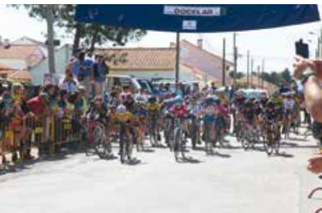
VI Prémio de Ciclismo Juvenil da Quinta do Conde | dia 9