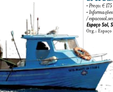
Mar, um Recurso a Preservar | 20 e 21 MAI

com Carlos Santos Marques • Preço: € 100 • Informações: 91 859 30 07 / info@casaldofrade.com / www.casaldofrade.com Casal do Frade e Porto de Sesimbra Org.: Casal do Frade e Sitio Sanus