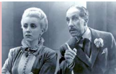
A Vizinda do Lado | 5 MAI