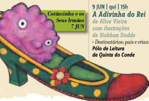
Cotãozinho e os Seus Irmãos 7 JUN