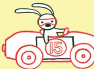
Não é Uma Caixa | 2 JUN