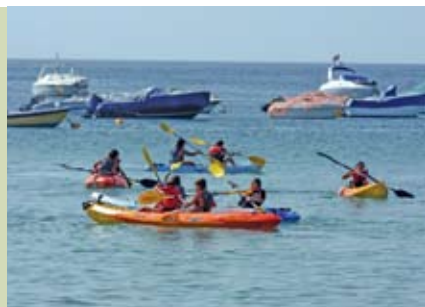
Sesimbra Selvagem | 22 MAI