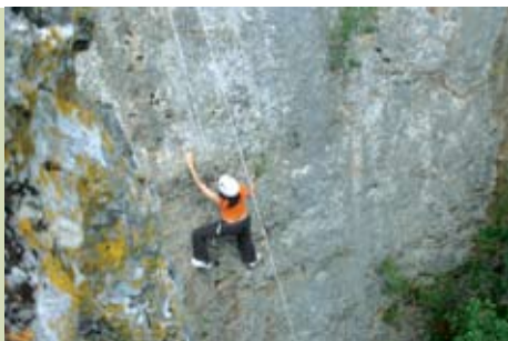
Escalada em Sesimbra | 8 MAI