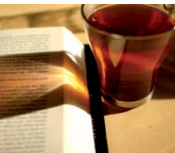
Leituras com Chá | 16 JUN