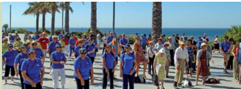
Passaio Borda D'Água | 16 JUN