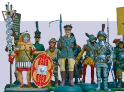
Soldadinhos, Memórias da Infância e Momentos da História | 1 a 11 JUN