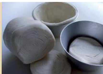
Confeção de Massas Folhadas | a decorrer