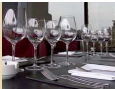
Segurança Alimentar e Rastreabilidade | 16 MAI