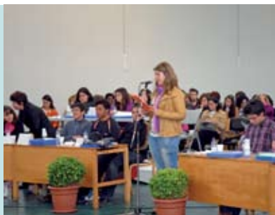
Assembleia Municipal de Jovens | 21 MAI