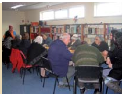
Ateliê de Pintura e Desenho | terças