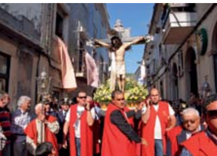
Procissão | 4 MAI