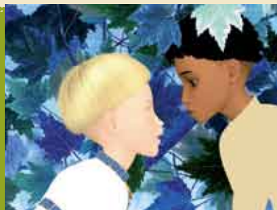
As Aventuras de Azur e Asmar | 12 JUN