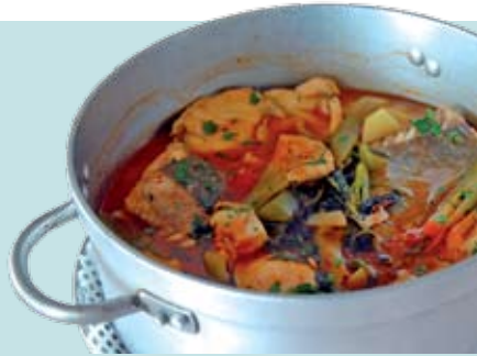
Mostra de Caldeiradas | 17 a 30 JUN