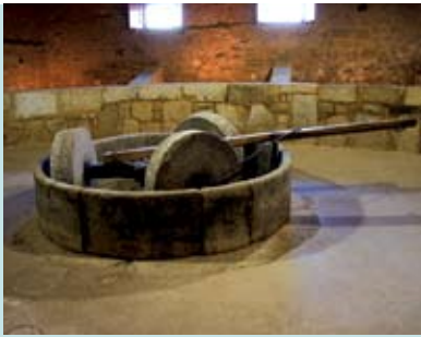
Lagares de Azeite | 25 JUN