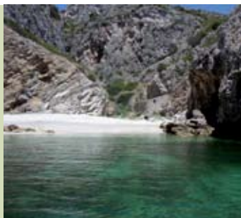
Praia do Paraíso (Baleeira) | 11 JUN