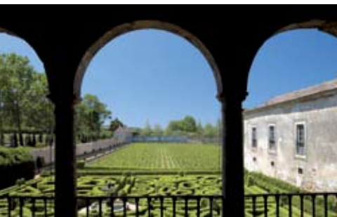
Quinta e Palácio da Bacalhoa | 10 JUN