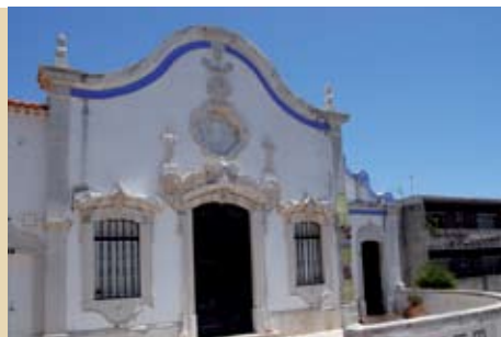
A Tolerância Religiosa: das Práticas ao Diálogo | 20 MAI