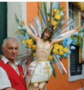
Festa das Chagas | 4 MAI