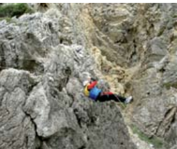
Blue Line | 1 MAI