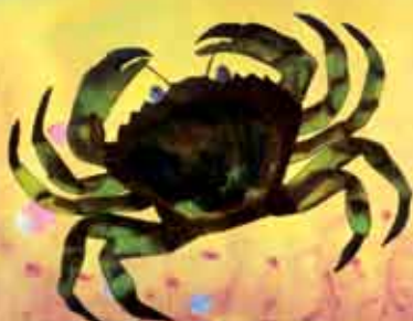
Os Amigos da Menina do Mar | 27 MAI