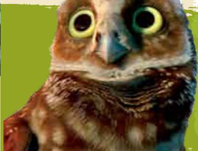
A Lenda dos Guardiões | 26 JUN