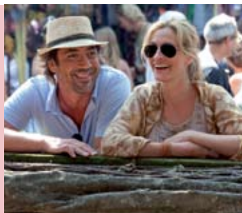
Comer, Orar, Amar | 10 JUN