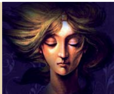
Os Pecados da Rainha Santa Isabel | 28 MAI