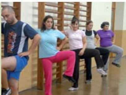
Gente Activa | segundas e quartas