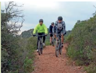
BTT Pelo Património | 28 MAI e 18 JUN