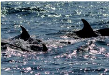
Golfinhos do Sado | domingos