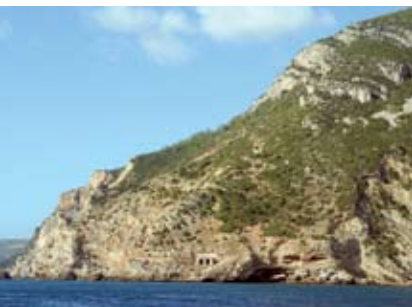
Calhau da Cova | 26 JUN