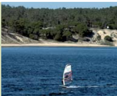
Windsurf e Kitesurf