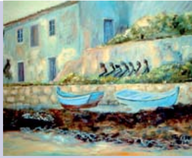
Quint'Antiga | 19 JUN