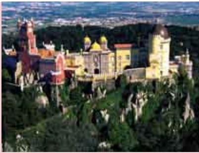
Sintra, Capital do Romantismo | 10 SET