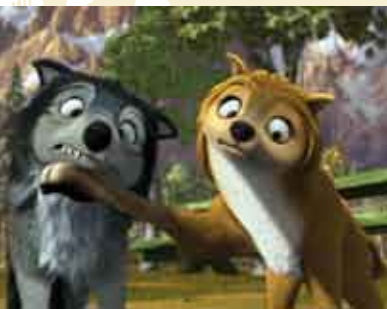
Alpha & Omega | 7 SET