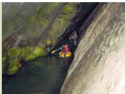
Gruta da Grande Falha | 1 e 2 OUT