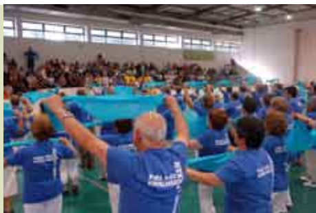
Sempre a Mexer Para Não Envelhecer | SET e OUT