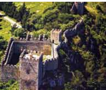
À Descoberta do Castelo | sábados