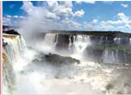
Foz do Iguaçu Destino do Mundo | 10 SET