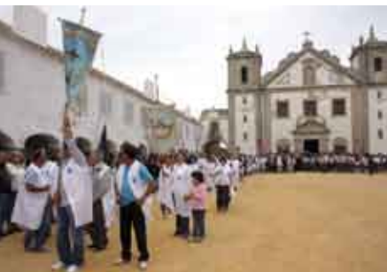
Festa do Cabo | 23 a 26 SET