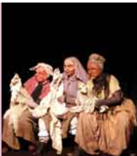
Com Um as Asas Enormes | 8 OUT