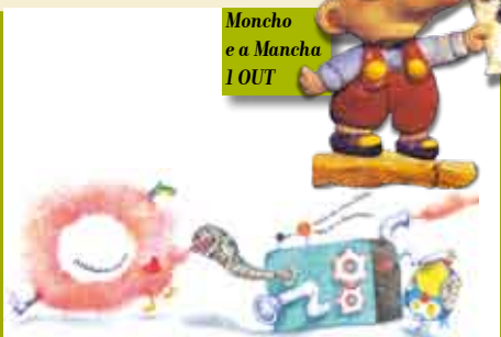
Moncho e a Mancha 1 OUT