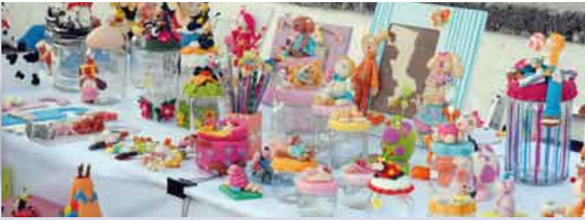
Zimbr'Arte | 11 e 25 SET e 23 OUT