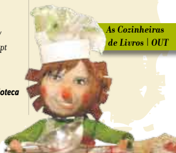
As Cozinheiras de Livros | OUT

• Obra vencedora do Prémio Literário Maria Rosa Colaço • Inserido no Serviço Educativo Municipal Sala Infanto-juvenil, Biblioteca Municipal de Sesimbra