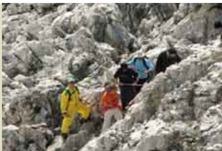
Chãdos Navegantes | 9 OUT