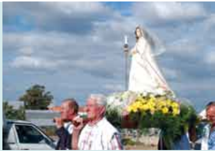
Festa da Luz | 9 a 11 SET

1 a 17 SET | terça a sábado | das 14 às 20h