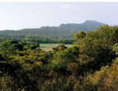
Serra do Risco | 8 OUT