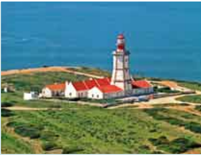
Dia Mundial do Turismo