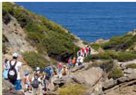
Maravilhas das Aguncheiras | 3 SET