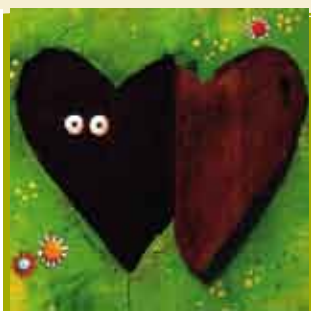
A Semente Sem Sono | 6 OUT