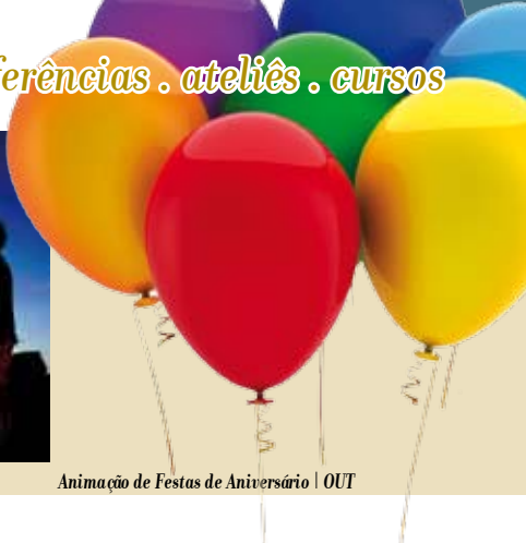
Animação de Festas de Aniversário | OUT