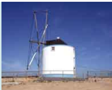
Moinho do Outeiro