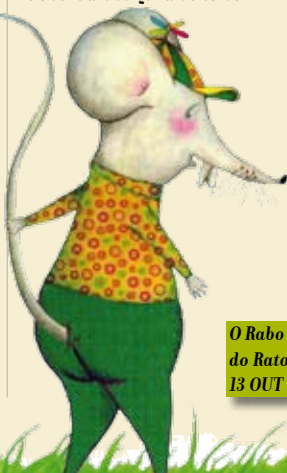
O Rabo do Rato 13 OUT