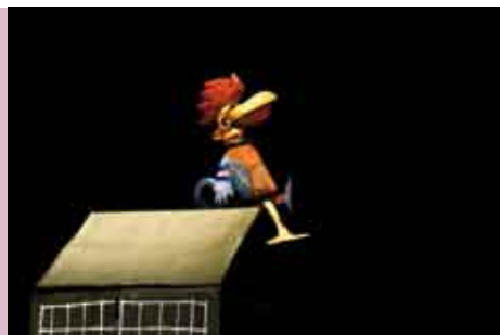
O Senhor de La Fontaine em Lisboa | 30 OUT