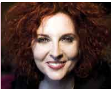
As Cores Que o Jazz Tem | 17 SET