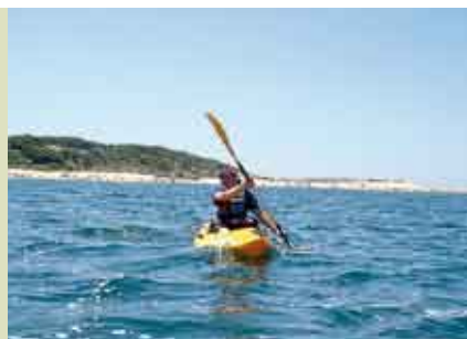
Canoagem Lagoa de Albufeira | 24 SET