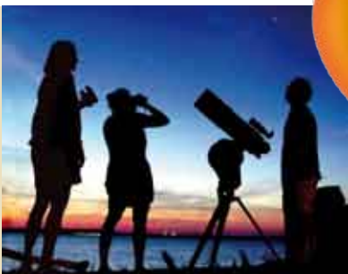
Astronomia para Todos | 9 SET