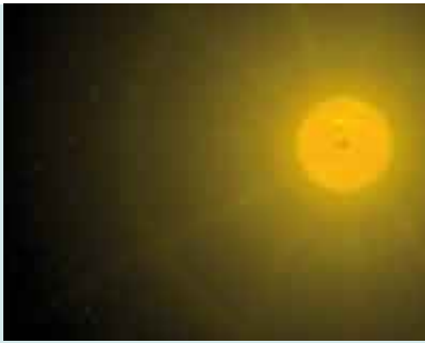
Observação Solar | 6 e 13 SET