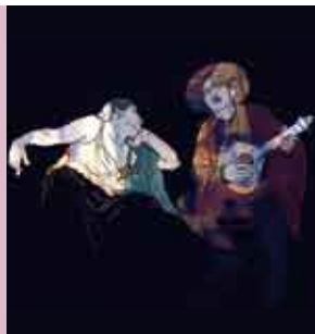
Fado Portugal | 22 OUT