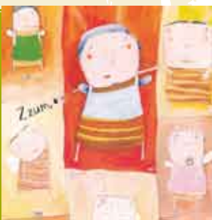
O Bebê Mais Doce do Mundo | OUT