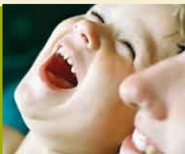
Terapia do Riso | 27 SET