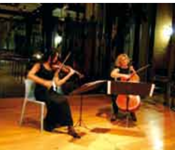
Recital Dueto de Cordas | 23 OUT