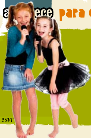
Karaoke | 2 SET