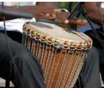
Percussão | 22 OUT