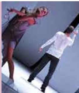
Giselle: Revenge | 14 OUT