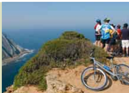
BTT - 2.ª Maratona do Cabo Espichel | 15 OUT