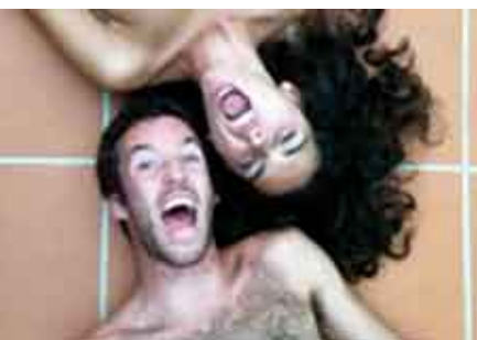
Estudo 1 para Porque Vale a Pena Viver | 10 e 11 SET