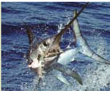
Torneio de Pesca ao Espadarte | SET