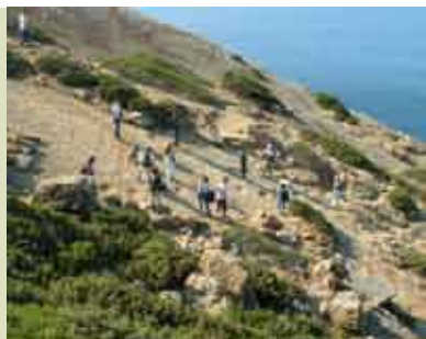
Na Pista dos Dinossáurios | 10 SET