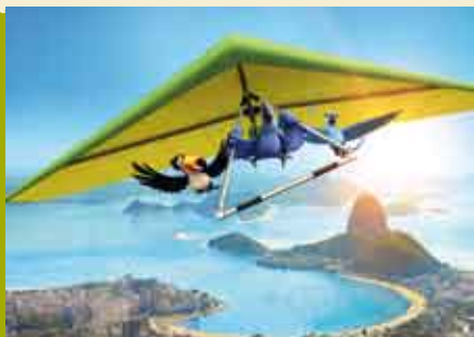
Rio | 25 SET