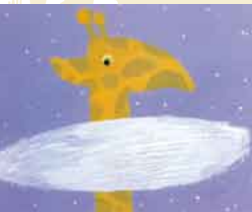
A Girafa Que Comia Estrelas | 8 SET