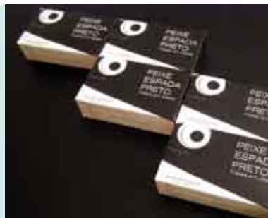
Degustação - Conservas Nero | 8 ABR