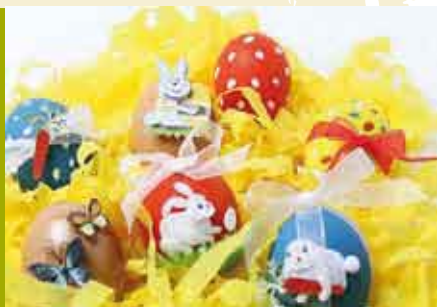
Decorações de Páscoa | 15 MAR