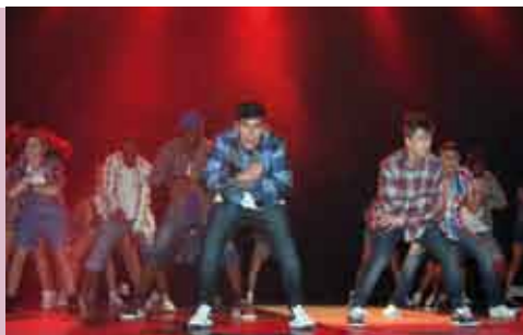
MCBOOS e Convidados | 28 ABR