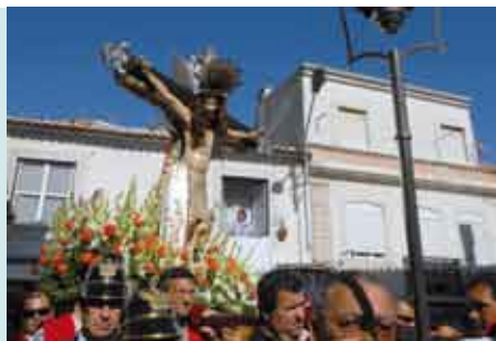
Procissão Senhor Jesus das Chagas | 15 ABR