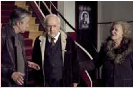
A Morte de Carlos Gardel | 17 MAR