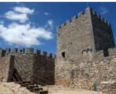
À Descoberta do Castelo | 3 e 17 MAR