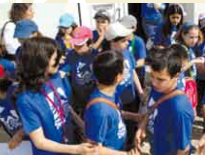
Caça aos Ovos | 29 MAR