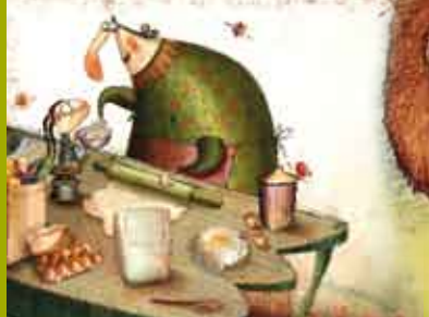
O Que é o Amor? | 1 MAR