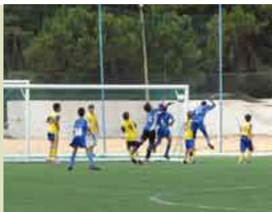
Sesimbra Summer Cup | Inscrições