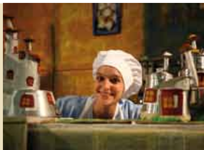
As Cozinheiras de Livros | 14 ABR