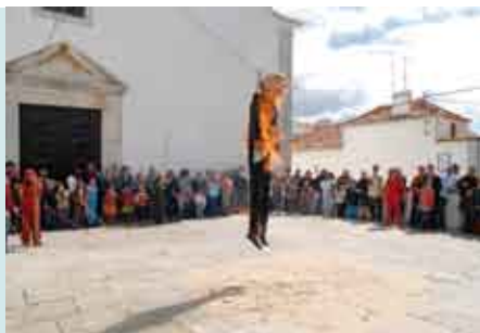
Queima do Judas | 7 ABR