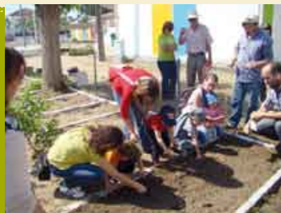
Manhãs no Espaço Hortelão | 18 ABR