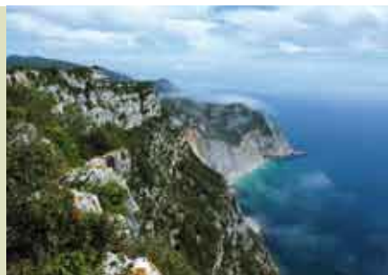
Fojo e a História do Risco | 15 ABR