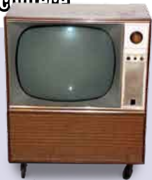
Quint'Antiga | 18 MAR