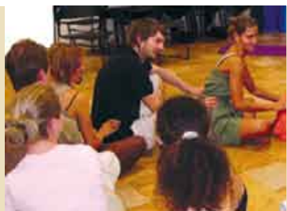
Ciclo Do It | 17 e 24 MAR