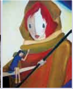
Parte de Mim | ABR