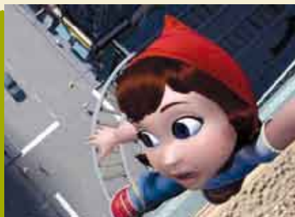
Capuchinho Vermelho: A Nova Aventura | 30 MAR