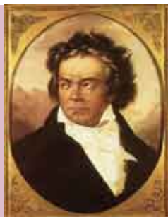
Beethoven no Seu Tempo | 14 ABR