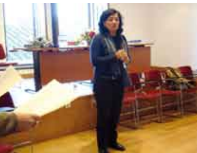
A Leitura em Voz Alta | 11 ABR