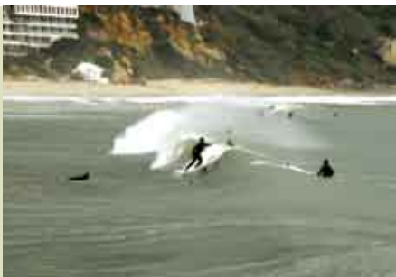
Iniciação ao Surf, Bodyboard e Skimboard | 3 e 5 ABR