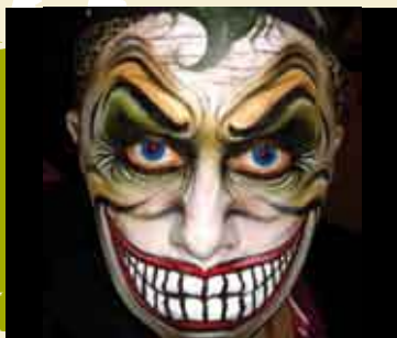
Pintura Facial e Caracterização | 21 ABR