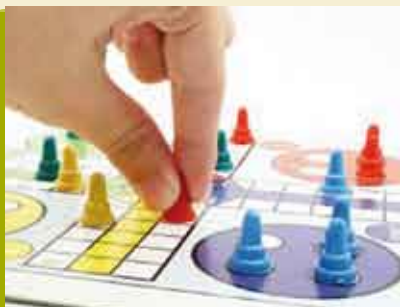
Não Te Irrites | 14 ABR