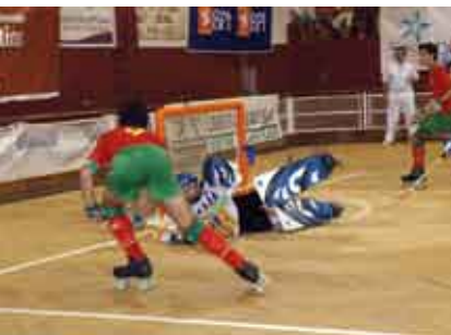
Torneio Praias de Sesimbra | 5 a 7 ABR