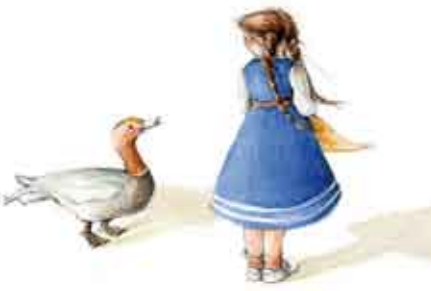
Valéria e a Vida | 20 MAR