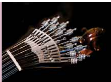
Noite de Fados | 9 MAR