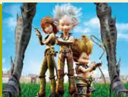
Artur e a Guerra dos Dois Mundos | 15 ABR