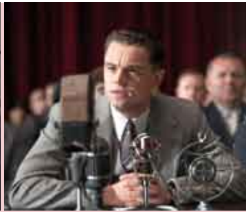
J. Edgar | 6 ABR