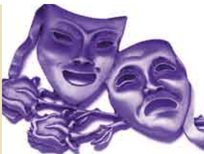
Técnicas de Teatro de Representação | 28 MAR