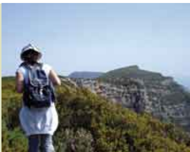
Na Crista do Risco | 31 MAR