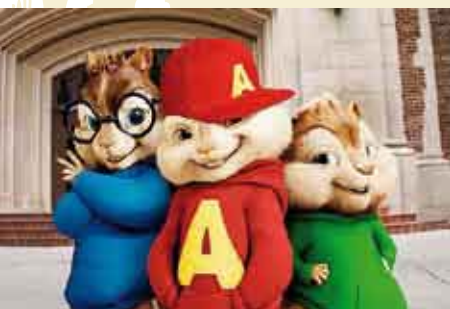
Alvin e os Esquilos 3 | 18 MAR