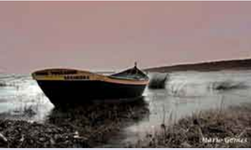
Momentos Fotográficos | MAR