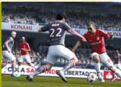
Pro Evolution Soccer | 21 ABR