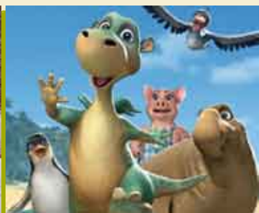
A Ilha de Impy | 1 ABR