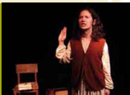
Anne Frank, Um Diário | 16 MAR