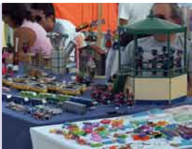
Zimbr'Arte | 25 MAR