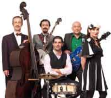
Os Eléctricos | 3 MAR