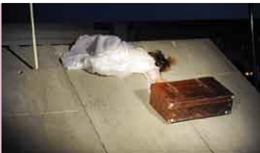
A Saboaria | 24 MAR