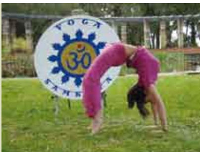
Yoga para Todas as Idades | 7 ABR