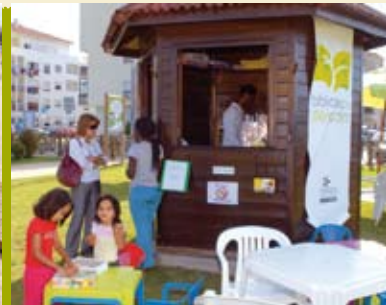
Bibliotecas de Jardim | 1 JUL a 31 AGO