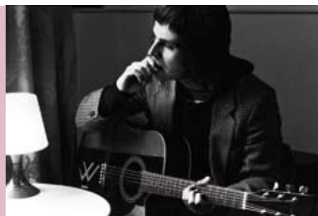
The Weatherman | 17 JUL