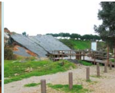
Nucleo da Pedreira do Avelino