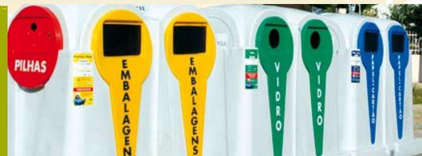
O Destino do Ecoporto Amarelo | 18 e 25 AGO