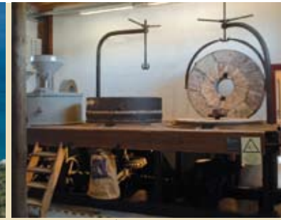
A Moagem na Capela | 12 JUL e 16 AGO

1 a 19 JUL EXPOSIÇÃO COLETIVA DE ARTISTAS NACIONAIS E INTERNACIONAIS À Imagem de Sesimbra • de terça a sexta, das 9.30 às 19, sábados, das 10 às 18h Átrio da Biblioteca Municipal de Sesimbra