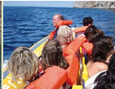
Arrábida Costa-a-costa | 3 AGO