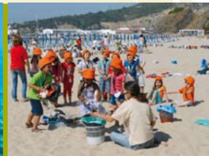
A Lagoa Vem à Praia | 7 e 21 AGO