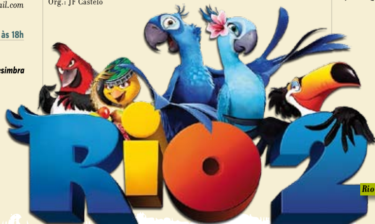
Rio 2 | 14 AGO

terça a sábado MusicArte • Objetivo: criar um novo conceito de apoio às bandas, músicos e técnicos de multimédia da Quinta do Conde • Informações: 21 080 96 66 / musicarte.anime@gmail.com / http://www.facebook.com/musicarteanime