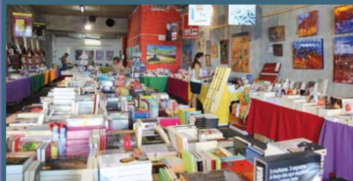
Praias do Meco, Lagoa de Albufeira, Califórnia e Ouro e Parque da Vila

As praias do Meco, Lagoa de Albufeira, Califórnia e Ouro vão voltar a receber o projeto Bibliotecas de Praia, uma das imagens de marca das praias de Sesimbra. Desde 2009, o sucesso das Bibliotecas de Praia estendeu-se também ao Parque da Vila, na Quinta do Conde, que passou a ser o ponto de encontro de muitas crianças e jovens da freguesia. Com mais de duas décadas de existência, os espaços são frequentados por milhares de veraneantes, que procuram não só à bibliografia disponível, mas também as diversas iniciativas promovidas quase todos os dias, sobretudo para o público mais jovem. Este ano, o programa apresenta diversas horas do conto, ateliés de sensibilização ambiental, dinamizados pelo projeto MARLISCO, e atividades promovidas pelos voluntários do projeto.