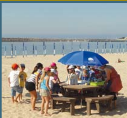
Praias do Ouro, Califórnia, Meco e Lagoa de Albufeira

Espaço Interpretativo da Lagoa Pequena sem tirar os pés da areia são algumas das ações de sensibilização ambiental em que adultos e crianças vão poder participar. O programa é organizado pela Câmara Municipal de Sesimbra, com apoio da Liga para a Proteção da Natureza, Extruplãs e Escola de Mar.