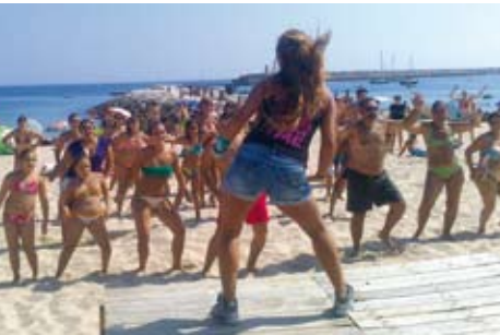
Zumba | 12 JUL