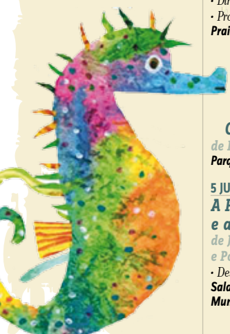
O Senhor Cavalo-marinho | 3 e 4 JUL