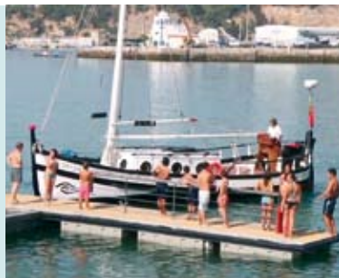
Sesimbra Monumental e Marítima | 26 JUL