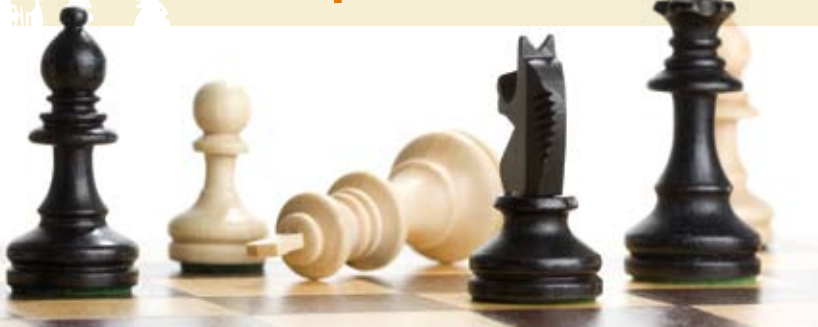
Mostra que Sabes Jogar Xadrez | 19 JUL