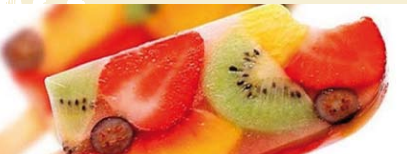
Vem fazer Sorvete de Fruta | 14 AGO