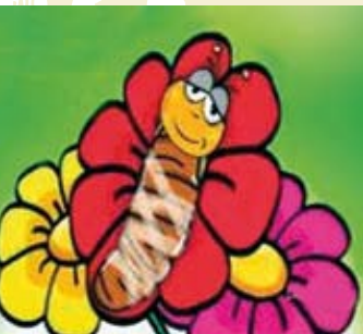
O Sonho de uma Minhoca | 1 e 4 JUL O Meu Vizinho é um Cão | 24 JUL