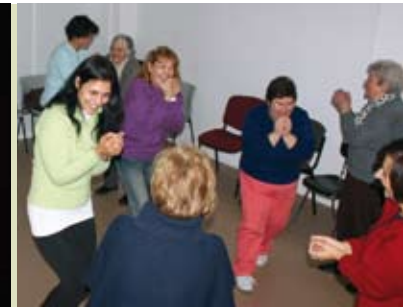
Clube Equilíbrio e Bem-estar