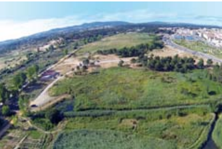
Percurso Interpretativo Pedestre de Natureza | 12 AGO