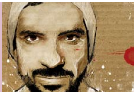
O Martim | 21 AGO