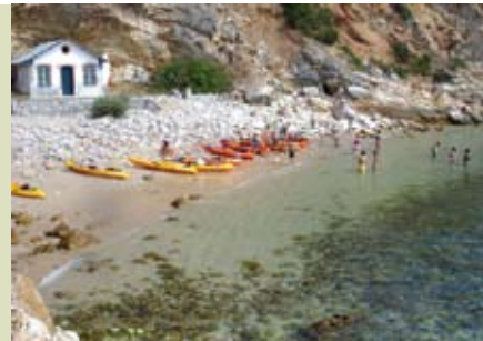
Arrábida Mar | 26 JUL