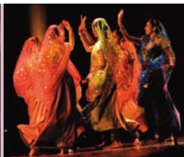
Festa do Diálogo Intercultural | 12 JUL