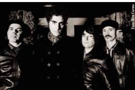
The Poppers | 3 JUL