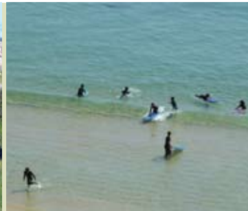
Iniciação ao Surf, Bodyboard e Skimboard | 12 AGO