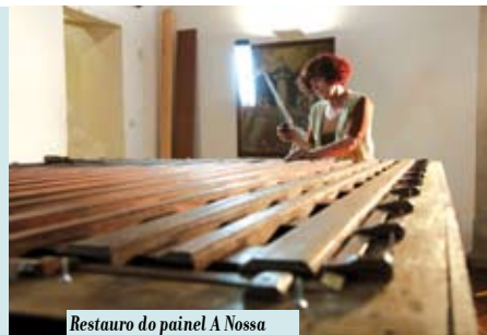
Restauração do painel A Nossa Senhora da Misericórdia | JUL