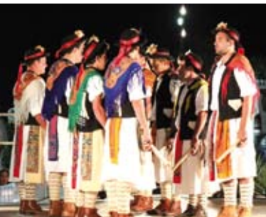
II edição do Festival de Folclore | 9 AGO