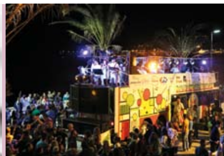
11.º Tripa Trio