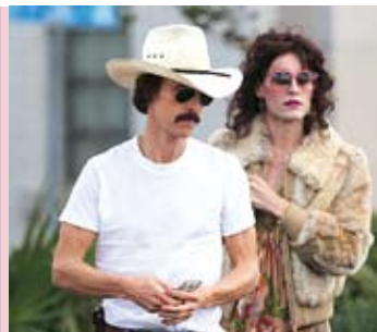
O Clube de Dallas | 20 JUL