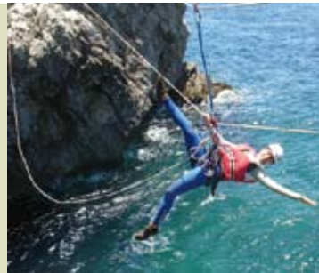
Enseada da Mula | 12 JUL