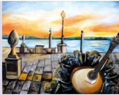
Dias Musicais | 1 a 30 AGO