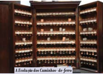
A Evolução dos Caminhos-de-ferro em Portugal | 22 JUL a 9 AGO