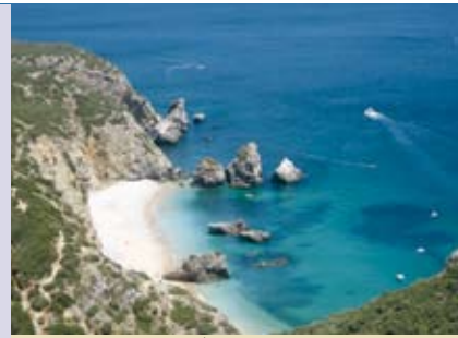
Projetos Ecos-locais | 17 JUL e 21 AGO