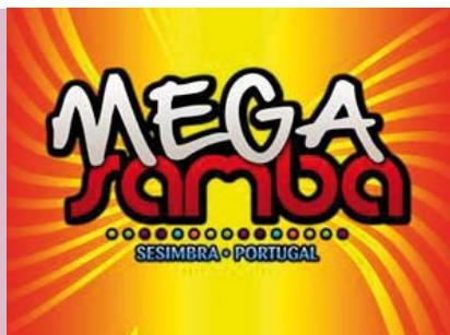
Mega Samba | 24 a 27 JUL