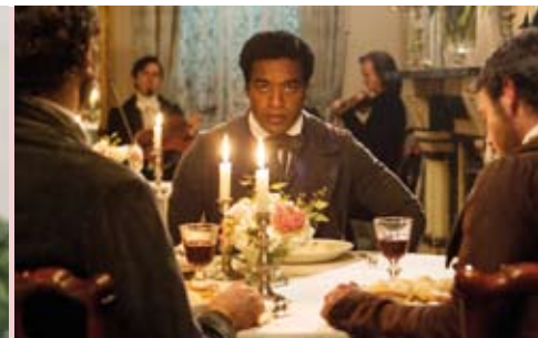
12 Anos Escravo | 3 AGO

8 AGO | sex | 21.30h HOT CRAZY NIGHTS Noite Cabo Verde FASCP Anfiteatro da Boa Água, Quinta do Conde