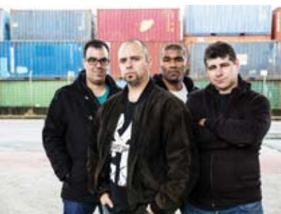
Manifesto | 24 JUL