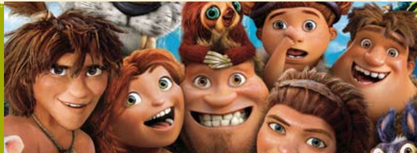
The Croods | 7 AGO