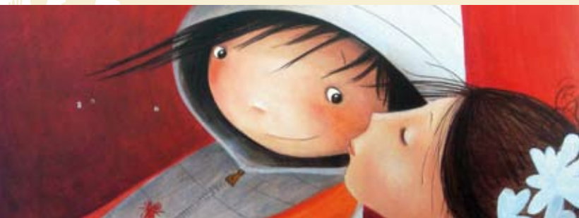
A Grande Fábrica de Palavras | 14 AGO