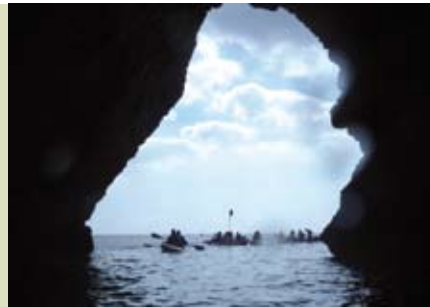
Sesimbra Selvagem | 16 AGO