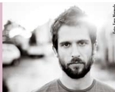
Noiserv | 31 JUL