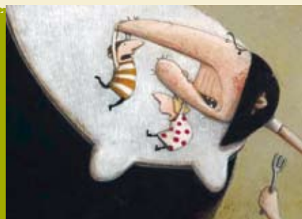
Os Dois Irmãos e a Bruxa | 19 e 22 AGO