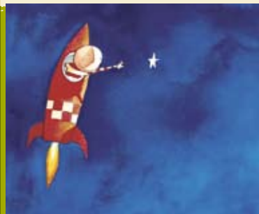
Como Apanhar uma Estrela | 18 e 19 JUL Lobo Grande e Lobo Pequeno | 29 JUL a 1 AGO