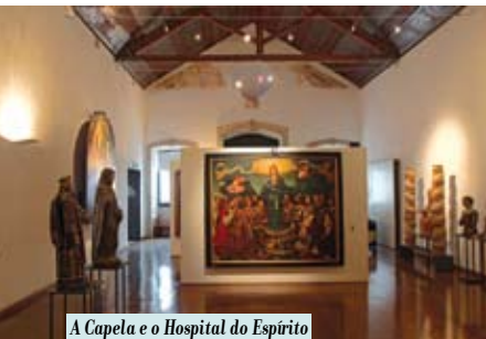
A Capela e o Hospital do Espírito Santo | 19 e 25 JUL, 1, 8 e 15 AGO