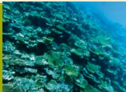
Há Vida no Fundo do Mar | 6 e 20 AGO