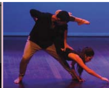
Projecto Quorum | 18 JUL