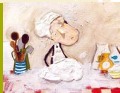
Maruxa | 28 AGO