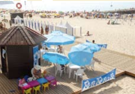
Bibliotecas de Praia | 1 JUL a 31 AGO