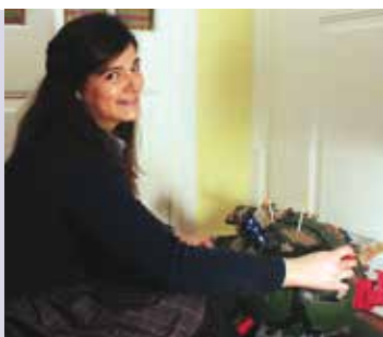
Caminho... De Fio a Pavio | de 7 a 29