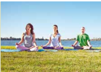
Meditação de Relaxamento | segundas e quintas