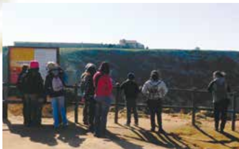
Aguncheiras - Arribas do Meco | dia 29