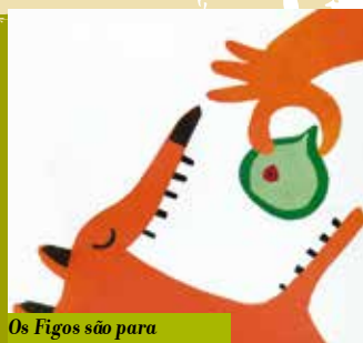
Os Figos são para Quem Passa | a decorrer