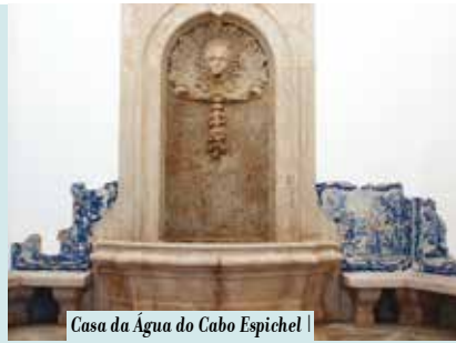
Casa da Água do Cabo Espichel | sábados, domingos e feriados