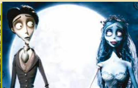
Caroline e o Mundo Secreto | dia 11 A Noiva Cadáver | dia 18