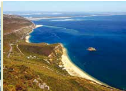
Observação de Golfinhos | dias 4, 7, 11, 15, 19 e 25