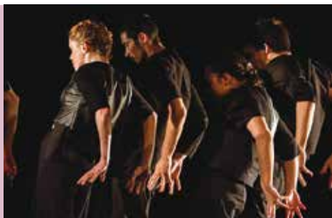
The Art of Losing | dia 28