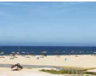
Rota do Cabo Espichel à Lagoa | dia 14