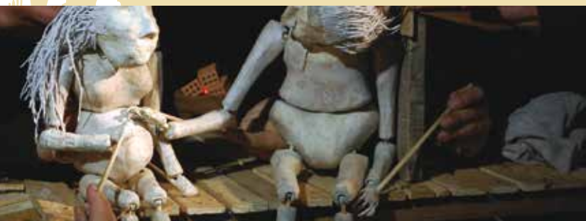
Chiflón, o Silêncio do Carvão | dia 8