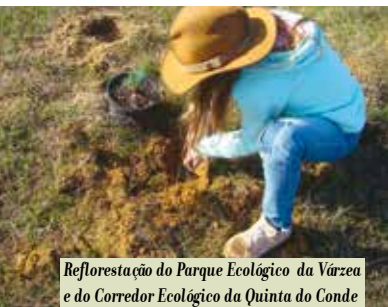
Reflorestação do Parque Ecológico da Várzea e do Corredor Ecológico da Quinta do Conde | a partir de dia 30