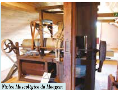
Núcleo Museológico da Moagem de Sampaio | quarta a domingo