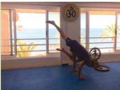
Yoga com Vista Mar | segunda a sábado