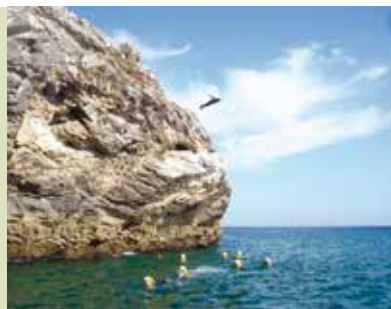
Enseada da Mula | dia 7