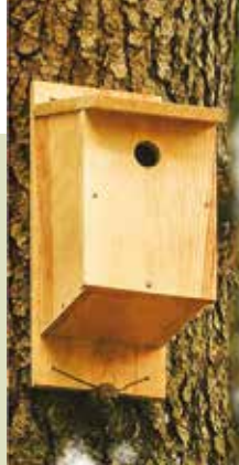
Colocação de Ninhos | dia 21