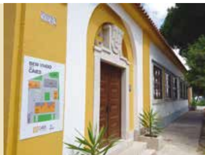
Saúde e Energia à Mesa! | dia 15