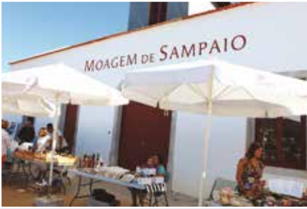
Sabores da Nossa Terra | sábados e domingos