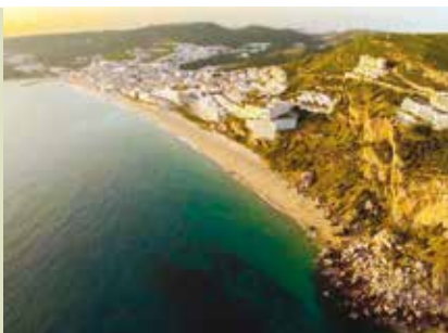
Passeios Guiados e Experiências | a decorrer...