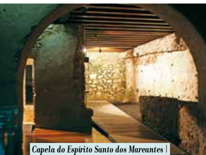
Capela do Espírito Santo dos Mareantes | segunda a domingo