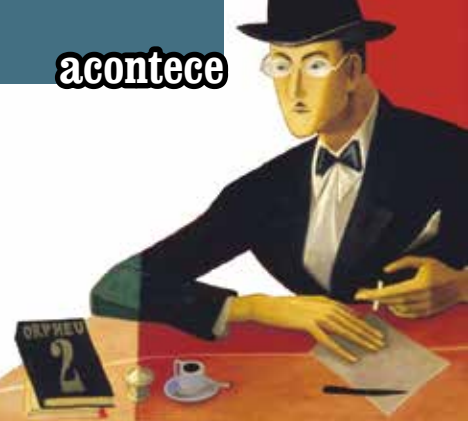
Nós, Os de Orpheu | a partir de dia 3