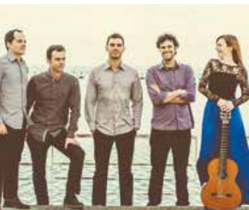
Quarteto de Guitarras de Lisboa | dia 14