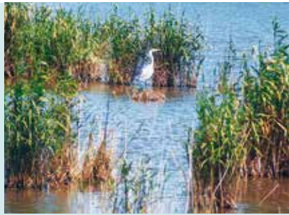
Lagoa Pequena | quartas, sextas, sábados e domingos