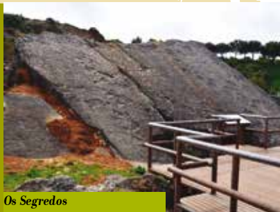
Os Segredos das Pegadas dos Dinossauros

Noite das Bruxas - 3.ª Edição | dias 28 a 29