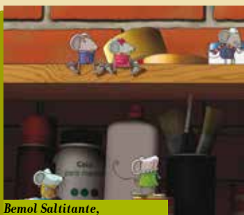
Bemol Saltitante, um Ratinho ao Piano | dia 31