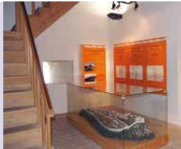
O Castelo de Sesimbra | segunda a domingo