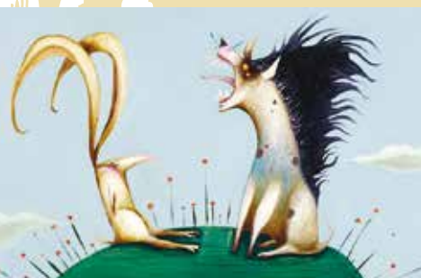
A Coisa que Mais Doi no Mundo | dia 10