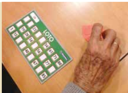
Ateliê de Jogos Tradicionais | dia 19

dias 4, 11, 18 e 25 | qua | das 10 às 11.30h