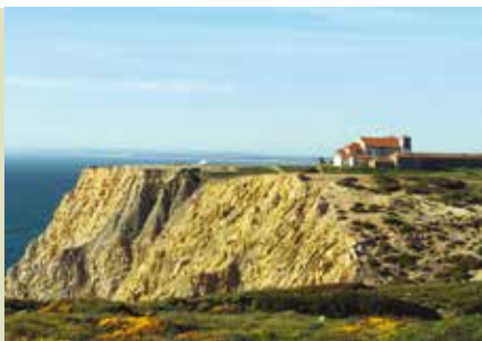
Rota do Cabo Espichel à Lagoa | dia 8