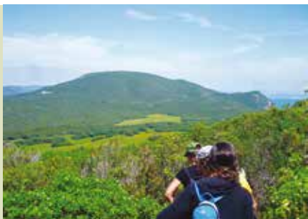
Na Crista do Risco | dia 15