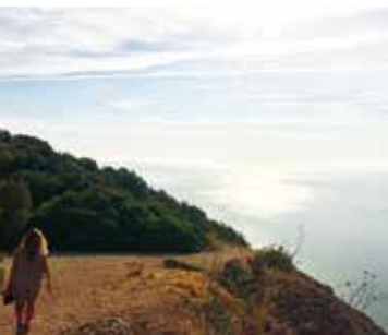
Rota da Arrábida | dia 25