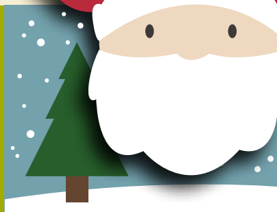
Calendário do Advento | dia 28