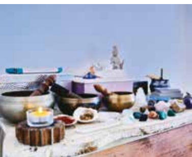
Iniciar a Meditação | dia 1 e 25