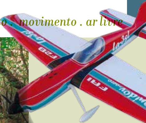
7.º Troféu D'Outono CLP de Combate | dia 19