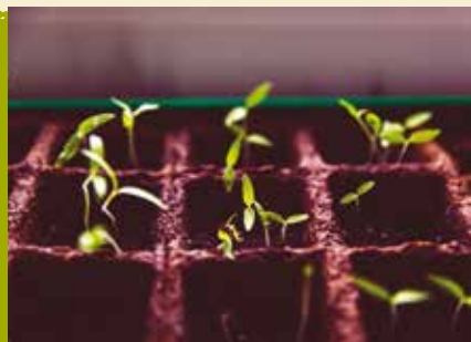
Manhãs Verdes | terças