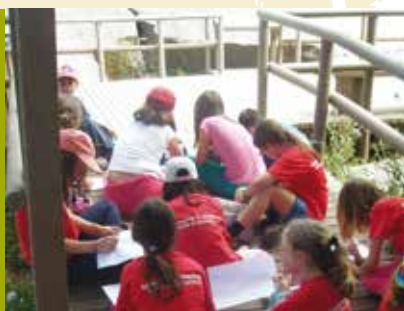
Os Segredos das Pegadas de Dinossauros