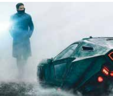
Blade Runner | dia 10