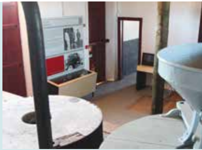
Moagem de Sampaio