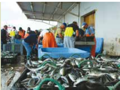
Passeios Guiados e Experiências | a decorrer...