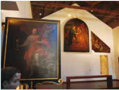
Capela do Espírito Santo dos Mareantes