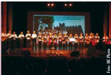
Grupo de Cantares do Castelo | dia 11