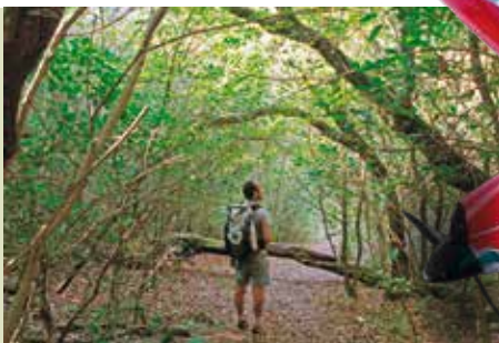
Topo da Arrábida | dia 12