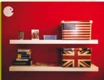
Aulas de Inglês para Jovens | quartas