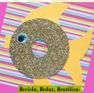
Recicla, Reduz, Reutiliza: