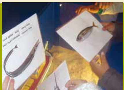
Vamos ao Mar