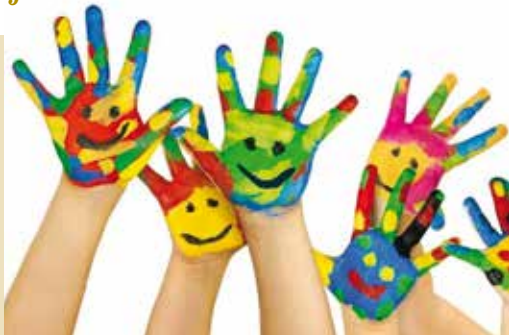
Auxiliar de Ação Educativa | inscrições

dias 29 e 30 | qua e qui das 20.30 às 23.30h