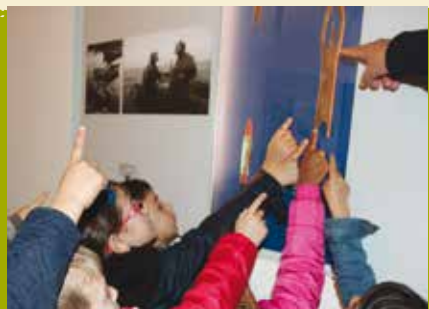
Vamos Jogar e Encontrar | dia 16