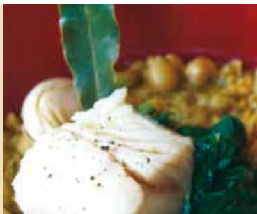
Comer Bem Também Pode ser Barato | dia 18