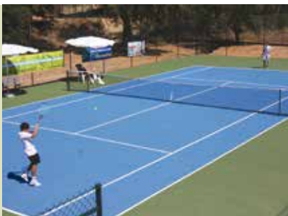
Escola para Jovens e Adultos | a decorrer...