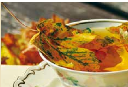
Já é Outono | dia 9