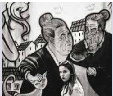
Arquivo | até dia 30