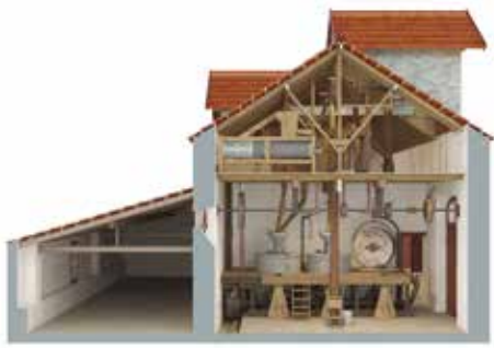
Uma "Viagem" à Primeira Metade do Século XX | a decorrer...