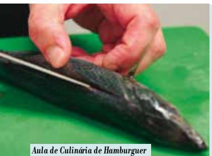
Aula de Culinária de Hamburger de Cavala | dia 15