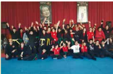
Bujinkan Ninjutsu | a decorrer...