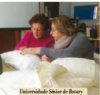
Universidade Sénior de Rotary de Sesimbra | segundas e sextas