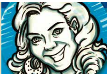
Belivro: Ler e Ser 111% Feliz | dia 4