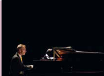
Divertimento a Duas Vozes | dia 24