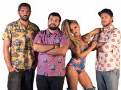
Putzgrilla | dia 23