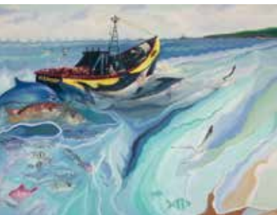
Marés de Arte | de 1 a 18