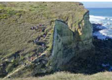
Por Caminhos de Santiago | dia 30