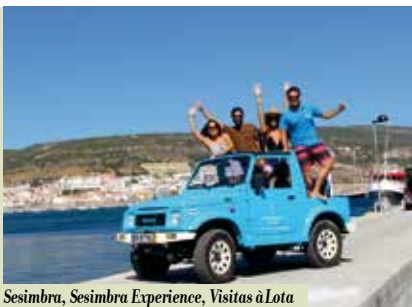
Sesimbra, Sesimbra Experience, Visitas à Lota e Visitas a Lojas de Companhia | a decorrer