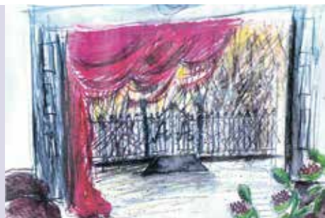
Cenografias e Figurinos | a partir de dia 31