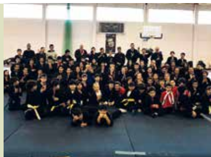
Bujinkan Ninjutsu | a decorrer