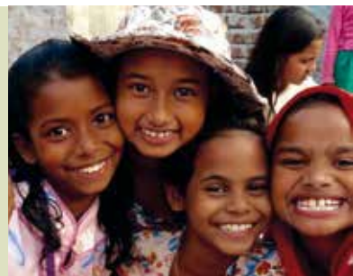
Caminhada Solidária | dia 4