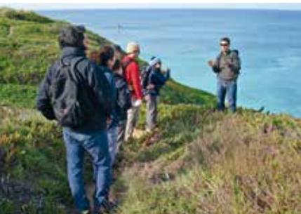
Maravilhas do Cabo | dia 18