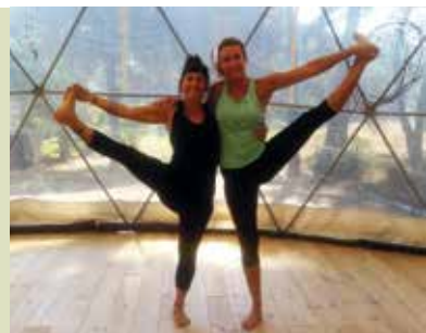
Aulas de Yoga | a decorrer