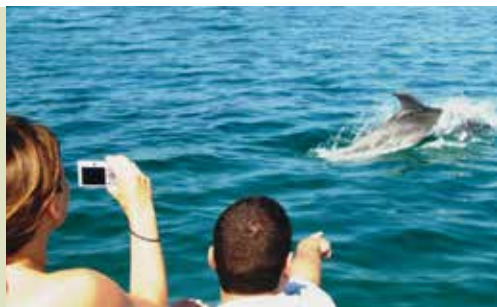
Observação de Golfinhos | dias 10, 17, 19, 25 e 31