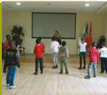
Kids Combat | dias 14 e 28