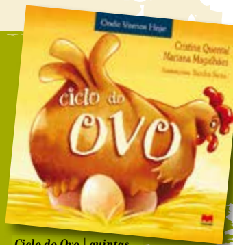
Ciclo do Ovo | quintas