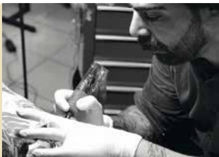
Workshop de Ilustração e Tatuagem | dias 27 e 28