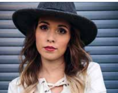
Como se Tornar Youtuber | dia 27