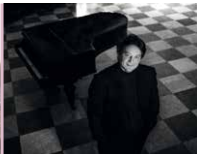
Two on The Town | dia 18