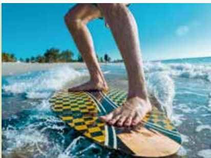
Surf, Skimming e Body Board | dia 28