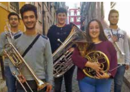
Do Barroco ao Cinema | dia 17