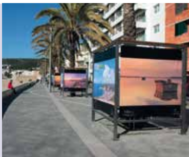
Momentos de Sesimbra | a decorrer