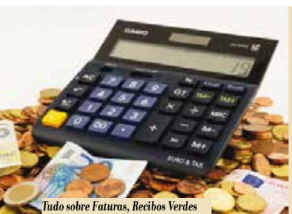
Tudo sobre Faturas, Recibos Verdes Eletrónicos e Atos Isolados | dia 3