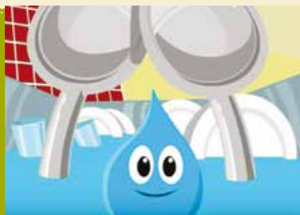
A Água é um Mundo Fantástico | dia 23