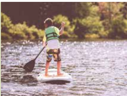
Stand Up Paddle | dia 28