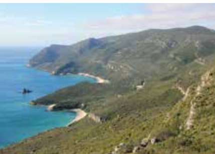
Rota da Arrábida | dia 3