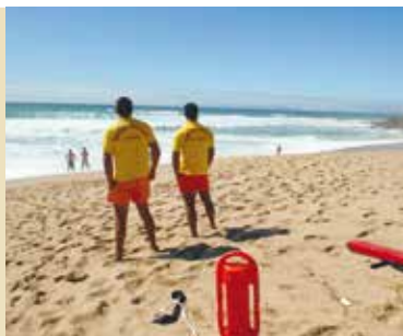
Nadador-salvador | inscrições