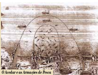
O Acedar e as Armações de Pesca de Sesimbra | dia 3