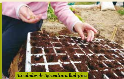
Atividades de Agricultura Biológica para a Comunidade Educativa | quartas