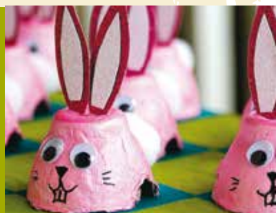
Coelho com Caixas de Ovos | dia 28