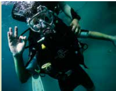
Batismo de Mergulho | dia 24