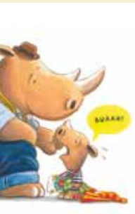
Não! | dia 20