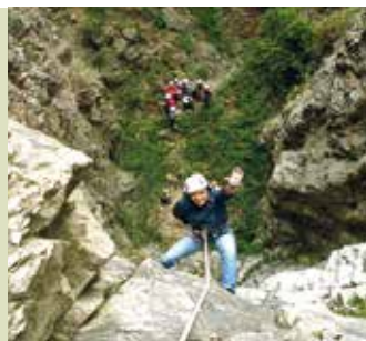
Círculo da Baleira | dia 10