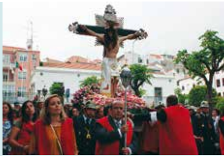
Festa em Honra do Senhor Jesus das Chagas | dia 4