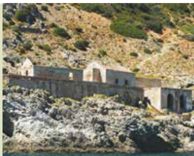
Calahu da Cova / Baía da Armação | dia 27