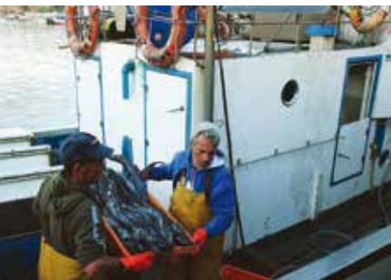
Dia do Pescador | dia 31