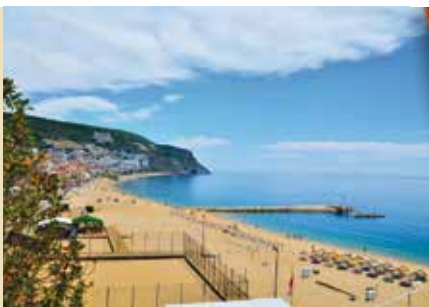
Plataforma TOUR4All | dia 15