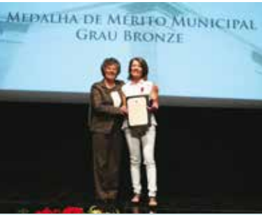
Condecorações Municipais | dia 4