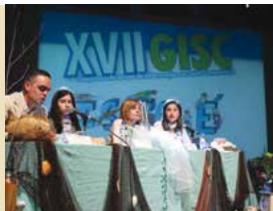
Saúde 4 All | dia 11