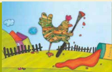
O Macaco que Ficou Sem Rabo | dia 12 Pimpona, a Galinha Tonta | dia 15