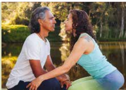
Relação Criativa com Siva | dias 19 e 20