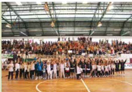
III MCBoos Hip Hop Dance Competition | dia 26