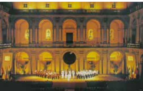
Le Città d'Arte Della Pianura Padana | a partir de dia 22