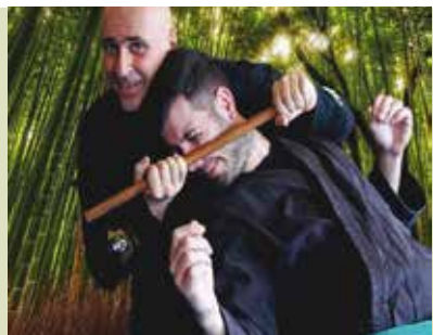
Taikai Portugal 2018 | de 17 a 20