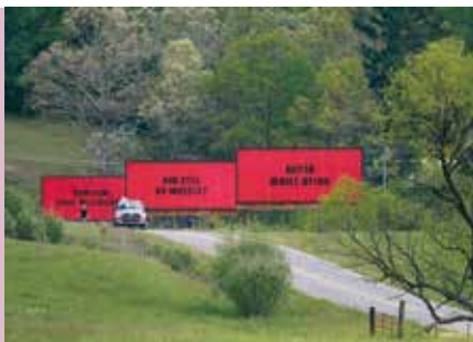
Três Cartazes à Beira da Estrada | dia 25