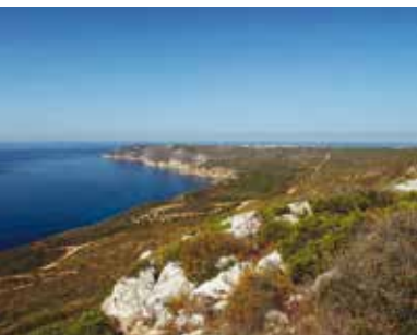
À Descoberta da Serra dos Pinheirinhos | dia 20