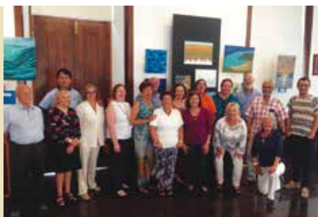
Universidade Sénior de Rotary de Sesimbra | a decorrer