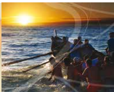
A Ternura dos Afetos e Ternura da Poesia | dia 19