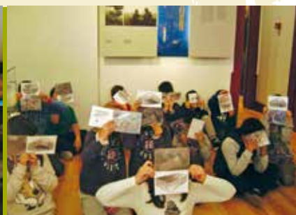
Vamos ao Mar | a decorrer...