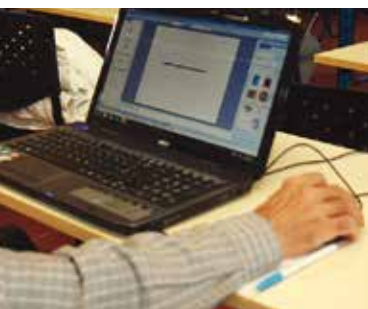
Informática Sénior | inscrições