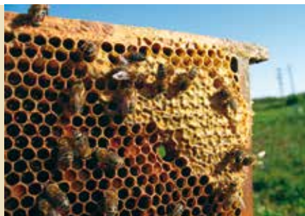
Instalação de Apiários | 11 MAI a 2 JUN