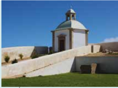
Casa da Água do Cabo Espichel