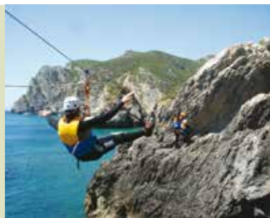
Enseada da Mula | dia 5