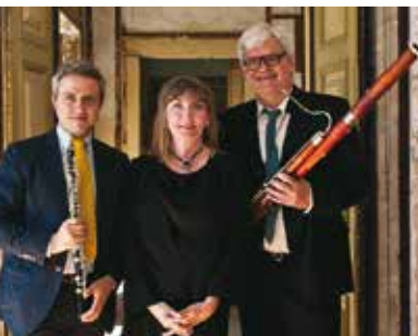
Trio Cremeloque | dia 12