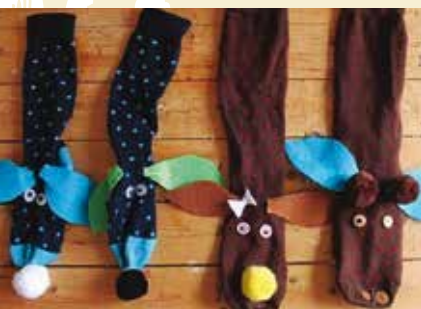
Fantoches com Meias | dia 10