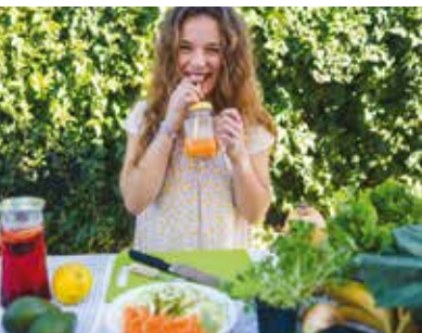
Workshop de Marmitas Saudáveis | dia 12