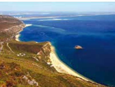
Rota da Arrábida | dia 12