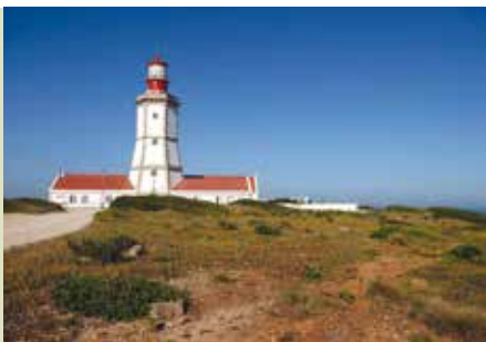
Rota do Cabo | dia 27