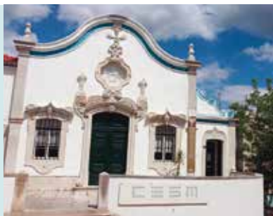
Capela do Espírito Santo dos Mareantes