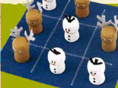
Jogo do Galo com Rolhas | dia 18