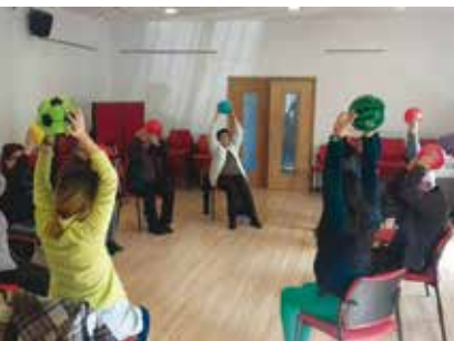
Corpo em Movimento Sénior | terças e quintas