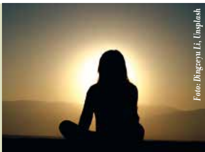
Um Somos Nós | sextas