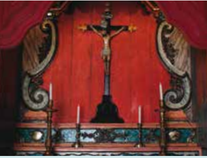
Museu Marítimo de Sesimbra