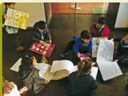
A Descoberta | a decorrer...