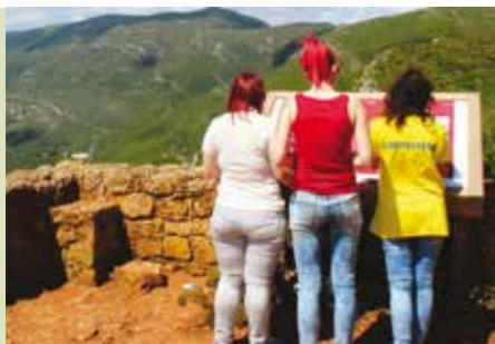
Nascer do Sol no Topo da Arrábida | dia 6