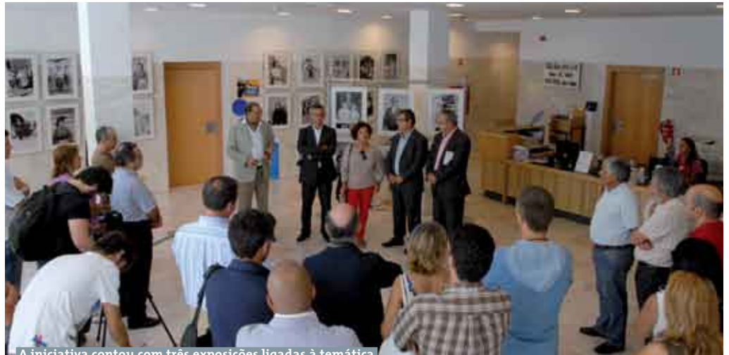
A iniciativa contou com três exposições ligadas à temática

principais pontos de atração para turistas e cinéfilos, mas também um ponto de investimento para grandes produções cinematográficas, trazendo com elas o retorno de futuros investimentos através da divulgação do património natural, científico, histórico e imaterial, entre outros, da região de Sesimbra», referiu. Para o fotógrafo sesimbrense contar com o apoio do Art & Tur - Festival Internacional de Filmes de Turismo de Barcelos foi «um privilégio e uma honra».