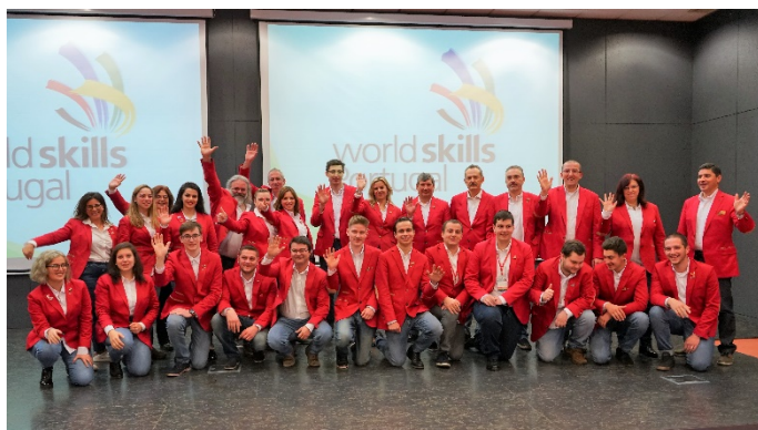
A seleção dos melhores jovens profissionais e dos jurados no 1.º estágio em Tomar

SEIXAL ACOLHE O SEGUNDO ESTÁGIO DA SELEÇÃO PORTUGUESA DAS PROFISSÕES