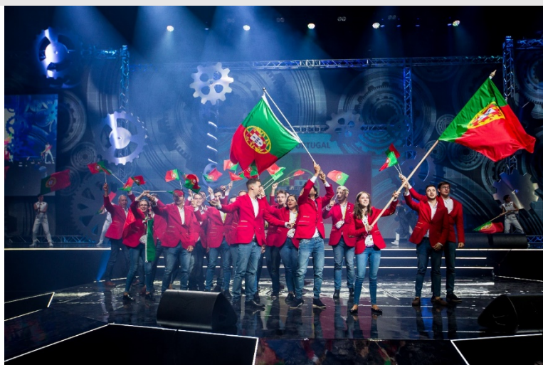
A entrada da seleção portuguesa na Arena de Budapeste na cerimónia de abertura do Campeonato Europeu das Profissões

Esta seleção representará agora Portugal no Campeonato do Mundo das Profissões, que se realiza de 22 a 27 de agosto, na cidade de Kazan, na Rússia.