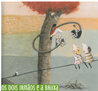
OS DOIS IRMÃOS e a BRUXA