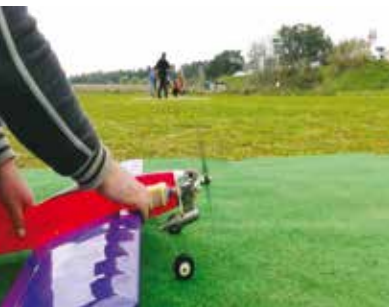
Classe de Voo Circular