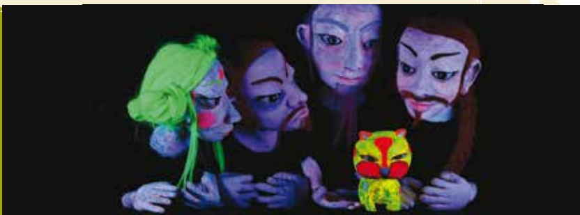
Teatro de Marionetas | dia 24