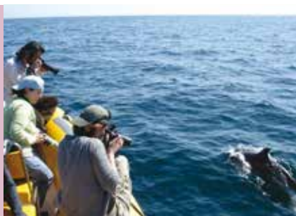
À Descoberta de Golfinhos | dias 1, 6 e 8