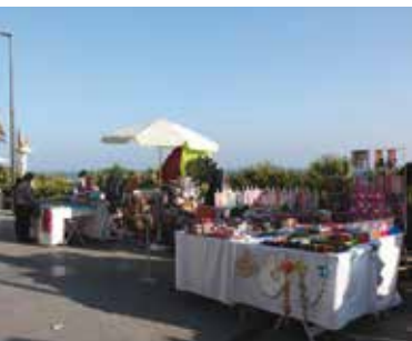
Zimbr'Arte | dia 10