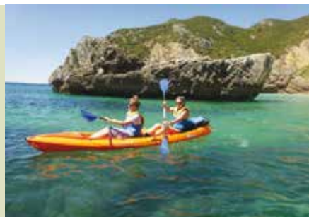
Sesimbra Selvagem | dia 17