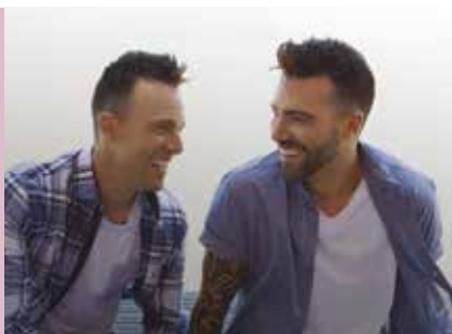
Músicas pelo Espichel | dias 16 e 17