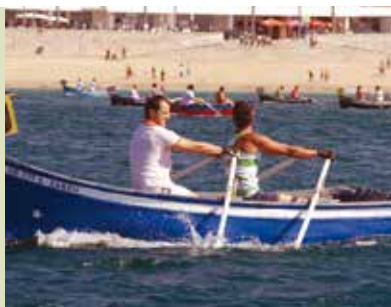
Regata de Aiolas | dia 25