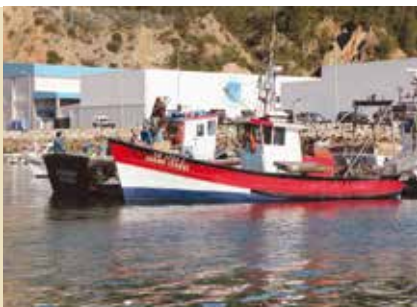
Arte, Comunidade... e Sesimbra | dia 17