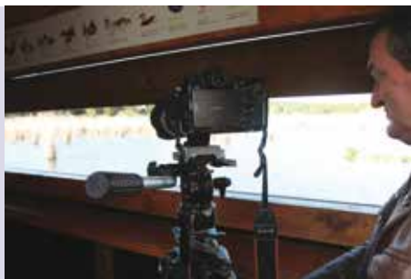
Lagoa Pequena na ObservaNature | dias 17 e 18