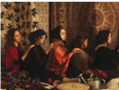
Arché | dia 17