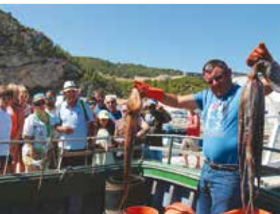
Venha Conhecer a Lota de Sesimbra