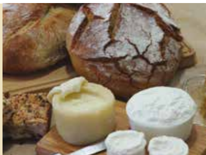
Valorização de Produtos Locais | dia 26