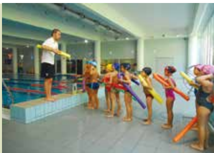
Piscina de Sesimbra

e informações: www.associacaomundodacorrida.com