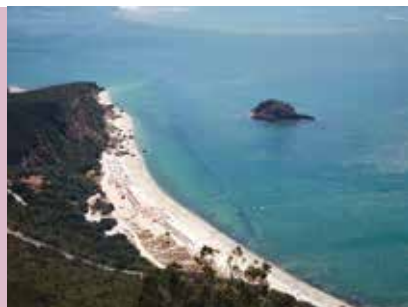
Rota da Arrábida | dias 3, 10 e 24