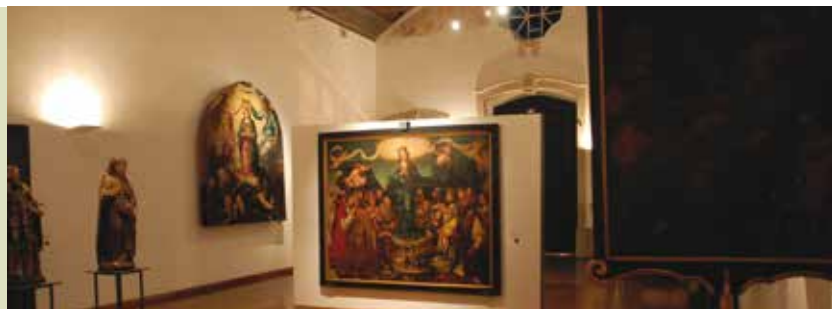
Artistic Treasures Tour

• Informações: www.weareportugalska.com / www.facebook.com/weareportugalska Ponto de encontro: Fortaleza de Santiago, Sesimbra Org.: Portúgalska – Sesimbra Walking Tours