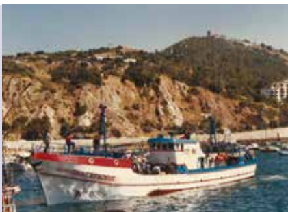
A Frota do Peixe-espada Branco | a decorrer