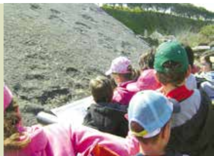
Núcleo Interpretativo da Pedreira do Avelino