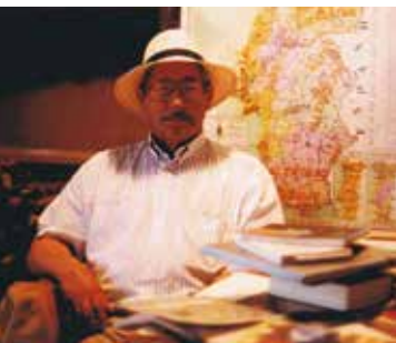
Livros, Leituras, Literatura | dia 24