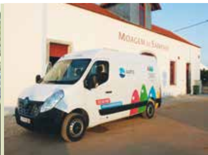
Cabaz do Peixe

quartas, sextas, sábados e domingos | das 9 às 13 e das 14 às 17h