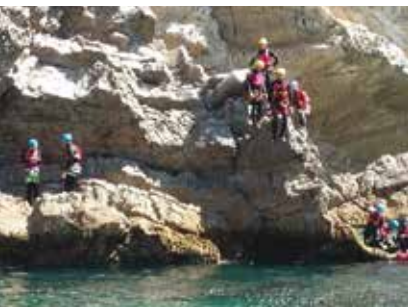
Enseada da Mula | dia 1, 3, 4 e 18