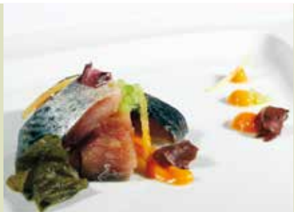
Semana Gastronómica da Cavala