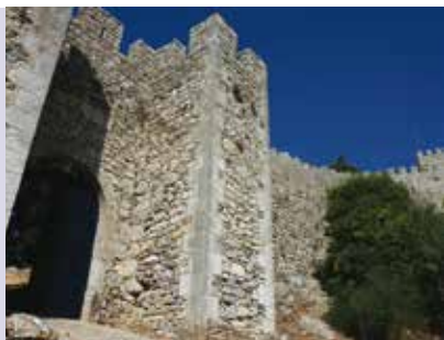
Foral de Sesimbra | a decorrer