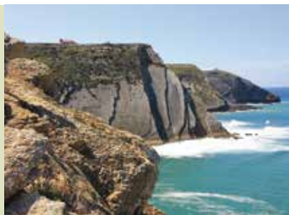
Rota do Cabo Espichel à Lagoa | dias 4, 11, 18 e 25